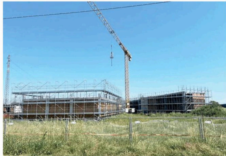
Il cantiere della nuova scuola Papa Giovanni di Nichelino