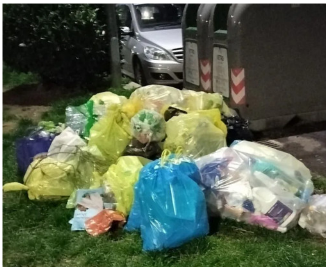
Nichelino, il M5S va all'attacco sulla raccolta rifiuti (foto d'archivio)

In una lunga nota i pentastellati mettono in mirino l'assessore Faienza: "Quartieri abbandonati al degrado"