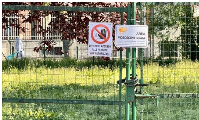
L'area cani di via Don Minzoni a Nichelino

L'assessore: "Chiusa per decisione delle forze dell'ordine, polemica strumentale". La replica: "Depositare oltre 300 firme per una petizione popolare che ne chiede la riapertura. E' un nostro diritto avere una risposta"