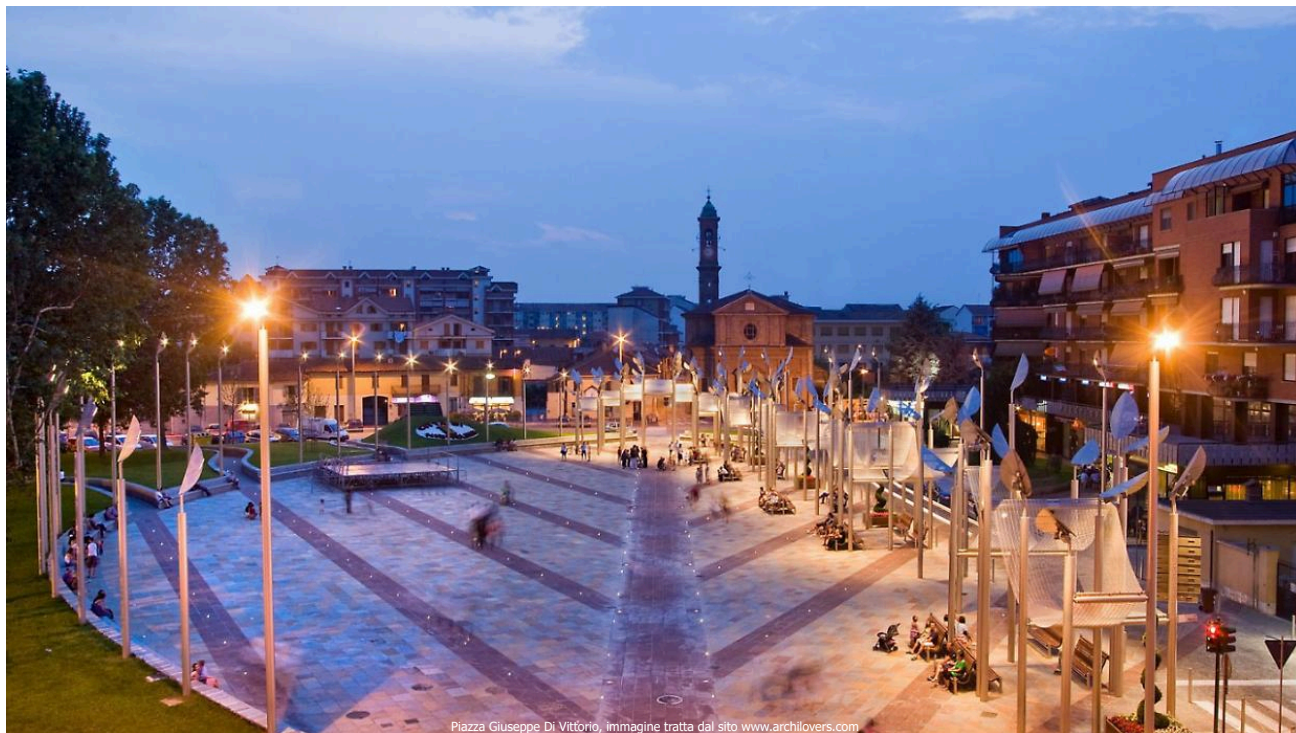
Piazza Giuseppe Di Vittorio