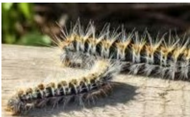
Allarme processionaria a Nichelino, attenzione per bambini e cani

Come comportarsi e cosa (non) fare: alcuni consigli utili