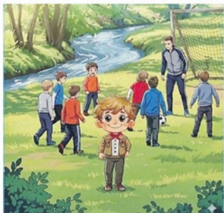
Sigelin alle prese con il gioco del calcio.