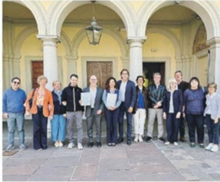
La sottoscrizione del protocollo, lunedì 20.

Presentato lunedì 20, il protocollo nasce come evoluzione di un percorso già avviato negli anni, a partire dall'esperienza sui disturbi specifici dell'apprendimento. «Oggi facciamo un altro passo avanti - sottolinea Alessandro Azzolina, assessore all'Istruzione e all'Edilizia scolastica -. In un tempo segnato da guerre e discorsi di odio, scegliamo di investire sulle competenze relazionali e socio-emotive, mettendo al centro le persone». Un «passaggio importante nella rivoluzione scolastica che stiamo costruendo», che oltre ad investire sugli edifici punta a lavorare sul benessere e sulla capacità di fare rete. Il protocollo, della durata di tre anni, prevede azioni concrete: formazione degli insegnanti, laboratori per gli studenti, strumenti condivisi di valutazione e momenti pubblici di confronto e restituzione. L'obiettivo è integrare stabilmente l'educazione socio-