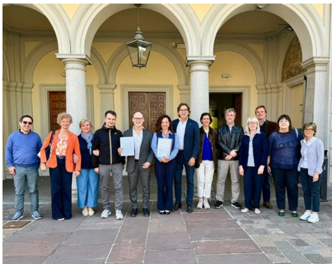
A Nichelino scuole, formazione professionale e Comune fanno rete