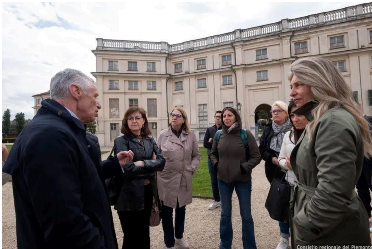
Consiglio regionale del Piemonte