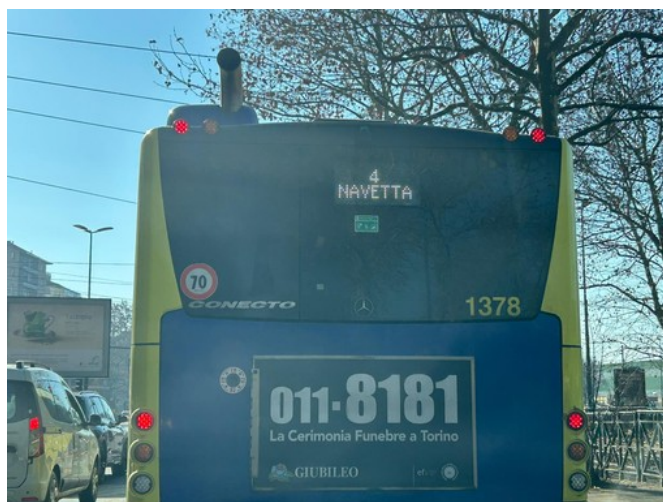
L'immagine di un mezzo della linea 4

La consigliera regionale di Avs incalza: "La destra ha deciso di non discutere nemmeno la mozione che prevedeva la sperimentazione di una navetta tra il capolinea del 4 e la Palazzina di Caccia"