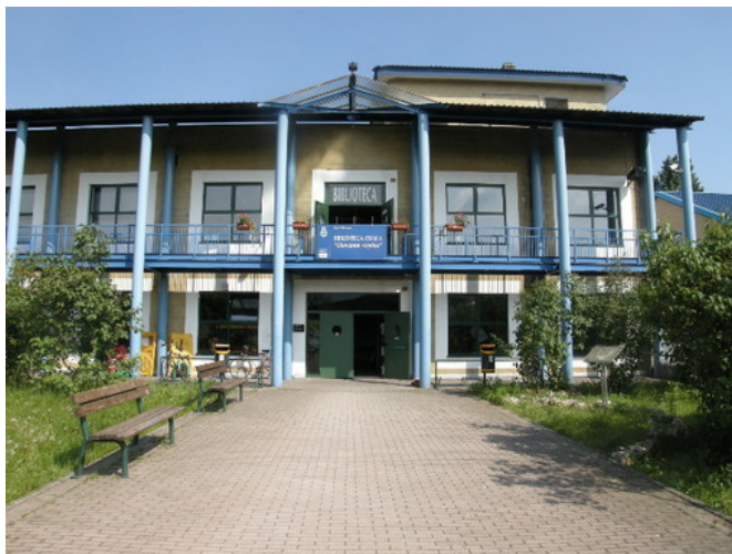
La biblioteca civica di Nichelino intitolata a Giovanni Arpino

Dal 23 aprile al 29 maggio, spazi diffusi e appuntamenti in collaborazione con Salone OFF