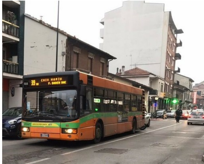
Un autobus della linea 39 in transito a Nichelino

Prosegue il tour dell'assessore Di Lorenzo, che assieme al sindaco Tolardo, spiega come si punta a risolvere le criticità, tra pullman vecchi e ritardi cronici