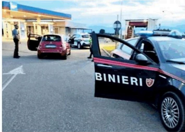
Controlli rinforzati a Nichelino dopo l'ondata di furti