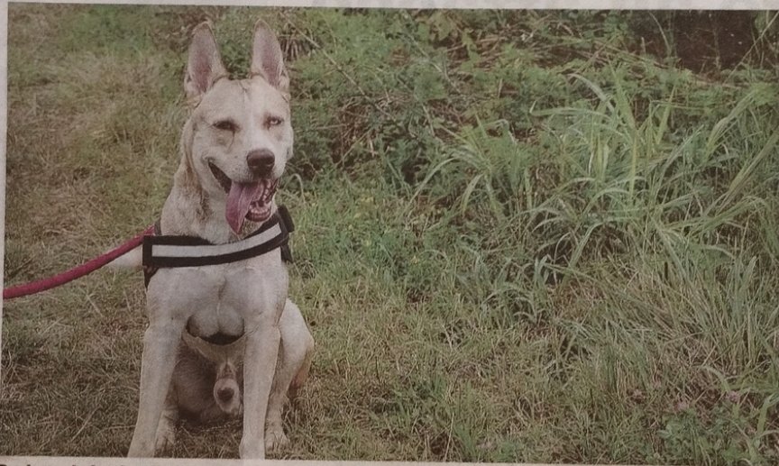
Drake, mix husky di 3 anni: uno dei cani vittima del fenomeno degli abbandoni immotivati