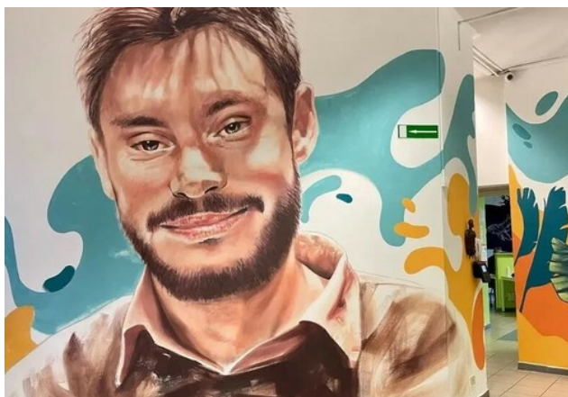
L'informagiovani di Nichelino, intitolato di recente a Giulio Regeni

La scadenza per l'invio delle domande è l'8 aprile: tutto quello che c'è da sapere