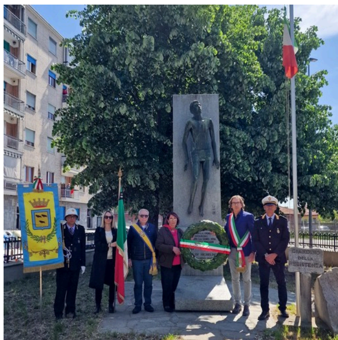
Una immagine di archivio del 25 Aprile a Nichelino

Lo slogan scelto è "25 aprile 2026, 81 anni di Libertà"