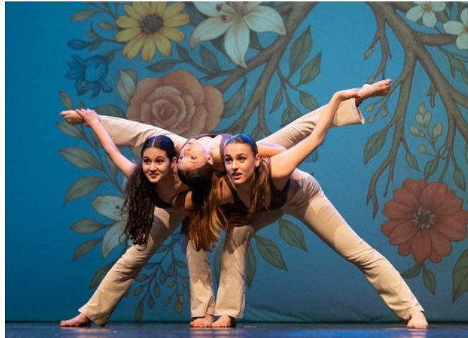
A Nichelino uno spettacolo a favore della Ricerca sulla Fibrosi Cistica

Appuntamento domenica 19 aprile al Teatro Superga