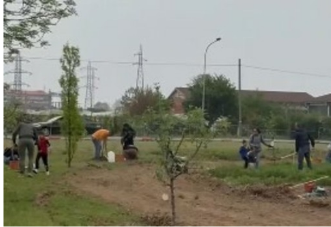
A Nichelino nasce il primo frutteto 'partecipato'