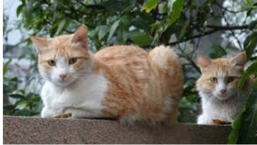
Weekend di raccolta delle derrate alimentari per le colonie feline di Nichelino

Tutto quello che c'è da sapere sull'iniziativa