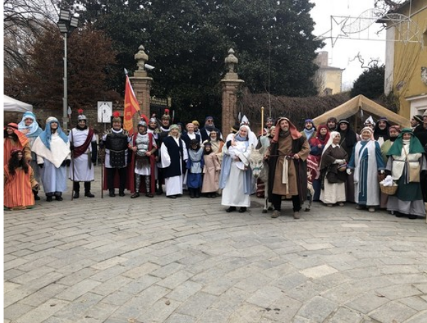
Una immagine della scorsa edizione del Presepe Vivente a Nichelino

Domani, sabato 20 dicembre, la nuova edizione del Presepe vivente, con oltre 100 figuranti protagonisti