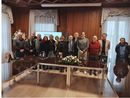
Comunità energetica da fonti rinnovabile Mn: Nichelino entra con il Superga e la Gramsci

Lo storico teatro e la scuola elementare, grazie al fotovoltaico, produrranno e contribuiranno alla distribuzione di energia pulita