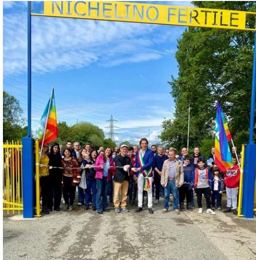
Contributi per la forestazione urbana: Nichelino Fertile ottiene 1,4 milioni

La Giunta regionale ha finanziato il progetto portato avanti dall'assessore all'Ecologia integrale Azzolina