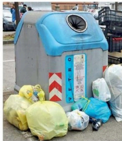
Saranno incentivati i cassonetti per la differenziata nei cortili

Nel quadro rientra la revisione del regolamento comunale per la gestione dei rifiuti, che fisserà criteri più stringenti per la collocazione dei