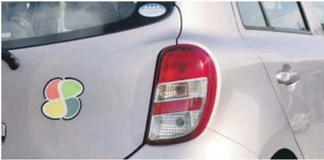
Il simbolo proposto dal Comune di Nichelino ai guidatori anziani.