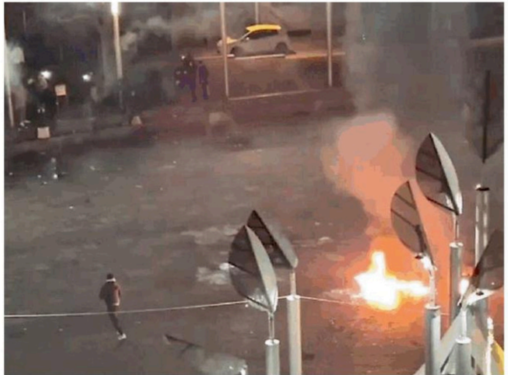
Un'immagine del Capodanno degli anni scorsi: quest'anno più controlli sul territorio