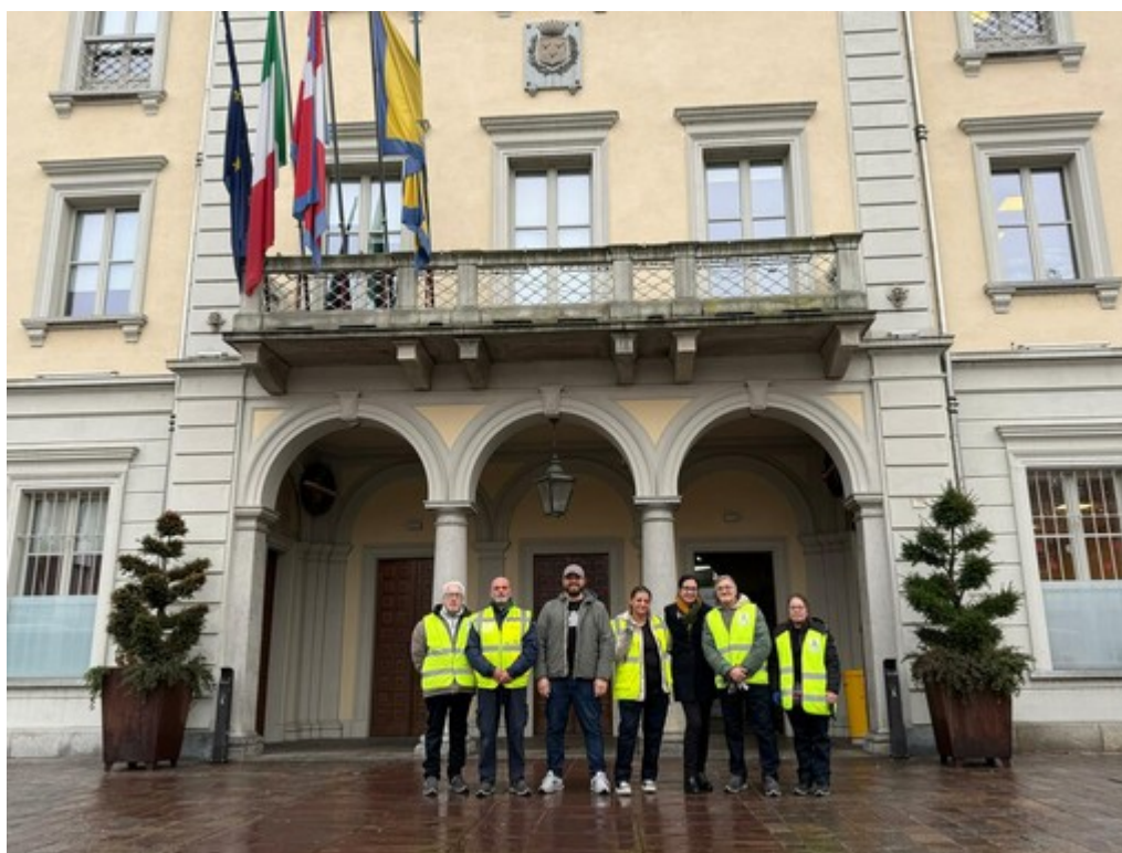
Cantieri di lavoro a Nichelino: 7 persone assunte per 12 mesi

Arrivano a 20 il totale di coloro che hanno trovato occupazione nel corso del 2025, compresi i progetti di pubblica utilità del Comune. Attenzione speciale per gli over 58