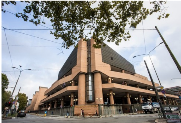
L'esterno del Palazzo di Giustizia di Torino

Sentenza di primo grado per la vicenda avvenuta nel marzo 2020, in piena pandemia: una condanna e un'assoluzione per gli altri due imputati