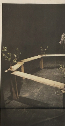
A pagina 14: Ugo Dighero, a Cantalupa il 12 dicembre. Nella foto sopra: "L'importanza di chiamarsi Ernesto" e "Orfeo", al Teatro S.

VILLAFRANCA Alle 21, al Teatro S. Maria, spettacolo "Il dono", spettacolo teatrale di teatro sociale, con attori locali e bambini del territorio. Ingresso: 5 euro. Info: 011 310 3103 o info@teatrocantalupa.it