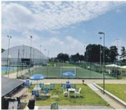
Gli impianti sportivi del Candiolo Village.

Che, nella premessa, ha evidenziato: «Toboga, stante la concessione, doveva farsi carico delle utenze (telefoni-