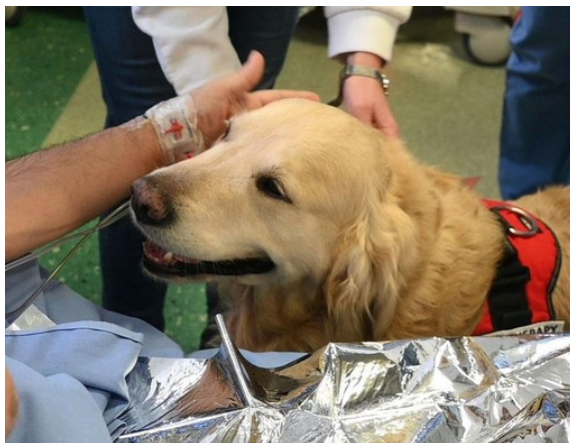
La pet therapy prende casa all'Engim di Nichelino (foto d'archivio)

Una iniziativa che coinvolge ragazzi tra 14 e 18 anni. Verzola: "Obiettivo formare una Generazione Cinofila"