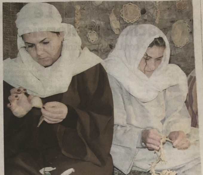
Dietro la rappresentazione della Natività la Comunità si ritrova e lavora insieme.

I bambini osservano con occhi di sorpresa, gli adulti riscoprono emozioni che credevano sopite e l'intero paese, per una sera, ritrova un'armonia che profuma di speranza. Così, ogni presepe vivente diventa un dono: un frammento di Natale che rimane nelle strade e nei cuori.