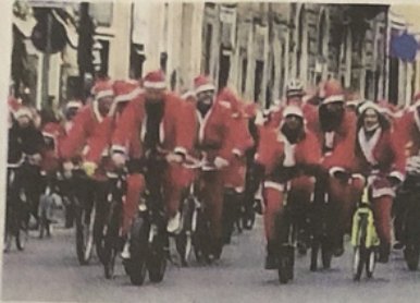
In attesa del 25 dicembre pedalate con Babbo Natale e tombolate in compagnia di amici.