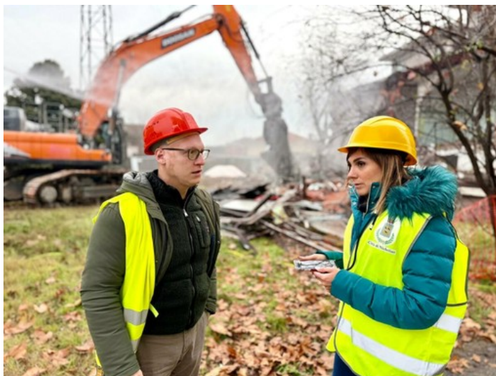
Nichelino, iniziato l'abbattimento della vecchia elementare "Papa Giovanni"

Al suo posto sorgerà un parco, mentre stanno procedendo i lavori per edificare la nuova scuola, che sarà green e ad impatto zero