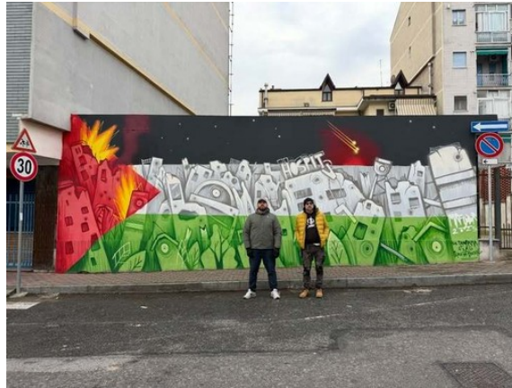
Nichelino, un murale per tenere acceso un faro sulla tragedia di Gaza

L'ultimo tassello dell'edizione 2025 di Lights Up da parte dell'artista Mr. Fijodor