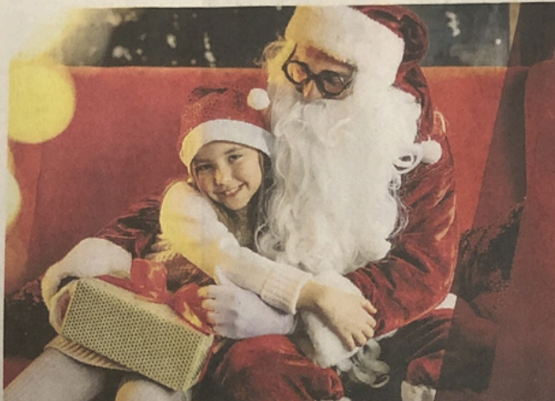
Il Natale è dei bambini. È loro l'incanto e la magia più grande.

CAVOUR Vetta della Rocca, ore 15,30, arrivo di Babbo Natale, ritiro letterine, foto e distribuzione doni, bevande calde, panettone e caldarroste. Servizio navetta gratuito con partenza da