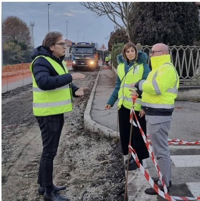
Partita a Nichelino la riasfaltatura di via Pateri: 4 mesi di lavori