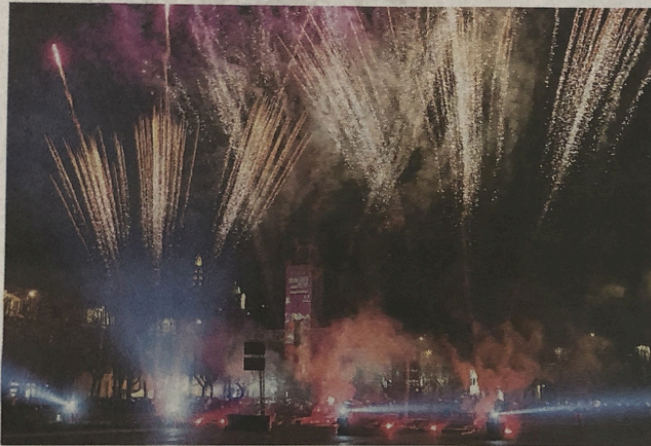
Un altro anno è passato. Buon 2026 a tutti voi.

Serata in piazza Gerbidi aspettando il Capodanno.