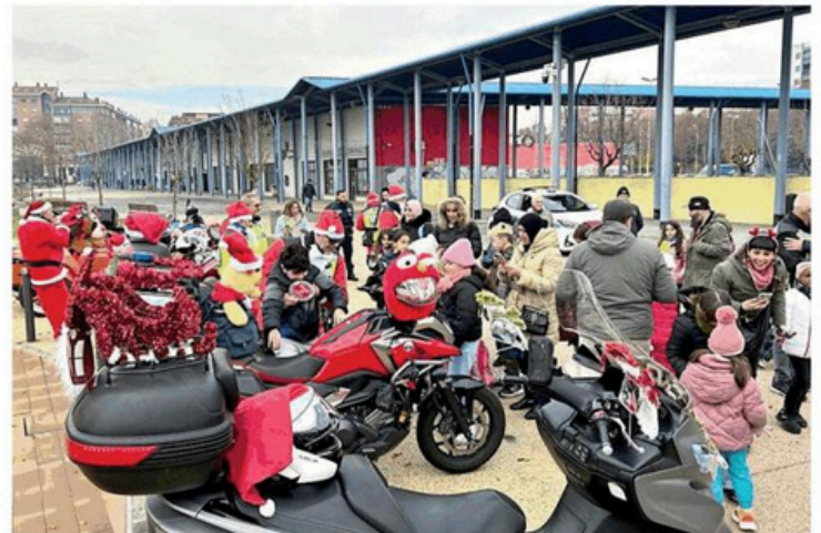
Il ritrovo dei Babbi Natale in moto lo scorso anno a Nichelino

Sempre in tema natalizio, a Coazze lunedì l'ormai tradizionale corsa dei Babbi Natale, manifestazione non competitiva tra le vie del paese aperta a grandi e bambini. L'e-