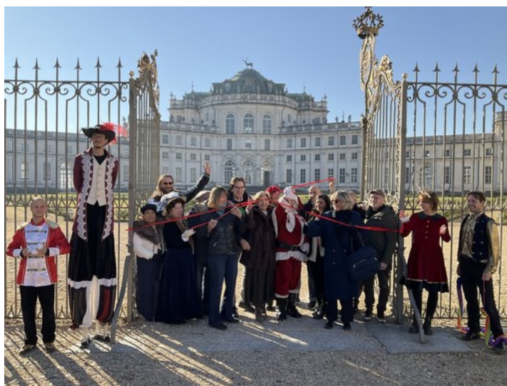
Con Natale è Reale la magia delle feste accende la Palazzina di Stupinigi

Inaugurata la kermesse diventata punto di riferimento non solo per i residenti di Torino Sud: Villaggio degli Elfi, Giocolandia, la mostra dei presepi e quella dei trenini per far felici sia i bambini che i grandi