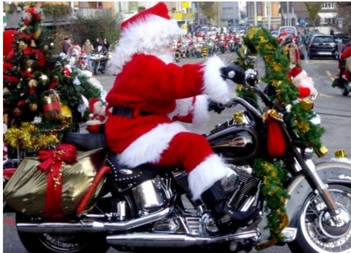
A Nichelino Babbo Natale arriva a bordo di una Harley Davidson

Conto alla rovescia per l'evento organizzato dall'associazione Idea: ecco dove e quando