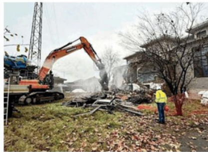
Le operazioni di abbattimento della vecchia scuola NICCHIOSI

NICHELINO, IL PLESSO ERA CHIUSO DAL 2019