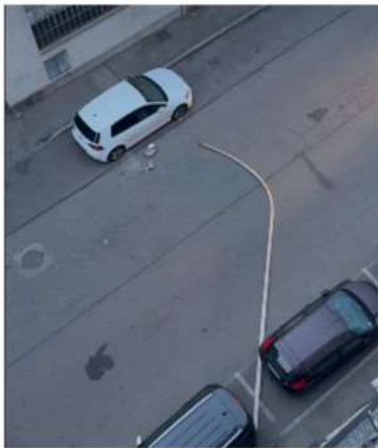
Crolla un palo della luce in via Avogadro: momenti di paura a Nichelino

Finito a pochi centimetri da una vettura parcheggiata. In serata carabinieri, Vigili del fuoco e tecnici comunali hanno riportato la strada in sicurezza.