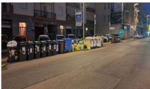
Nuova raccolta differenziata, il Covar 14 promuove Nichelino

I monitoraggi del consorzio segnalano finalmente un quadro positivo, dopo le tante difficoltà iniziali