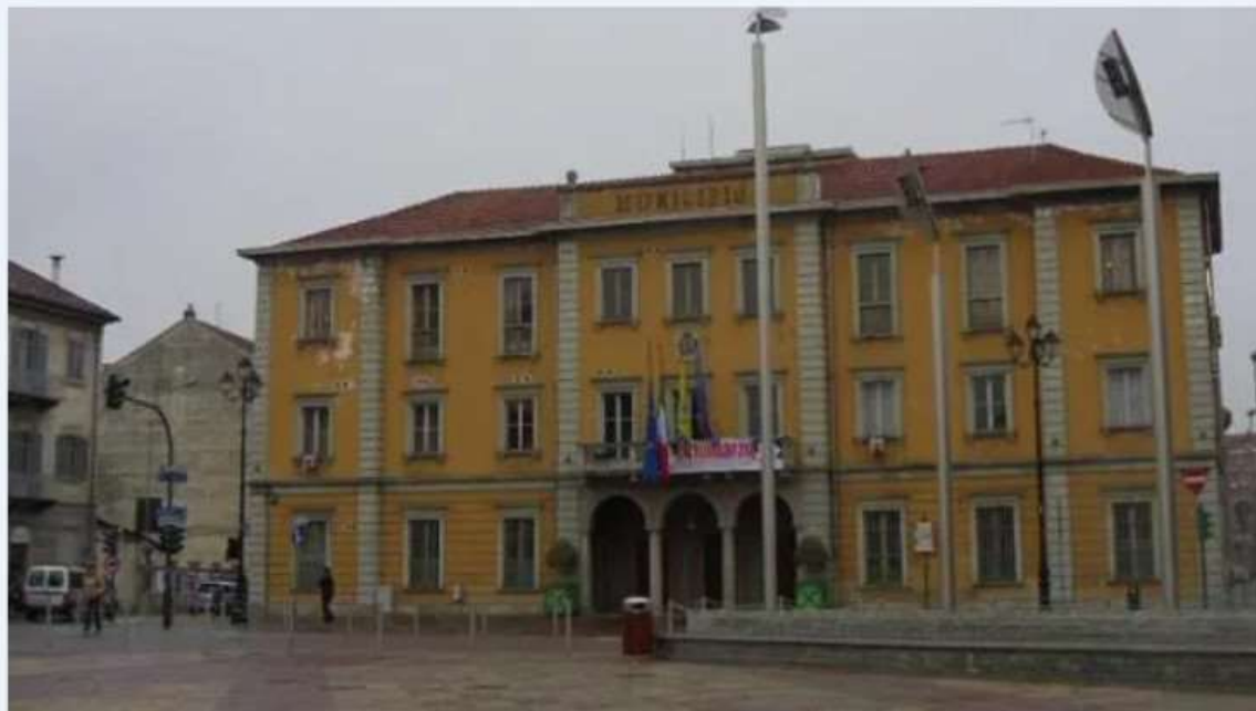
Il Comune di Nichelino