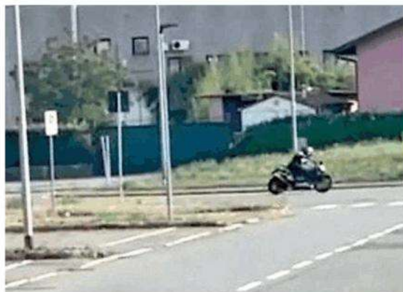
Un biker filmato mentre corre in motocicletta

IL SINDACO TOLARDO: "NON È FACILE CONTROLLARE"