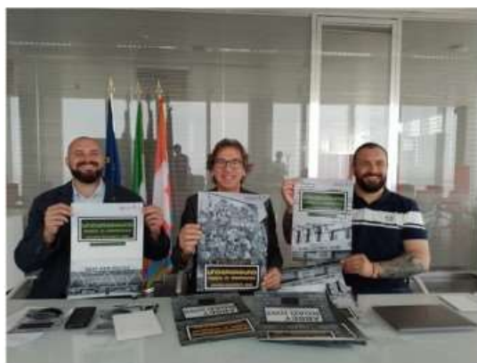
Un momento della presentazione del progetto "Underground"

Previsto anche un tour in Francia, tra Lione e Nizza. I club di lingue dell'Informagiovani di Nichelino come punto di partenza. Previsto un finanziamento complessivo di 40 mila euro per l'iniziativa