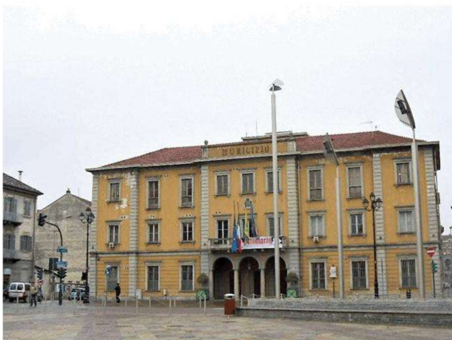
Il Municipio di Nichelino

Alla sbarra un funzionario del Comune e due dipendenti delle ditte