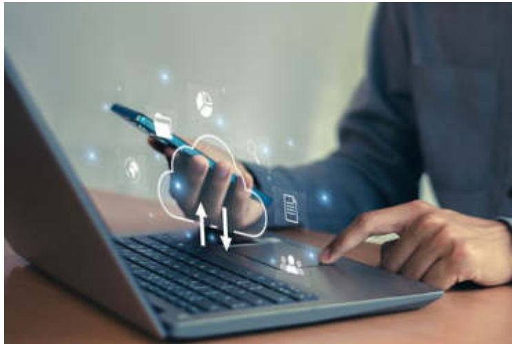
Immagine di archivio

Una transizione per migliorare istanze e procedure destinate a professionisti ed imprese