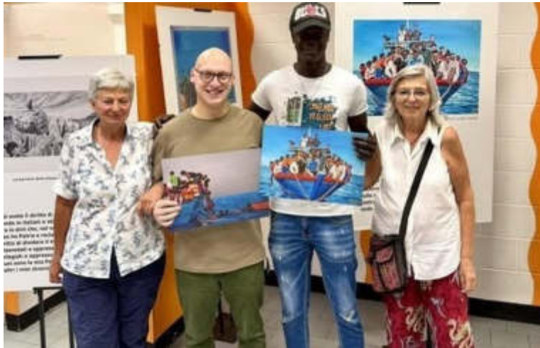
Un momento dell'inaugurazione della mostra a Nichelino

Dal Gambia alla provincia di Torino raccontando l'attraversamento di deserti e mari