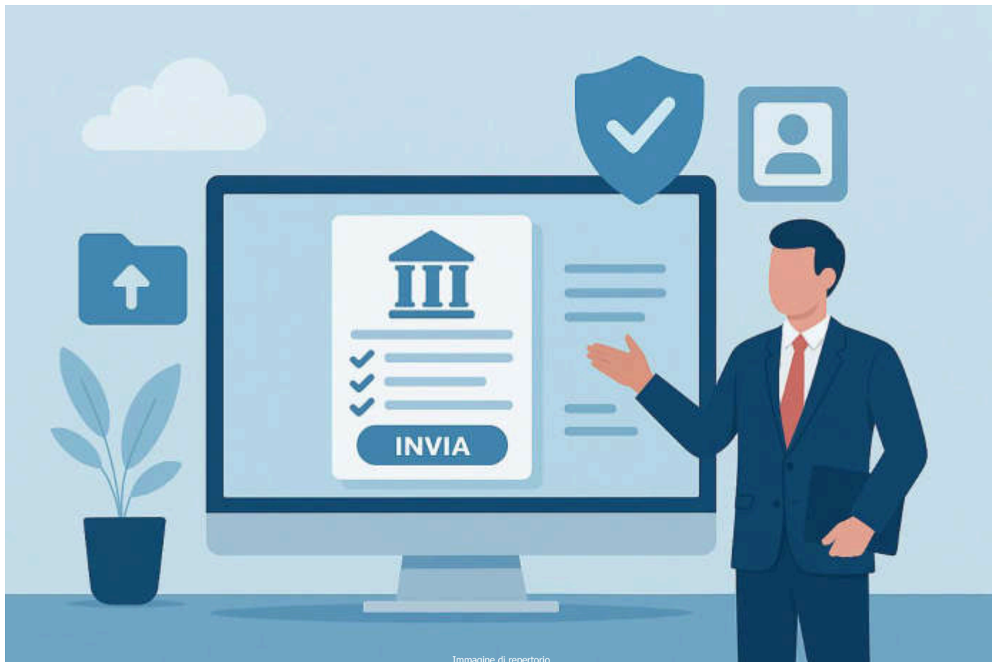
Immagine di repertorio