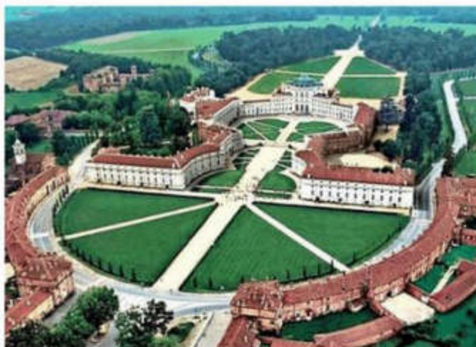
Nel weekend la navetta unirà Nichelino alla Palazzina di Caccia