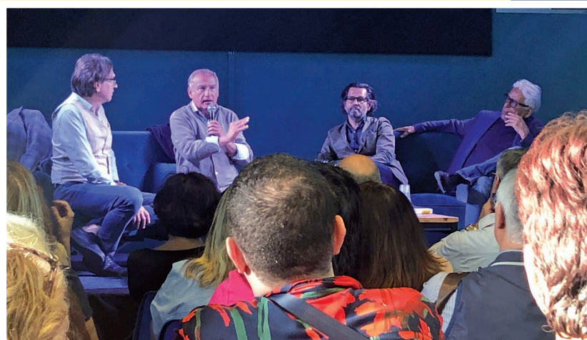
19 maggio - Festa del Libro e della Lettura Piero Marrazzo