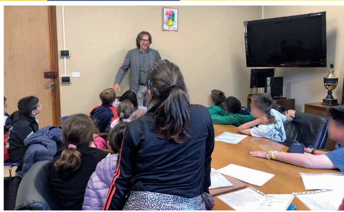
7 maggio - La 4A della Don Milani intervista il Sindaco