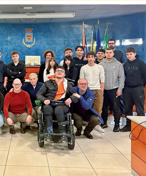
e Ragazzi in aula