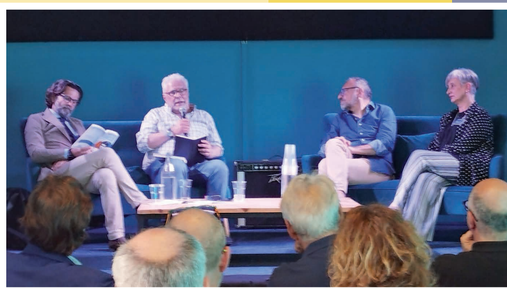
29 maggio - Festa del Libro e della Lettura Giovanni Tosco