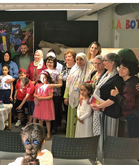
del Libro e della Lettura 2025