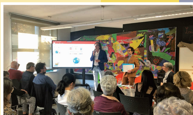
29 aprile - Inaugurazione Festa del Libro e della Lettura 2025