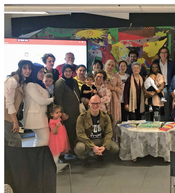
29 aprile - Inaugurazione Festa