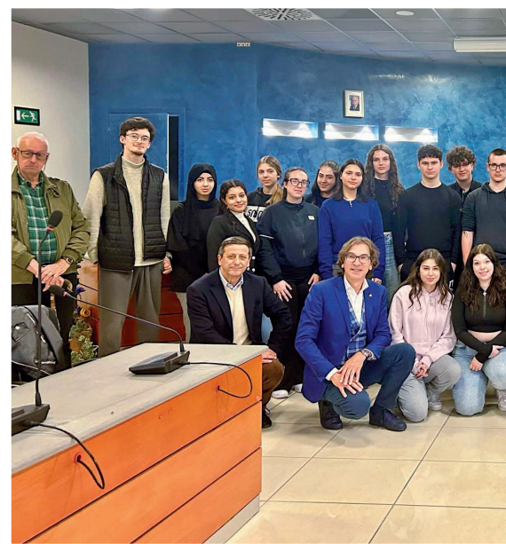
14 aprile - Progetto Ragazze