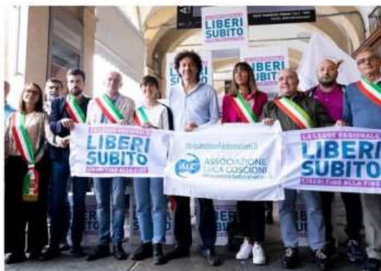
"Il diritto di scegliere": su fine vita appuntamento lunedì a Nichelino

L'evento, organizzato dalla Cellula Coscioni, in programma alle 20.45 del 5 maggio presso la Sala Mattei del Municipio