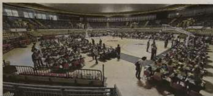
Il torneo di scacchi: la finale si terrà in Abruzzo

della Cesare Pavese si sono aggiudicati un bel posto in finale: la gara, che determinerà il titolo italiano, si terrà in Abruzzo, a Montesilvano, dall'11 al 14 di maggio. Ma questo genere di esperienze prevede costi a volte elevati, soprattutto per alcune famiglie. E la squadra vorrebbe che tutti potessero partecipare. «Questo traguardo rappresenta per noi un'opportunità