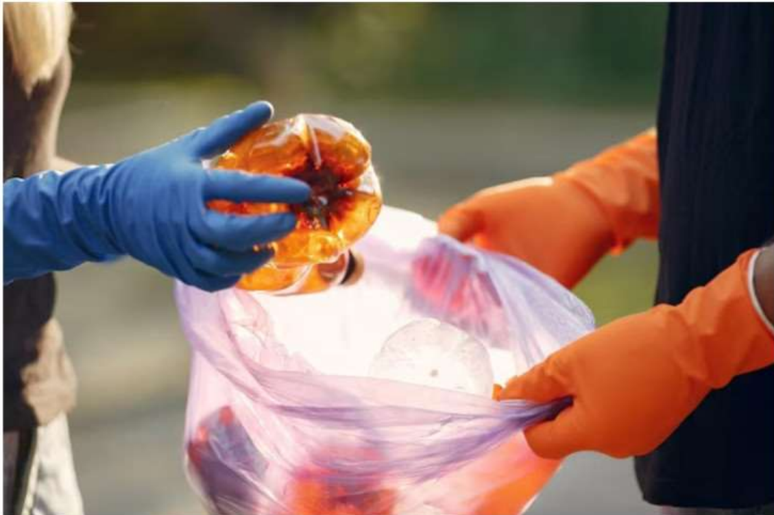
Immagine di repertorio