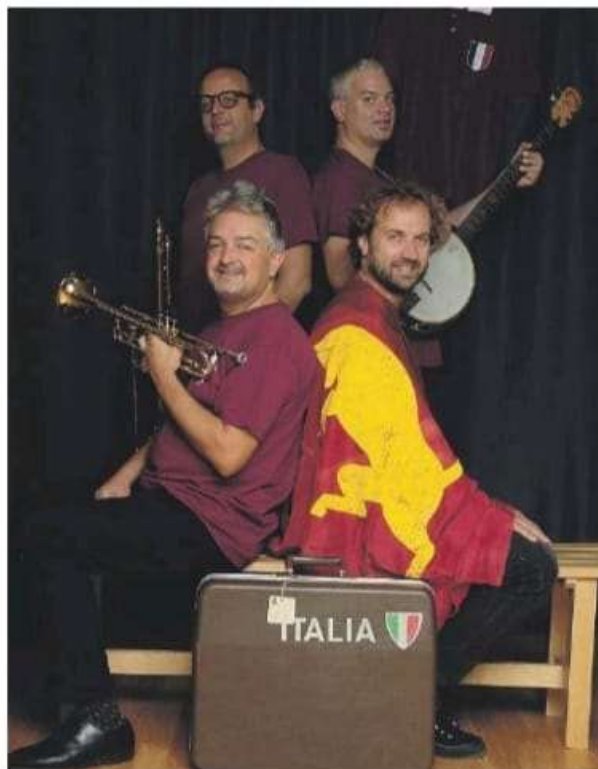
Musica e parole per ricordare il Grande Torino sul palco del Superga a Nichelino.

La favola tragica dei ragazzi in maglia granata parla dei sogni infranti di una generazione