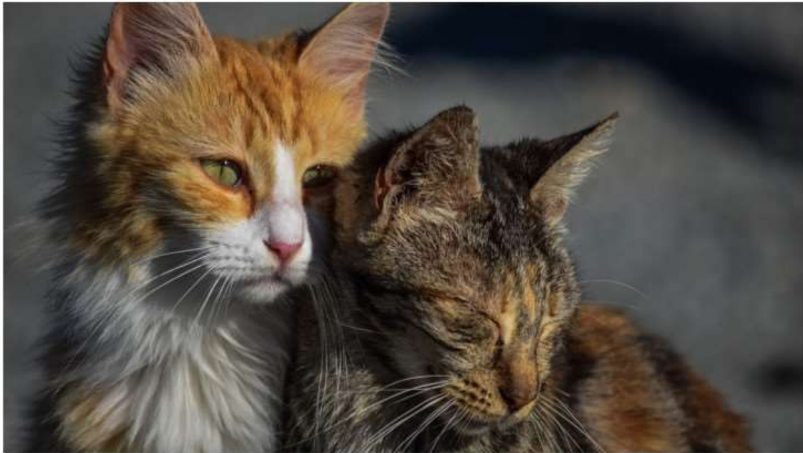
"Hands Off the Cat": la campagna di Nichelino per proteggere i gatti vaganti