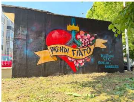
A Nichelino il murale "Prendi Fiato" torna a vivere