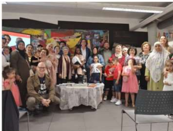
Inaugurata a Nichelino la 12esima edizione della Festa del Libro

Presentato il volumetto 'Ricette dal mondo' scritto dalle allieve straniere del progetto della SPI CGIL "Se non sai non sei": l'italiano e la cucina per favorire l'integrazione