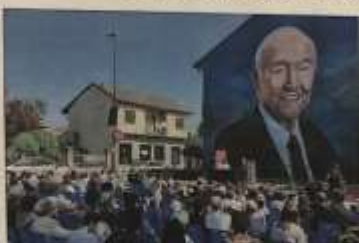
ture di Nona Nina". In collaborazione con il Treno della Memoria.

Venerdì 9 maggio, ore 18.30, all'Inframagnum di via Giulini 1, Enrico De-Andrea presenta "Le avven-