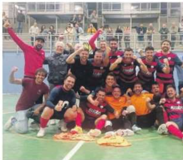
Onnisport batte Cus Piemonte ai play-off e sale in serie C1.