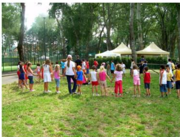
"Si cercano famiglie per ospitare i bimbi di Chernobyl": l'appello della San Matteo Onlus

Dal 2004 ogni estate l'associazione offre un mese di accoglienza ai piccoli bielorusi: l'iniziativa rilanciata col progetto "Amici Senza frontiere"