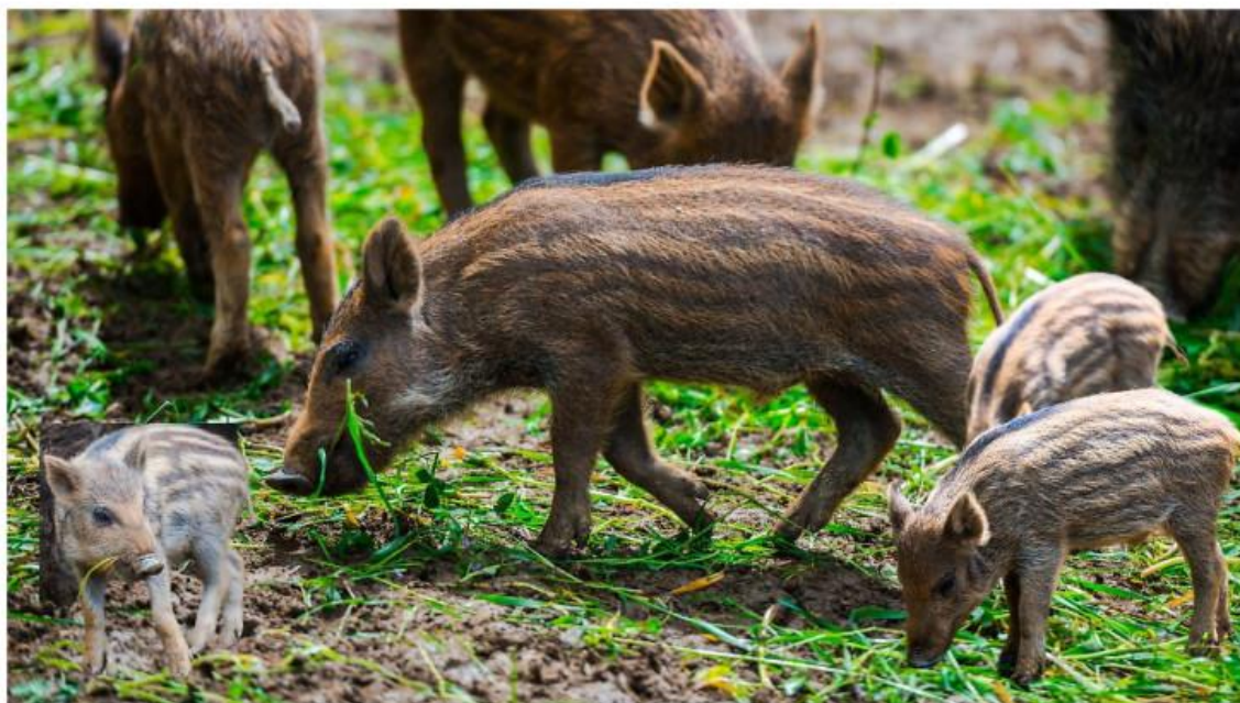
Cinghiali (immagine di repertorio)