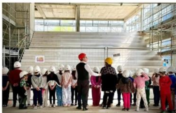
Bambini in visita al cantiere della nuova scuola di Nichelino

Procedono i cantieri dei due nuovi istituti, visitati anche dai bambini del territorio. L'assessore Azzolina: "Costruire il futuro pensando alle nuove generazioni"