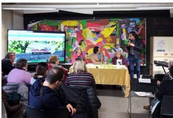
Nichelino e i primi vent'anni di Book in Time