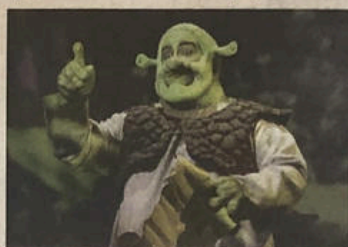
Shrek, il musical in scena al teatro Superga venerdì 29 e sabato 30 marzo

Le imponenti scenografie fisiche e digitali, queste ultime basate sull'engine di videogiochi UNITY, riescono a ricreare perfettamente tutte le varie ambientazioni del