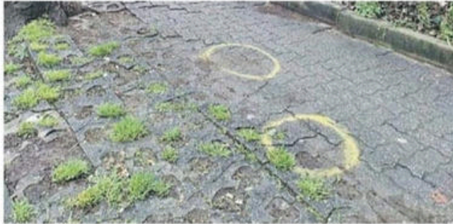
Il luogo dell'incidente, in via Roma.

Il punto dell'incidente, sembra quasi una beffa, è forse quello meno toccato da avvallamenti e il sito era stato già inserito nel quarto lotto di manutenzione stradale, previsto per il 2026. «Ora capremo se, per scongiurare altri rischi, anticipare l'intervento» prosegue Tolardo fotografando anche la realtà di un territorio nel quale le alberate, anche storiche, sono davvero tante. «In realtà ci sono stati o sono in programma numerosi interventi per la messa in sicurezza di cammina-