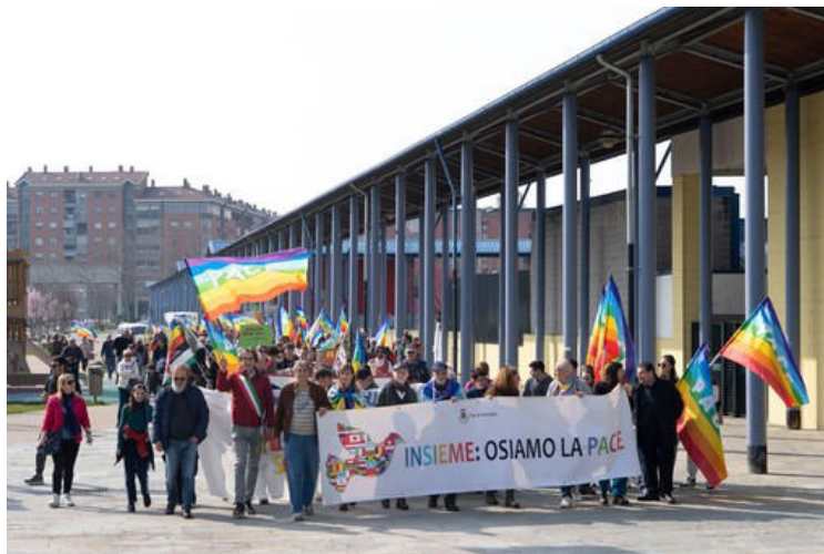
Tutto pronto a Nichelino per la quinta edizione della Marcia della Pace

L'appuntamento quindici giorni dopo la serata-evento con Patrick Zaki al teatro Superga