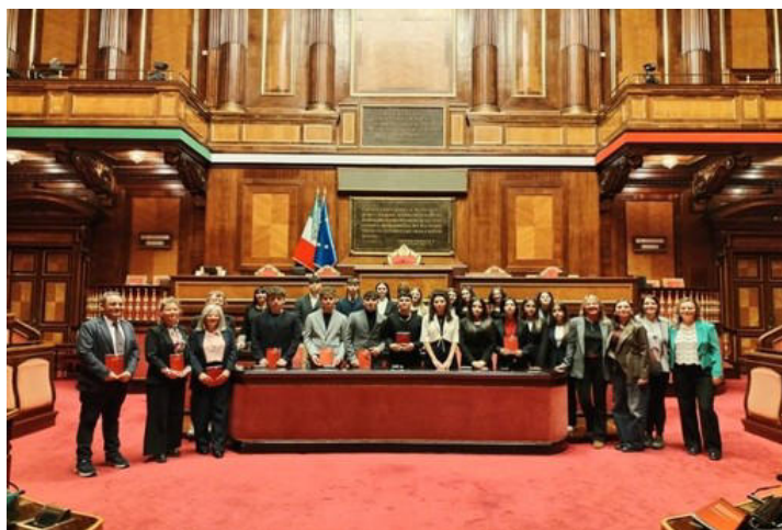
Gli studenti di Nichelino in visita al Senato