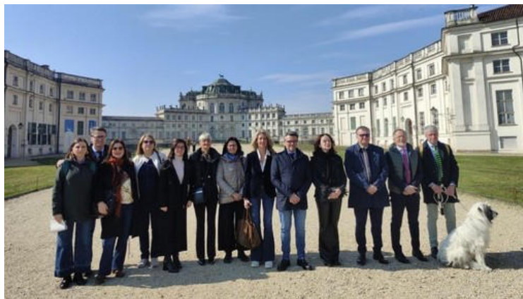
Ipotesi studentato per il rilancio di Stupinigi