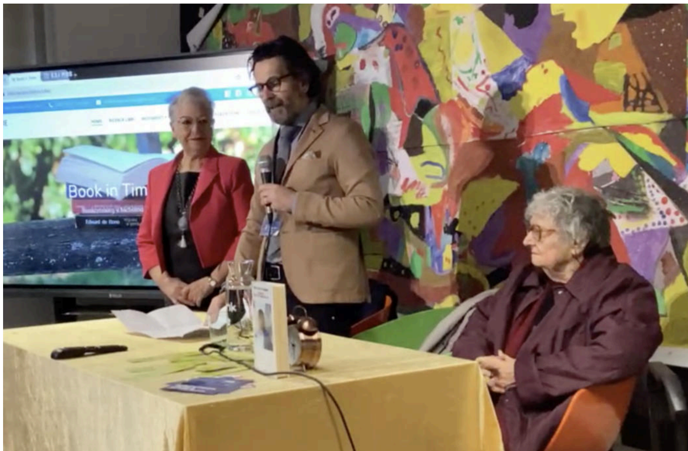
Nichelino celebra vent'anni di "Book in time"