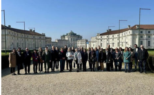
Nichelino riceve un finanziamento europeo di oltre 100 mila euro

Alla Palazzina di Stupinigi è stato presentato CICADA4CE, un progetto internazionale sull'adattamento della città ai mutamenti dell'ambiente