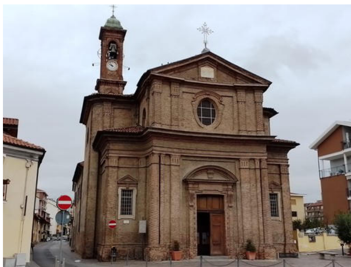
La chiesa della Santissima Trinità di Nichelino