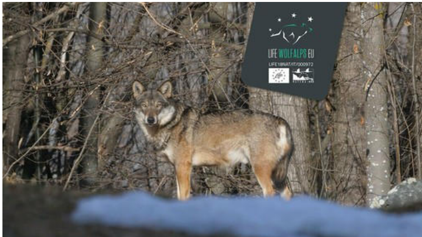
Nichelino, una due giorni alla scoperta del lupo (per aiutare il canile Enpa)

Appuntamento sabato 12 e domenica 13 aprile ad Entracque, in provincia di Cuneo: ultimi giorni per iscriversi, ecco come fare