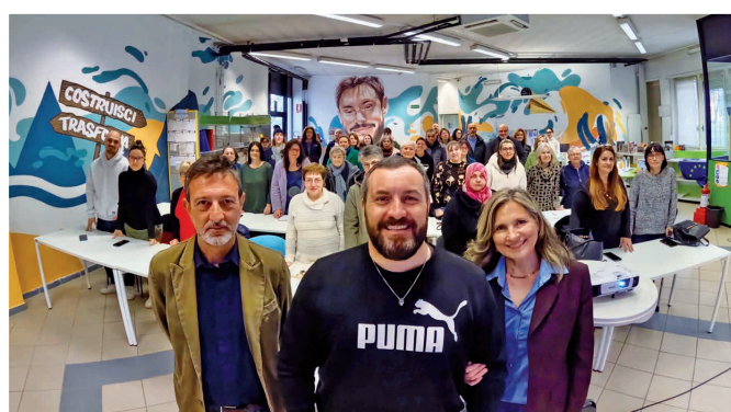
Marzo 2025 - "Urban Cats", formazione per tutor di colonia felina