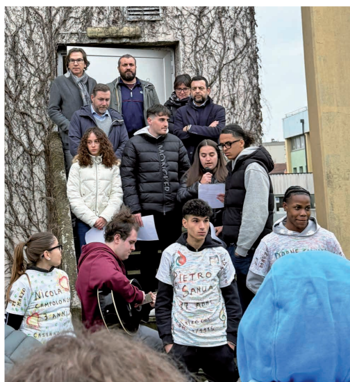
21 marzo - Celebrazioni per la XXX Giornata della Memoria e dell'Impegno in ricordo delle vittime innocenti di Mafia