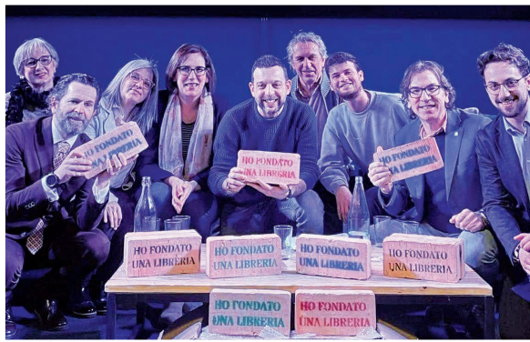
6 marzo - "Ho fondato una libreria" all'Open Factory