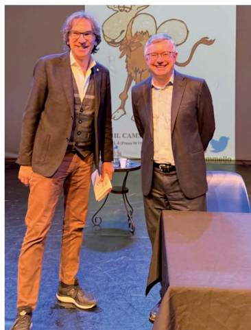
11 marzo - Alessandro Barbero al Teatro Superga per la Scuola di Formazione Politica dell'Associazione amici del Cammello