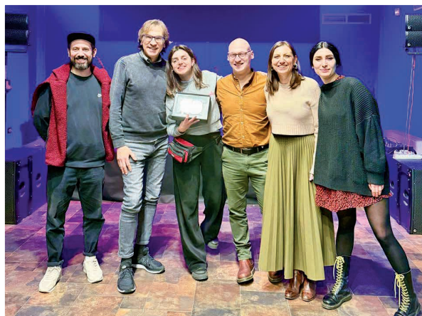
7 marzo - Francamente all'Open Factory