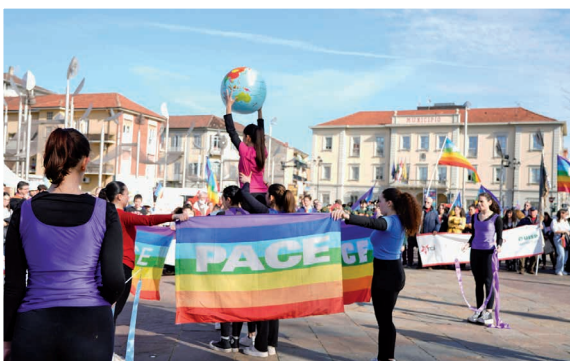
29 marzo Marcia della Pace