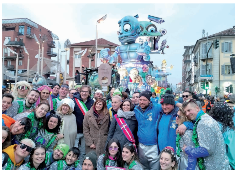
16 febbraio - Carri, coriandoli, chiacchiere 2025