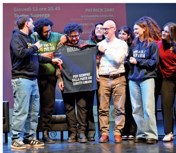
13 marzo - Patrick Zaki al Teatro Superga