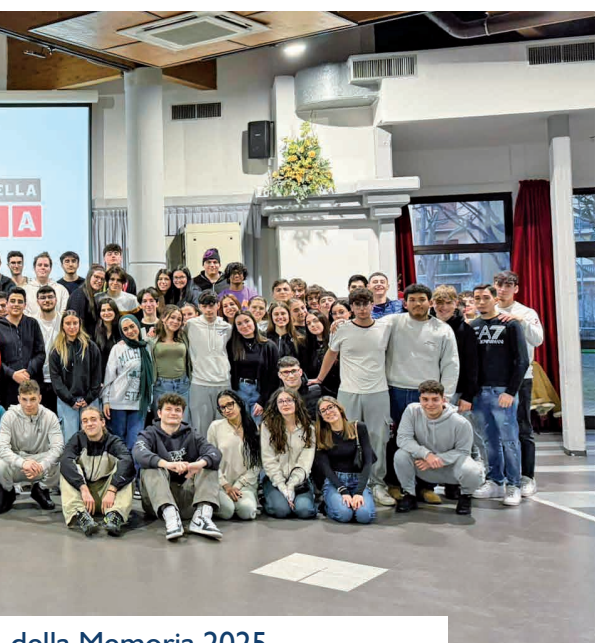
della Memoria 2025