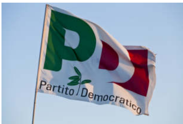
Referendum sul lavoro, il Pd di Nichelino guida alla mobilitazione la zona sud

Numerosi i circoli che hanno aderito all'iniziativa: da Moncalieri a La Loggia, da Vinovo a Trofarello, da Orbassano a Carignano