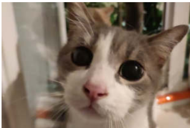
"Urban cats": a Nichelino tre incontri per imparare come si gestisce un gatto

Al via un corso di formazione gratuita per tutor di colonia felina: le date e tutto quello che c'è da sapere