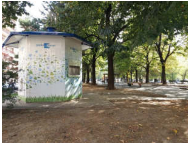
A Nichelino in arrivo tre nuove casette dell'acqua

Verranno installate nei quartieri Kennedy, Boschetto e Sangone