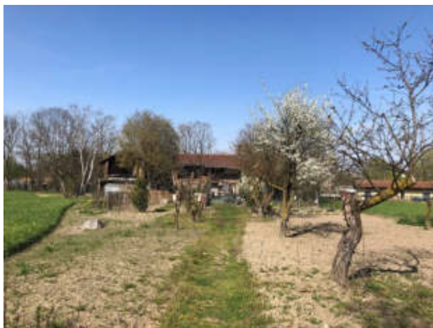
Tutti gli eventi e le iniziative organizzate a Nichelino per l'8 Marzo

Il momento clou sabato pomeriggio al Ranch delle donne