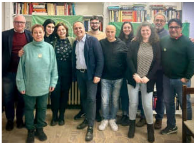
Nasce l'Associazione intercomunale Moncalieri-Nichelino di Europa Verde