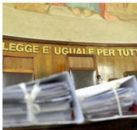
Le minacce sono state giudicate di lieve entità dalla procura

Uno degli elementi chiave del processo è stata una telefonata registrata dall'uomo la notte del 28 agosto 2020. Durante la conversazione, la donna avrebbe pronunciato una frase inequivocabile: «Registrami pure, che te sparo dentro al cervello? Eee?». Poco dopo, una seconda minaccia telefonica ritenuta dall'uomo ancora più esplicita: «Se succede qualcosa a nostra figlia, già ce sta 'na tomba per te. Questo è poco ma sicuro».