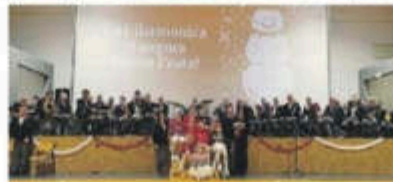
La Filarmonica al Concerto di Natale all'Oratorio.