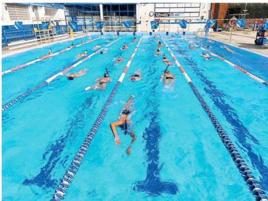
La piscina di Nichelino, al centro delle cronache per il mancato pagamento del personale

“In difficoltà prima per il Covid, poi gli aumenti delle bollette e dei costi del lavoro”