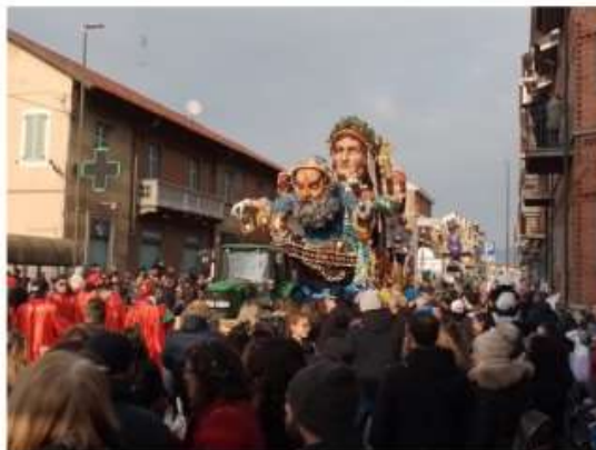
Nichelino invasa da migliaia di persone per la sfilata dei carri del Carnevale

Il successo di sabato con il Carnevale dei bambini replicato la domenica con la sfilata che ha colorato e popolato le vie del centro storico