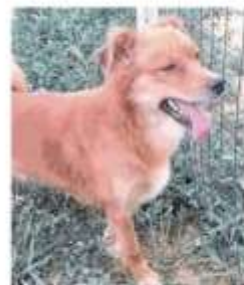
Un cane meticcio

gnolina al guinzaglio e l'ha quindi allontanata dopo il primo morso. La mamma della bambina, molto spaventata, si è presentata ai carabinieri: «Eravamo ai giardinetti vicini alla scuola. Mia figlia ha fatto merenda ed è andata da sola a buttare il cartoccio del succo di frutta nel cestino. È tornata in lacrime dopo pochi minuti con il polpaccio ferito. Ho cercato e trovato subito sia il cane che il padrone. Ho chiamato il 112». Il proprietario e l'animale