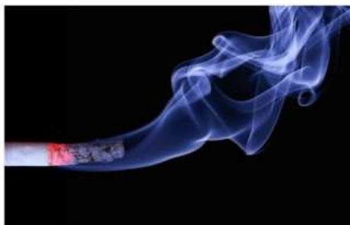
Nichelino dichiara guerra al fumo: approvate le 'smoking area'

La proposta approvata nell'ultimo Consiglio comunale