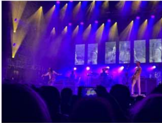
Brian Molko insultò Giorgia Meloni dal palco di Stupinigi

Era il luglio del 2023 quando Brian Molko insultò la premier italiana durante un concerto della sua band. Ora il via libera del Ministero della Giustizia: l'accusa è di vilipendio alle istituzioni