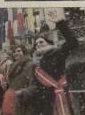
Alcune immagini del Carnevale 2023.

futuro con il carro dedicato all'intelligenza artificiale, realizzato da Patella Vache, che ha chiuso la sfilata con creatività e ironia. Ad aprirla, invece, sono stati Mosso Panatè e Madama Farina