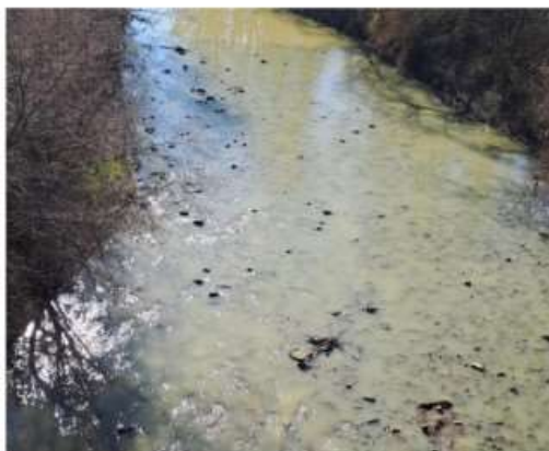
Scarichi nel torrente Sangone, il Comune di Nichelino: "Soluzione in tempi brevi"

Effettuato un sopralluogo insieme ai tecnici di Smat: scoperti tre allacciamenti abusivi, partita l'immediata segnalazione ad Arpa