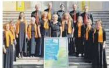
Il coro Eufonie si esibirà venerdì 20.

La bellezza di questo coro? «Lo spirito di aggregazione e