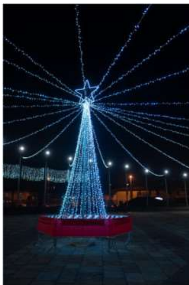
La magia del Natale avvolge Nichelino: il 14 e 15 dicembre appuntamento col presepe vivente

Dall'8 dicembre al 6 gennaio 2025 un ricco calendario di proposte per famiglie e bambini