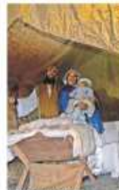
La Natività 2023.