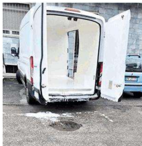
La pulizia dei mezzi avviene in strada NICCHIOSINI

che intralciano anche il passaggio dei mezzi per la raccolta differenziata e l'ingresso nei nostri garage», raccontano i residenti che già in passato erano scesi in strada per protestare. Tuttavia la situazione non trova soluzione: «Tempo fa c'era stato un incontro con la responsabile dell'azienda e l'amministrazione si era interessata alla vicenda. Per un breve periodo la situazione è migliorata, ora siamo punto a capo. Possono lavorare così di notte? Non vogliamo che chiudano, ma che si trovino soluzioni».