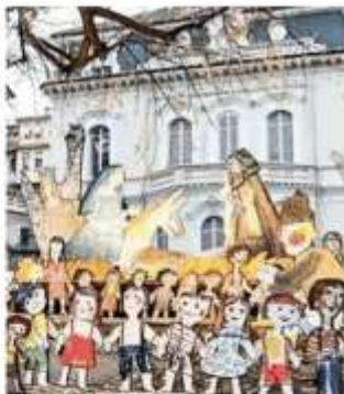
La Natività di Luzzati ai Giardini Cavour di Torino

Si tratta di uno dei presepi meccanici più grandi del Piemonte, considerato tra i più caratteristici d'Italia: oltre 70 metri quadrati con personaggi animati, antichi mestieri, luci, torrenti e laghetti. La sua peculiarità è quella di