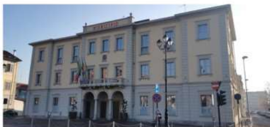
Con 'Nichelino Universitaria' il Comune offre un aiuto agli studenti del territorio

C'è tempo fino al 23 dicembre: tutte le info utili