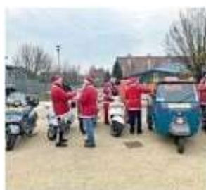
In Vespa e in motociclette

L'iniziativa, organizzata dall'Associazione Idea, è stata pensata per regalare un momento di gioia ai piccoli che frequentano il laboratorio di «Aiuto Compiti», pro-