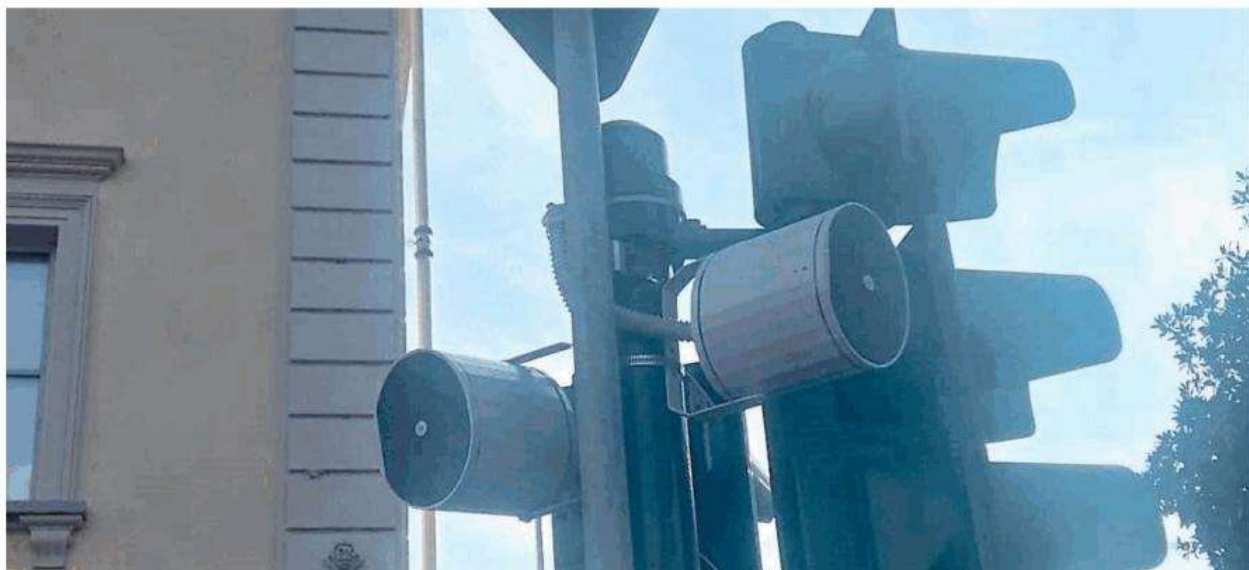
Gli altoparlanti della filodiffusione installati lungo via Torino a Nichelino: Dal Comune: «Solo problemi tecnici da risolvere»