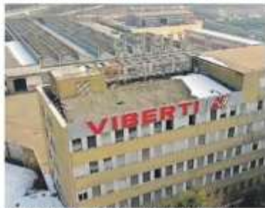
La Palazzina Viberti poco prima dell'abbattimento.

Marciapiedi e asfalto coi fondi del Patto Metropolitano