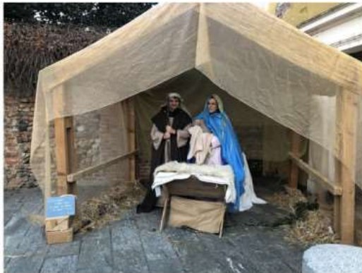
A Nichelino tutto pronto per la seconda edizione del Presepe Vivente

Sabato nel Borgo Antico anche centurioni a cavallo, street food dell'epoca, laboratori per i più piccoli: sarà il clou del ricco programma "La Magia del Natale"