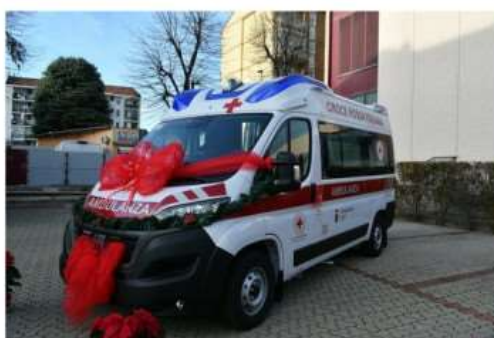
Inaugurati a Nichelino due nuovi mezzi della Croce Rossa

Un'ambulanza e un carrello idrovora per aiutare il lavoro di chi si occupa di salute e sicurezza