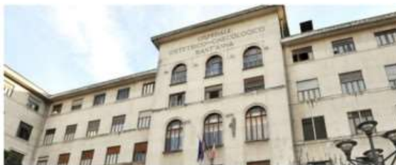
"L'altro Giacomo": al Superga di Nichelino uno spettacolo per sostenere il Sant'Anna

L'evento dedicato a Puccini in programma sabato 14 dicembre dalle ore 21