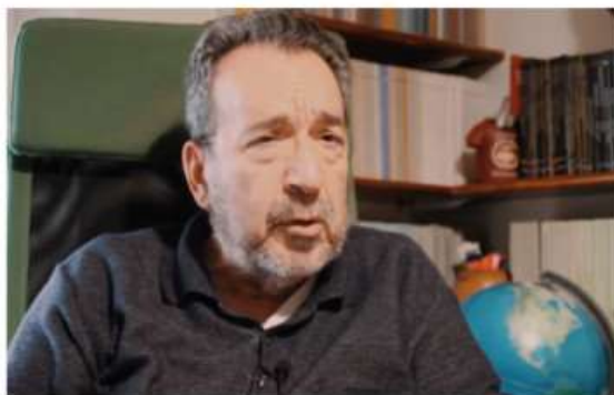
"Scrivo per la mia Città": a Nichelino premio letterario alla memoria dell'ex sindaco Riggio

L'iniziativa, lanciata dall'Associazione Amici del Cammello, rivolta agli studenti: chi può partecipare e come