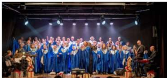
Al Superga il concerto di Natale dei Free Voices Gospel Choir

Il concerto di Natale dei Free Voices Gospel Choir servirà a raccogliere fondi per i bambini ucraini e bielorusi ospitati dall'associazione San Matteo Onlus