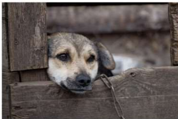
Daspo cinofilo, il Consiglio comunale di Nichelino dice sì all'unanimità