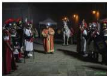
Due momenti del Presepe vivente nel Borgo Vecchio.

Biglietti: platea 22 euro, gal-leria 17 euro.