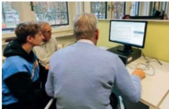
'Old Wild Web', gli studenti diventano tutor al centro anziani di Nichelino

Gli allievi della 3A Informatica del Maxwell protagonisti di un corso di alfabetizzazione digitale intergenerazionale