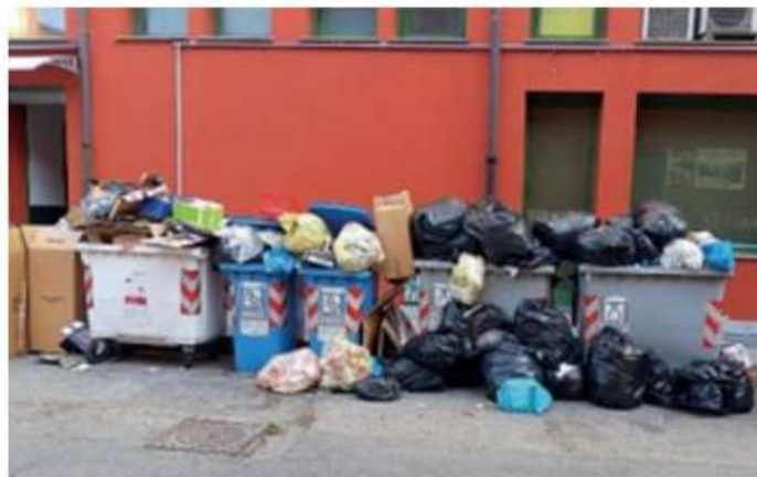
Nichelino, rifiuti sparsi ovunque lungo via Rossini: "Servono le telecamere"

La rabbia dei residenti: "C'è gente che arriva con il carrello della spesa per buttare via quello che non serve più"