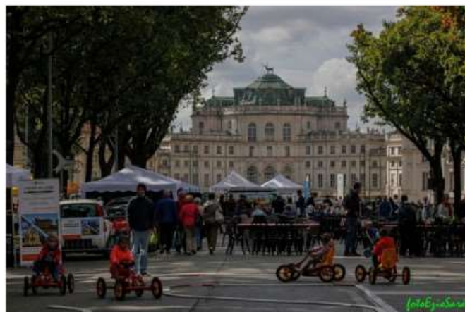
Tutto pronto per la XI Fiera di Stupinigi

Domenica 6 Viale Torino sarà popolato di bancarelle, stand e animazioni per l'ultimo evento legato alla festa di San Matteo