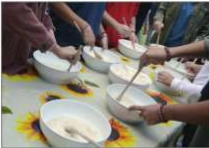
Laboratori del gusto, cibo a Km 0, esperienze a giri in carrozza: attendono i visitatori della Fiera di Stupinigi domenica 6 ottobre