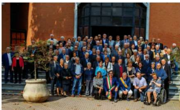
Nichelino si prepara a celebrare le coppie che festeggiano le nozze d'oro

Aperte le iscrizioni: c'è tempo fino al 7 ottobre. La cerimonia in programma sabato 26