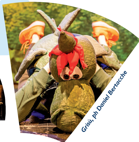
Grisù