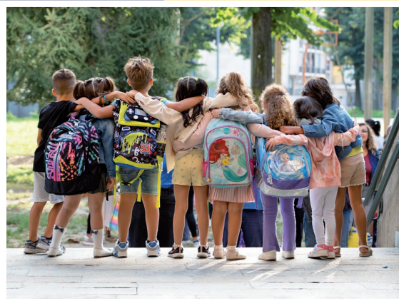
11 settembre - Primo giorno di scuola