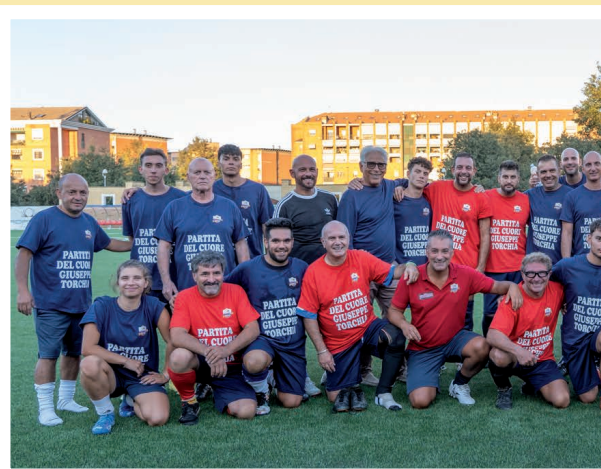
15 settembre - Partita del C