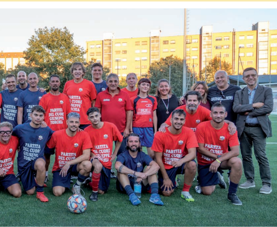
el Cuore dedicata a Giuseppe Torchia