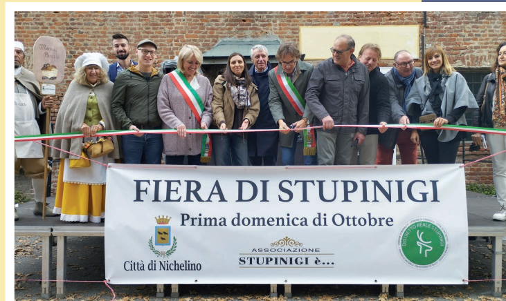
6 ottobre - 11 a Fiera di Stupinigi