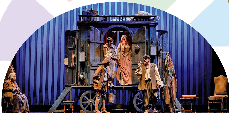
L'Avaro Immaginario