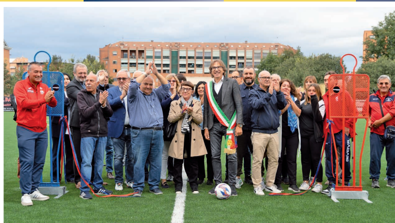
17 settembre - Inaugurazione del nuovo campo sintetico all'ASD Onnisport