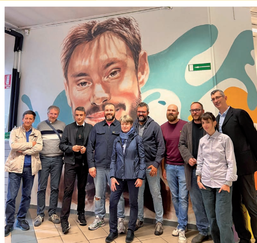
2 ottobre - Visita del presidente nazionale Engim all'Informagiovani