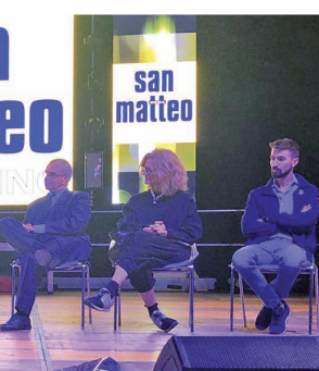
20 settembre Presentazione della pasta "Nichelino e Stupinigi nel piatto"