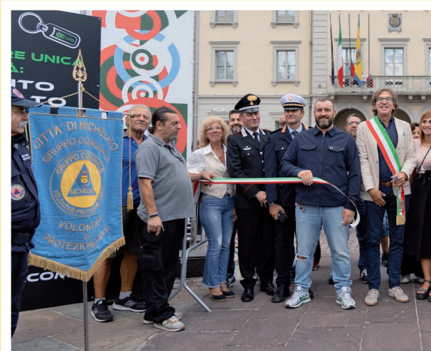
12 settembre - Inaugurazione de