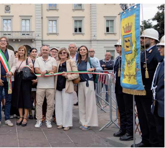
ne della Festa di San Matteo