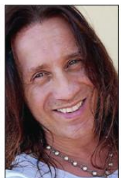
Il cantante Povia