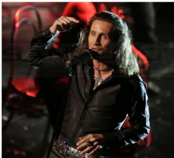
Nichelino, nessuno prenderà il posto di Povia nel Talent di San Matteo

La festa patronale al via tra una settimana, dopo le polemiche che l'hanno preceduta per la presenza (poi annullata dal sindaco) dell'artista, escluso per le sue posizioni omofobe e no vax