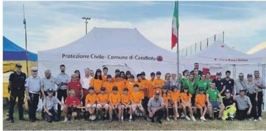
Il gruppo di "Anch'io sono la Protezione Civile".

CANDIOLO Sveglia alle sette, fine attività verso le diciotto e trenta, ritiro in branda alle ventitré: non è il servizio militare, ma la nuova edizione del progetto "Anch'io sono la Protezione Civile", nato grazie alla volontà del Dipartimento Nazionale di Protezione Civile e finanziato dalla Regione Piemonte. A Candiolo sono una ventina i ragazzi e le ragazze che vi hanno partecipato, tutti di età compresa tra i dieci ed i sedici anni.