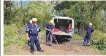
Una squadra della Protezione Civile in azione.

NICHELINO Ci sono voluti due giorni di chiusura, il 27 e 28 agosto, per ripulire e mettere in sicurezza l'area verde del Boschetto, letteralmente devastata dalle raffiche di vento del "downburst" abbattutosi su Nichelino alla vigilia di Ferragosto. Un lavoro non semplice, preceduto da un accurato censimento delle piante pericolanti prossime al crollo. Fondamentale l'intervento della Protezione Civile, che da subito ha trasformato le zone "ad alto rischio" e provveduto, successivamente, a «coricare, sezionare e asportare rami e tronchi, chiaramente nel limite di quella che è la capacità dei mezzi a nostra disposizione». Inubifragi hanno, infatti, sempre più spesso potenza decisamente superiore a quelle storicamente consue-