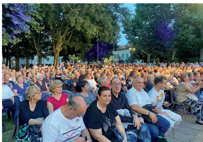
27 giugno - 1° agosto - E...state in Città 2024