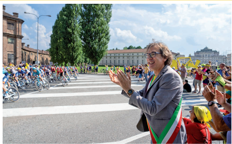
1° luglio - Passaggio del Tour de France da Stupinigi