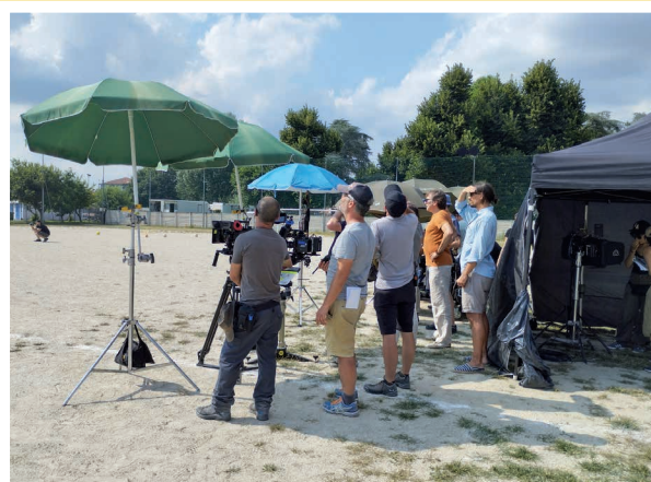
25 luglio - Riprese del film “Di niente e di nessuno” della regista Cristina Ducci