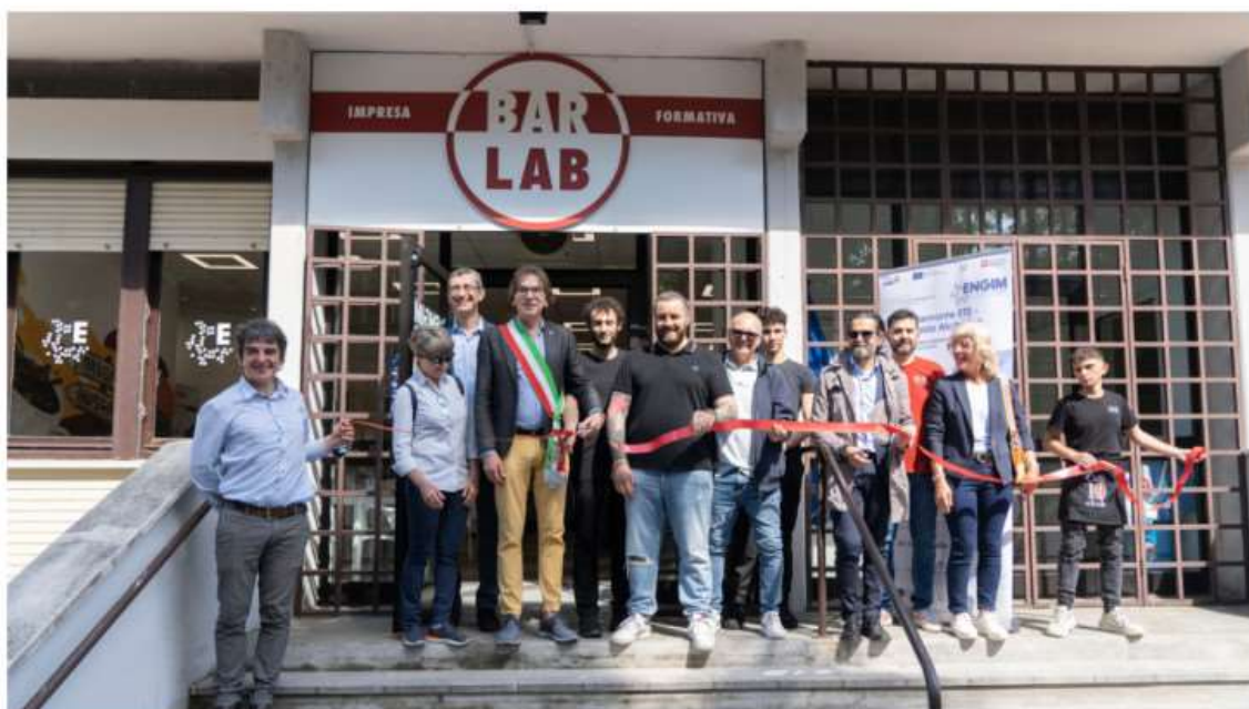
Inaugurazione Bar Lab

A Nichelino è nato Bar Lab : inaugurato ieri, 26 giugno, è molto più di un "semplice bar".