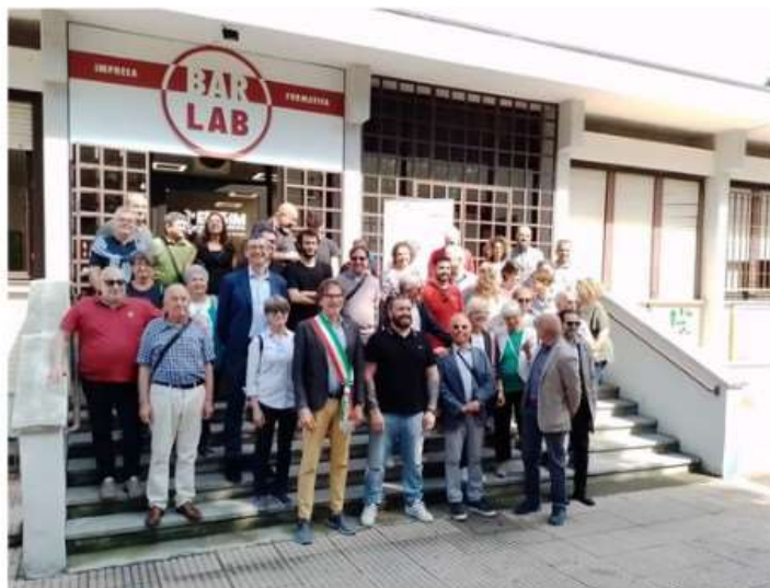
Inaugurato a Nichelino il Bar Lab, a due passi dal Centro Grosa e dall'Informagiovani