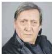
L'attore Tony Sperandeo.