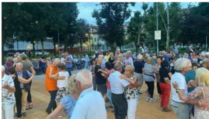
Da stasera riparte a Nichelino l'estate del Punto Verde del centro Grosa