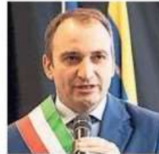
STEFANO RUSSO SINDACO DI TORINO

L'arrivo della corsa comporterà delle limitazioni al traffico che stiamo cercando di comunicare a tutti