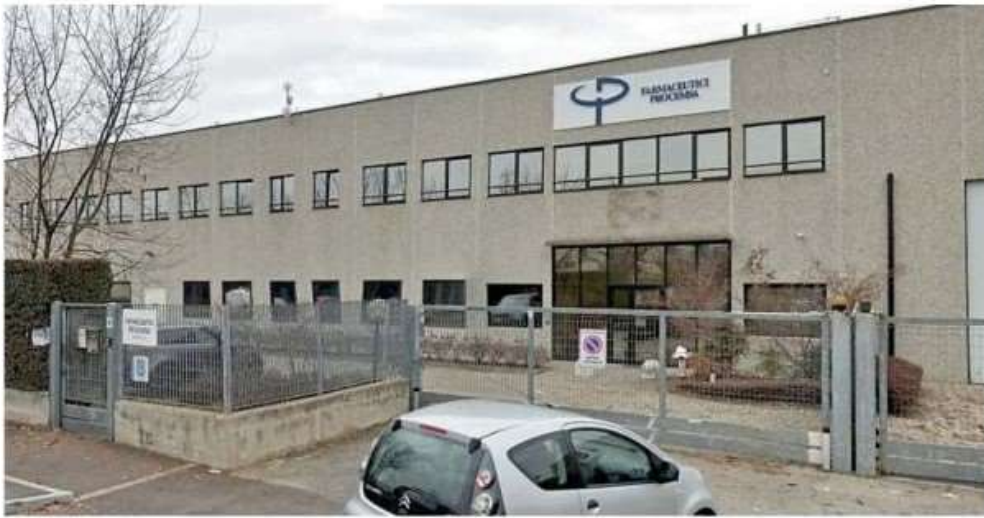
Nello stabilimento di Nichelino vengono realizzati prodotti chimici farmaceutici, cosmetici, medical device, para farmaceutici