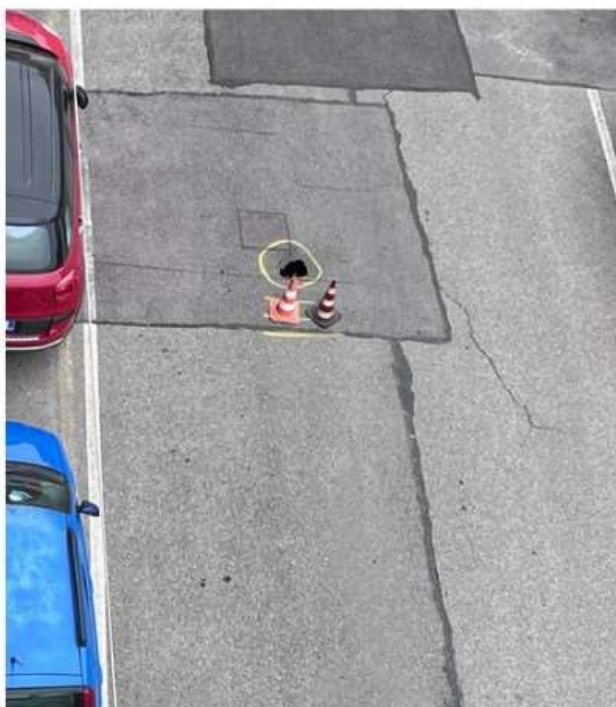
Nichelino fa i conti con l'ennesima voragine: residenti furibondi in via Lagrange

I tanti giorni di pioggia delle ultime settimane hanno creato situazioni di pericolo in diverse strade della città e della cintura sud