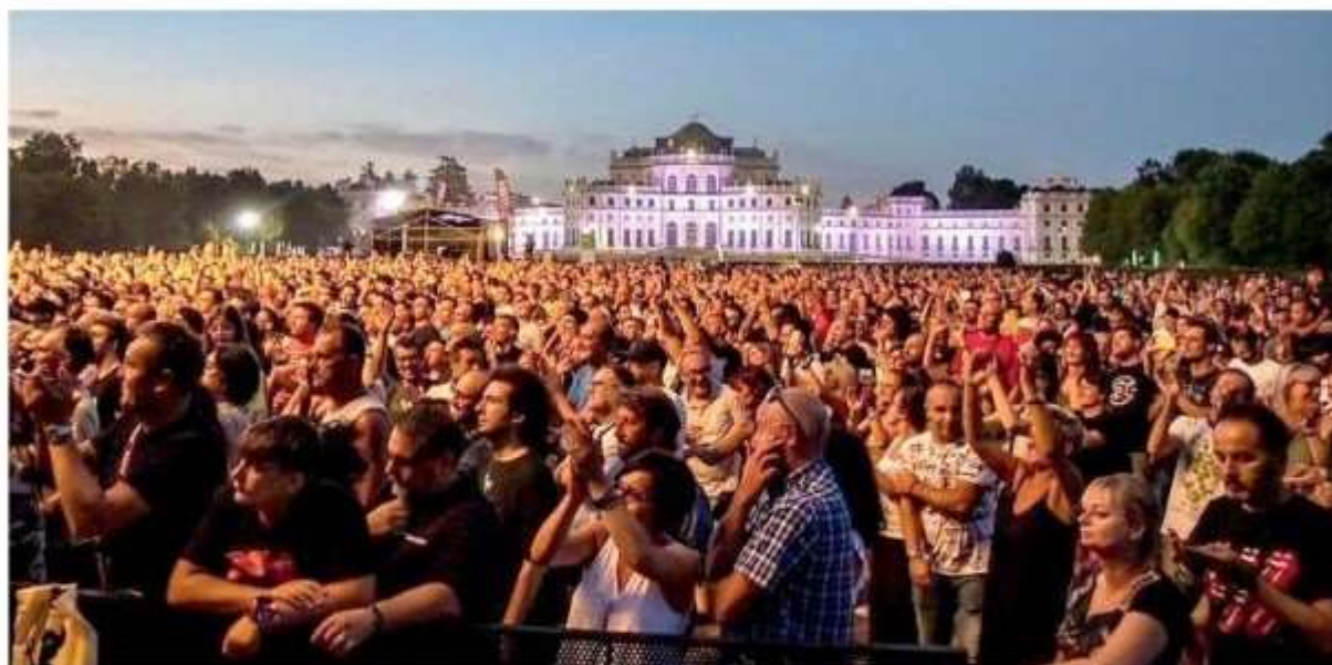
Una serata del festival nella suggestiva area della Palazzina di Caccia di Stupinigi

Al via la sesta edizione del festival nell'area della Palazzina di Caccia: il 30 giugno gli Underdog I fratelli Boasi: "Gigi D'Agostino già sold out, l'area è capace di ospitare 9.500 spettatori in piedi"