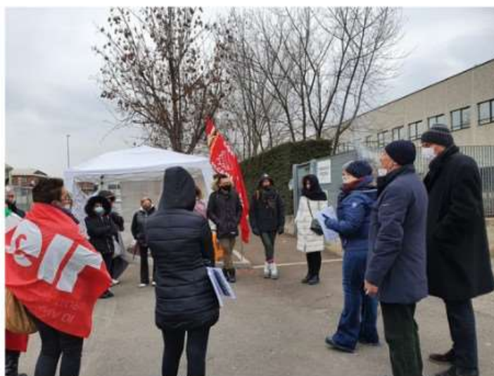
Già in passato c'erano state manifestazioni sindacali legate alla Procemsa di Nichelino