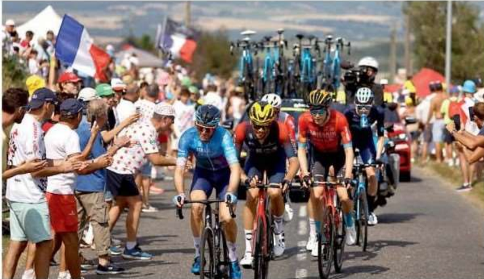
La grande carovana del Tour de France porterà diversi problemi di viabilità nella zona sud di Torino

Si tratta di un provvedimento disposto dalla Città di Torino, con la Polizia Municipale, reso noto ieri dal Comune. Una misura che, lunedì di prossimo, prevede modifiche non solo alla viabilità. Il mercato di corso Sebastopoli aprirà al mattino ma dovrà chiudere alle 12,30, con due ore di anticipo. L'ospedale Koelliker, che sorge in corso Galileo Ferraris 247, opererà per tutto il giorno a mezzo servizio: non effettuerà visite prenotate ma garantirà l'attività medica sui degenti, così come il servizio di emergenza. Un'ulteriore restrizione, il 1 luglio, interesserà gli spazi di sosta: dalle 8 sarà vietato parcheggiare lungo l'intero corso Unione Sovietica, asse lungo cinque chilometri. «Abbiamo lavorato due anni per portare il Tour a Torino che accoglierà la carovana gialla insieme a numerosissimi appas-