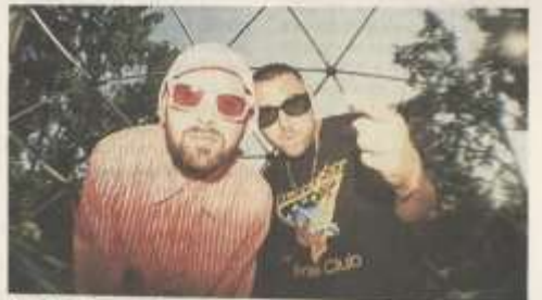
In alto: i Dogstar feat Keanu Reeves, sul palco di OGR Sonic City domenica 30. Sotto: Coez e Frah Quintale a Stupinigi il 13 luglio.