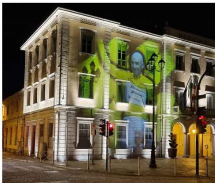
Nichelino 'in giallo' onora il ricordo di Pantani aspettando il passaggio del Tour

In questi giorni l'immagine del Pirata è proiettata di sera sulla facciata del Palazzo Comunale. Tutte le altre iniziative in programma