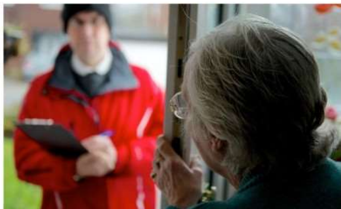
Finto addetto dell'acqua raggira una 80enne a Nichelino

Prelevati 300 euro dal conto. Ancora un caso di truffa ai danni di anziani nella cintura sud di Torino