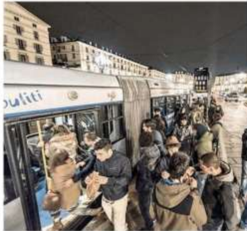
I giovani sui bus notturni

totto Comuni dell'area metropolitana. È l'orario estivo messo a punto da Gtt, che resterà in vigore fino al 7 settembre prossimo. In questi due mesi e mezzo, in particolare, non cambierà il numero di linee di bus notturni - resteranno diciassette, come in inverno - ma si allungherà il loro tragitto. Per tutte, il punto di partenza e di arrivo resterà fissato in piaz-