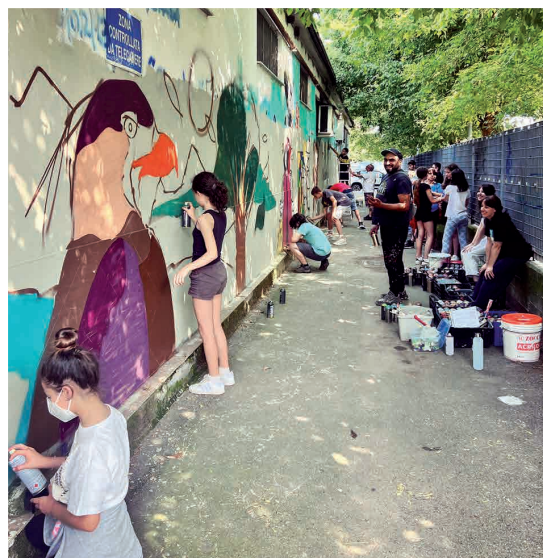
17 giugno - Primo appuntamento con Graffiti Lab - A scuola di Street Art