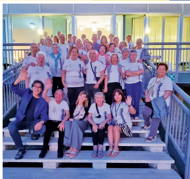
26 maggio - 9 giugno Soggiorni Marini 2024 - I° turno