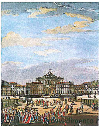
L. Sclopis del Borgo (particolare) "Veduta di Stupinigi dal lato del Giardino", 1783.

Piazza G. Di Vittorio, 1 - 10042 Nichelino (To)