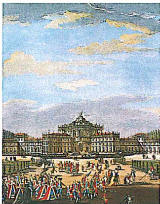
I. Sclopis del Borgo (particolare) "Veduta di Stupinigi dal lato del Giardino", 1783.

richiamato il D.Lgs. 165/2001 ed in particolare l'art. 19;