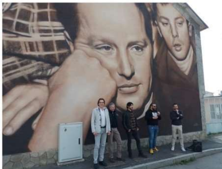
Il murale di Don Milani a Nichelino giudicato il terzo più bello al mondo

La 'promozione' arriva da streetartcities.com, il maggiore portale internazionale di arte urbana. Verzola: "Una città che è quasi un museo cielo aperto"