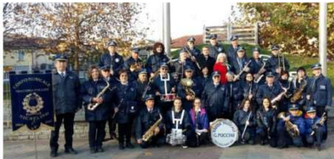
Nichelino, fino al 9 giugno la seconda edizione di "Music School Festival"

Tanti gli appuntamenti in programma fino al gran finale che vedrà protagonista la banda Puccini