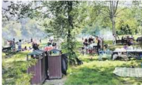
Domenica di grigliate al Parco del Boschetto.

«Quest'anno le risorse destinate al verde pubblico sono aumentate e abbiamo in programma anche nuovi interventi di piantumazione», prosegue il sindaco. Gli alberi sono al momento in un nostro vivaio in attesa di raggiungere una fase di crescita che li salvaguardi dalla furia degli eventi climatici. La preoccupazione risponde in parte anche all'interrogazione presentata dal Movimento 5 Stelle durante l'ultimo Consiglio comunale, nel quale si chiedevano aggiornamenti sul ripristino delle numerose piante pericolanti e in viale abbattute negli scorsi mesi. Il ritorno del bel tempo coinciderà con l'avvio del terzo taglio e permetterà di fare le opportune verifiche sul