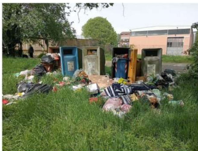
Nichelino, al parco del Boschetto arrivano i dissuasori contro i "furbetti del pic nic"

Troppe le auto che, soprattutto la domenica e nei festivi, con l'arrivo della bella stagione, arrivano là dove è vietato. Presto saranno installati i new jersey