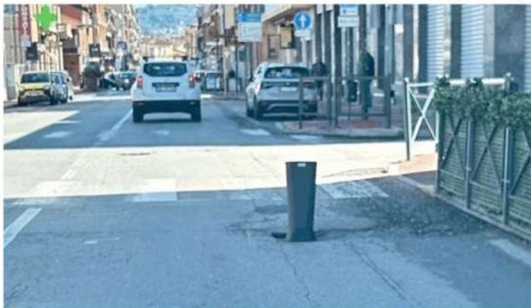
Il portaombrelli infilato nella buca in via Torino, a Nichelino, per segnalare il pericolo agli automobilisti in transito

Il problema non è naturalmente solo di Nichelino, ma si ritrova in tantissimi altri Comuni della provincia. La vicina Moncalieri non se la passa meglio, tanto per rimanere sempre nella stessa fetta di cintura. Esempio simbolo è via Juglaris, strada di confine con Nichelino, diventata un colabrodo. Nel corso degli anni le richieste di pagamento arrivate