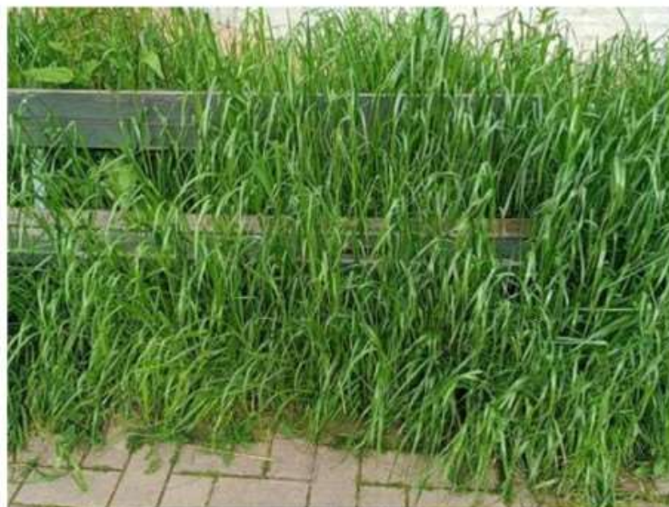
Nichelino tra erba alta che 'si mangia' le panchine e vandali in azione al Boschetto

Numerose le segnalazioni di 'giungla' in via San Vincenzo e in zona via Torricelli. Sradicato il rubinetto di una fontana nel 'polmone verde' della città