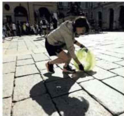
Una volontaria raccoglie mozziconi sotto il Comune.

lo di raccogliere i rifiuti. «Spiego che prima o dopo tutto quello che buttiamo finisce in mare. Quei rifiuti condizionano anche la catena alimentare, si stima che ingeriamo ogni settimana cinque grammi di plastica». Negli ultimi tempi ha notato sempre maggiore consapevolezza tra le nuove generazioni: «Sono preparatissimi e molto sensibili ai temi ambientali. In un mondo che costeggia il baratro, loro mi danno una grandissima speranza».