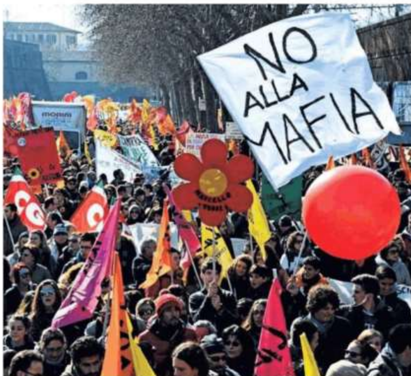
Una manifestazione a Padova nel 2019 contro le mafie