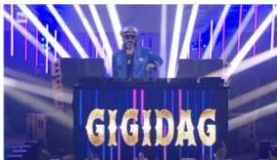
Gigi D'Agostino torna a suonare anche a Torino: appuntamento al Sonic Park

Il 14 luglio il deejay farà ballare alla Palazzina di Caccia