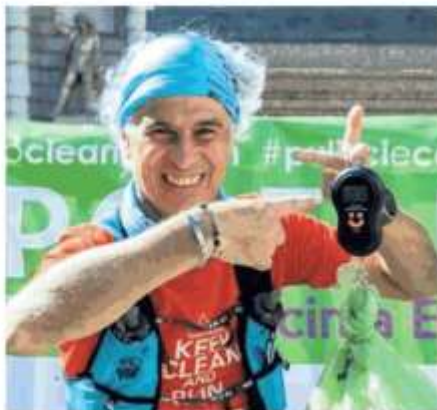
La pesa dei rifiuti: ieri ne sono stati raccolti 80 chili