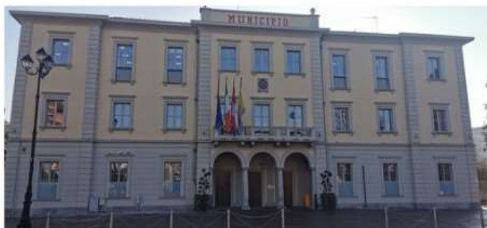
Nichelino vuole riordinare l'archivio comunale, lanciato cantiere di lavoro per due disoccupati

Scadenza domande le ore 12 del 29 aprile: chi può partecipare e come