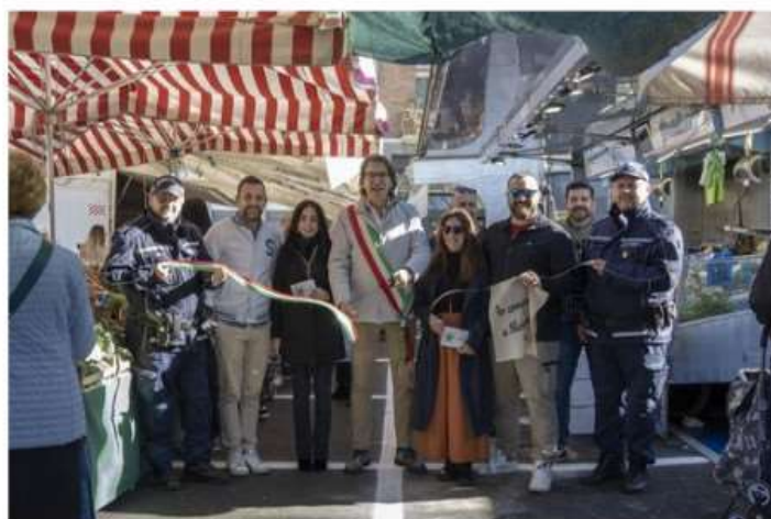
A Nichelino prosegue la rivoluzione dei mercati e riapre piazza San Quirico

L'intervento di 300 mila euro (a costo zero per il Comune, grazie al successo nel bando dei Distretti Urbani del Commercio) restituisce alla città un'area strategica. Verzola: "Noi dalla parte degli ambulanti"