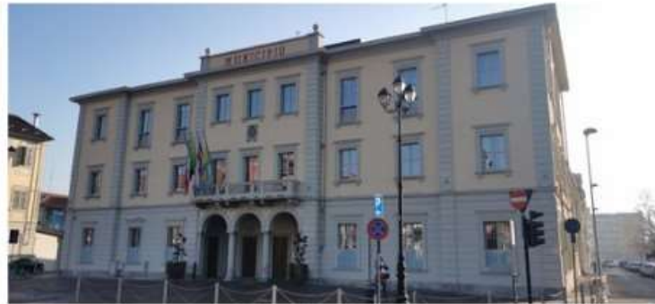
Nichelino digitale: In arrivo oltre 750 mila euro per sette progetti