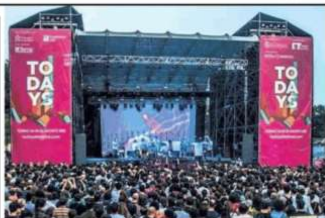
▲ Edizione 2023 Il palco del Todays dell'anno scorso in Barriera