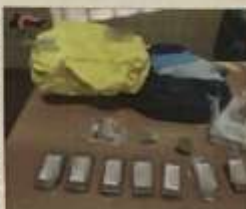
Una parte della droga sequestrata dall'Arma alla banda del nuovo Pablo Escobar

MONCALIERI - Il nuovo Pablo Escobar non era in qualche puerile record dell'America Latina, bensì nel nostro territorio. Ma tutto il suo mondo legato allo spaccio di droga è stato debilitato dai carabinieri nella mattinata dello scorso 11 aprile, nell'ambito di un'operazione denominata guarda caso Pablo che però è stata resa nota solamente una settimana fa, quindi mercoledì 10 aprile. Ad occuparsene sono stati i militari della Tenenza di Ciné, che sotto il coordinamento del tribunale di Torino hanno messo in atto a Moncalieri e Torino un'ordinanza di esecuzione di misure cautelari nei confronti di tre uomini. Quindi possiamo dire che si definiva il nuovo Pablo Escobar il Menne che, insieme a due complici, gestiva un vasto giro di spaccio tra Moncalieri, Nichelino e Vinovo.