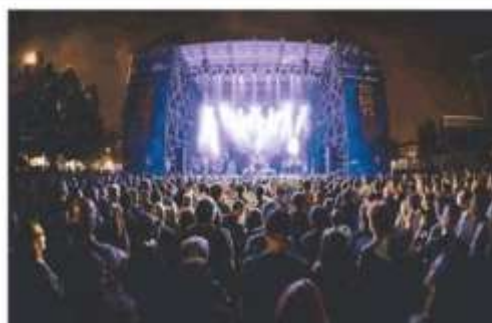
Il festival durerà almeno una settimana nell'area nord della città

Il cambio di passo, voluto dal Comune, mira a mantenere l'evento sul territorio di Torino Nord, ma ad ampliarlo dai tre giorni abituali ad alme-