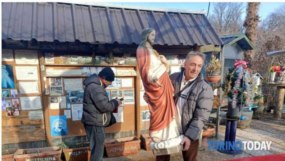
La statua il giorno che venne portata via, a dicembre 2022.

È del tutto abusiva, poco più di un anno fa era salita agli onori delle cronache per alcune visioni di una statua piangente. Che quando è stata portata via non si sono ripetute