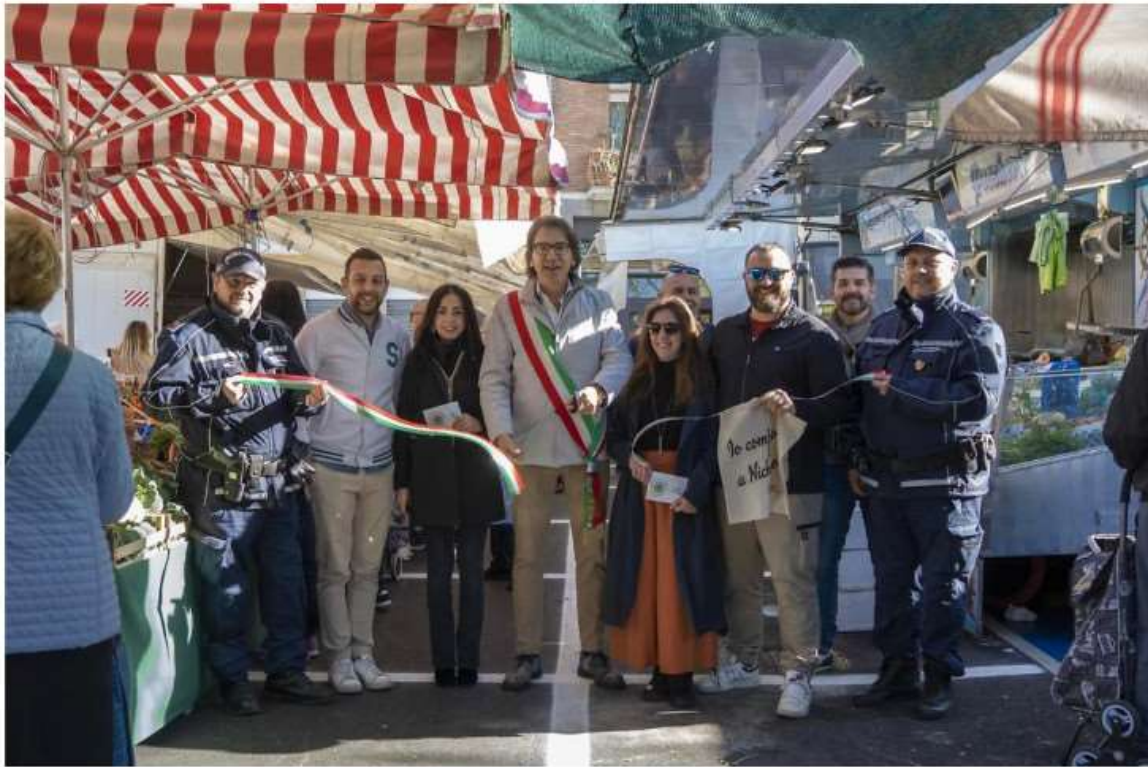
Riaperta piazza San Quirico Nichelino

Nichelino ha riaperto piazza San Quirico , l'area in cui si tiene il mercato.