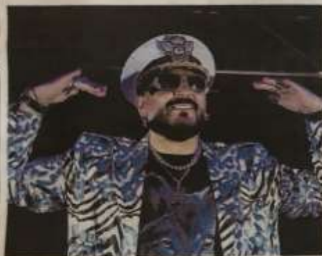
Super Gigi D'Agostino