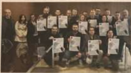
Lavoratori sindacati, riuniti con il collettore della raccolta fondi promossa dalla Fiom Cgil di Torino

Sono 30 i Comuni di residenza di queste lavoratrici e lavoratori senza futuro: da Valenza Cerna e nei comuni dove metropolitani vogliono far arrivare il loro