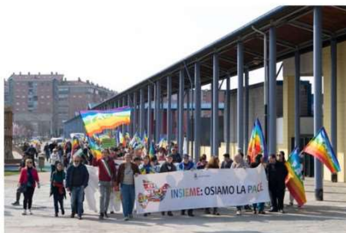
A Nichelino tutto pronto per la quarta edizione della Marcia della Pace

Appuntamento sabato 23 marzo, con ritrovo in piazza Camandona