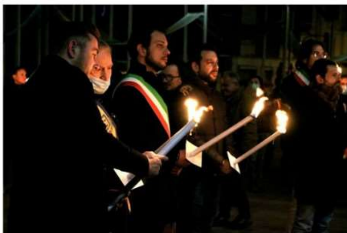
Moncalieri e Nichelino unite dal no a tutte le mafie (foto d'archivio)

Nella serata di martedì torna la fiaccolata, a due giorni dal 21 marzo, Giornata in ricordo delle vittime innocenti della criminalità organizzata. Il percorso e tutte le informazioni sull'evento