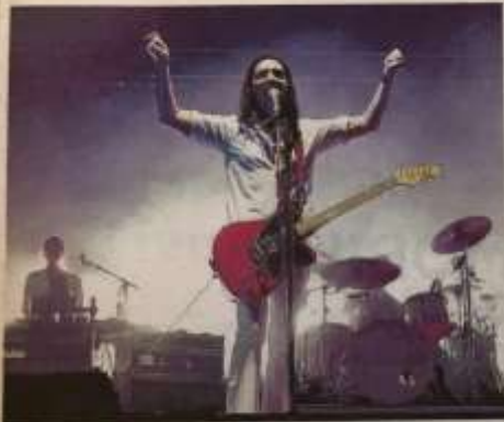
Brian Molko durante il concerto a Stupinigi