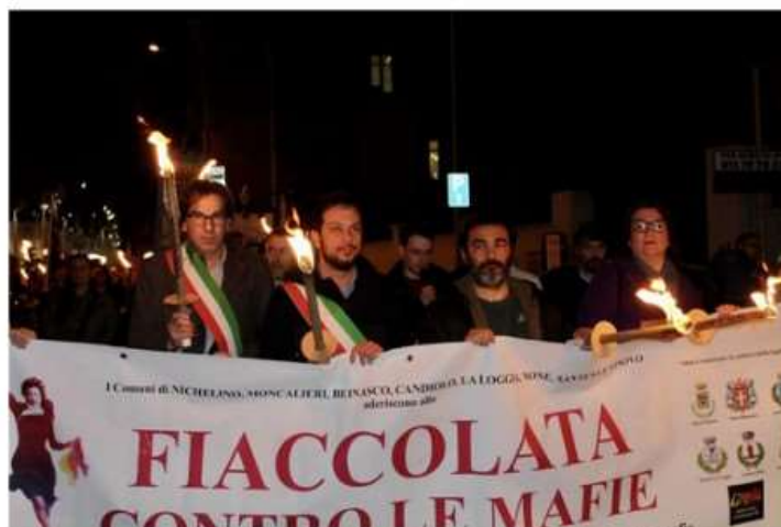
In centinaia alla fiaccolata da Nichelino a Moncalieri per dire no a tutte le mafie