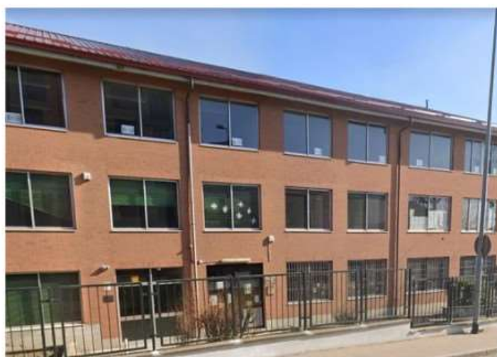
A Moncalieri sarà attivata la nuova centrale operativa territoriale dell'Asl To5

Le altre due a Chieri e Nichelino, a partire da mercoledì 27 marzo