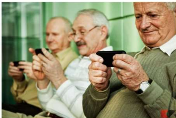
Nichelino, gli under 20 diventano 'tutor' e aiutano gli anziani nell'alfabetizzazione digitale

Con il progetto "Tessere relazioni", si intendono promuovere azioni e laboratori di promozione del ruolo attivo delle persone anziane