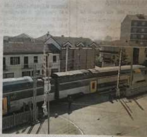
Le sbarre alzate in via Giusti mentre passa il convoglio

mento della tratta cittadina della Torino-Pinerolo (si parla di almeno cinque amministrazioni comunali fa), ovviamente mai messa in pratica per i costi sesquipedali. Una città spaccata in due, che in determinate ore del giorno vede via Torino e via Giusti (dove ci sono i passaggi a livello) diventare una bomba ecologica di smog e traffico con incolonnamenti e presidi della polizia locale per evitare guai. Perché i guasti ai pas-