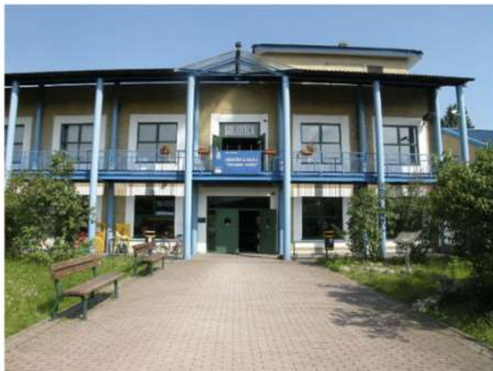
La ludoteca di Nichelino festeggia i suoi primi 30 anni

Si comincia martedì sera, poi appuntamenti e incontri fino a maggio