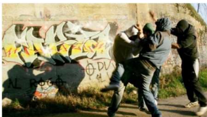
Baby gang a Nichelino: in tre circondano un coetaneo per rubargli lo smartphone (foto di archivio)

L'intervento dei carabinieri ha consentito di arrestare un componente della banda: si tratta di un 16enne