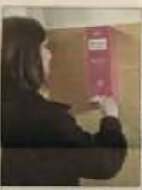
18, in Sala Mattei (Municipio) "Taboo (revolution)". Cambiano la narrazione sul ciclo mestruale in collaborazione con This Unique e proiezione del progetto "Uguaglianza mestruale"