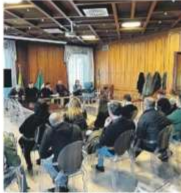
La conferenza stampa sulla situazione Delgrosso.