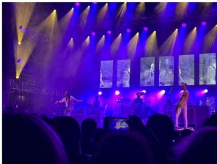
Insultò la Meloni durante concerto: Brian Molko dei Placebo verso il processo

L'accusa nei confronti del leader e cantante della band britannica è diffamazione e vilipendio