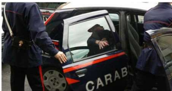
Droga e spaccio 'sono affari di famiglia': in manette madre e due figli a Nichelino

I tre erano finiti nei guai già alcuni mesi fa