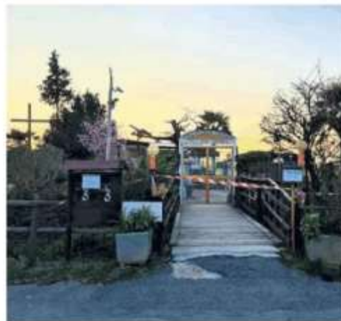
Le costruzioni abusive sorte nell'area di preghiera

«Il sequestro dell'area è stato necessario - spiega in una