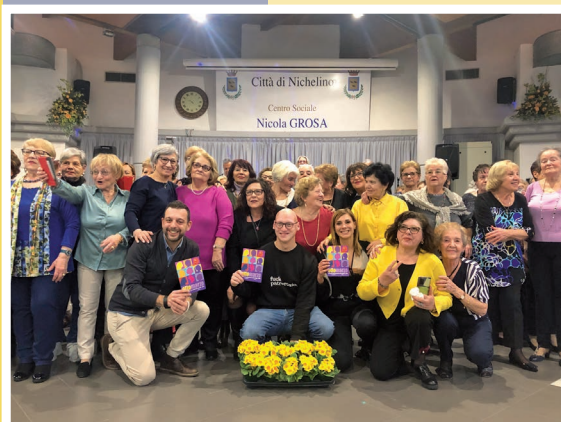
8 Marzo - Pomeriggio danzante al Centro N. Grosa per la Giornata Internazionale della Donna