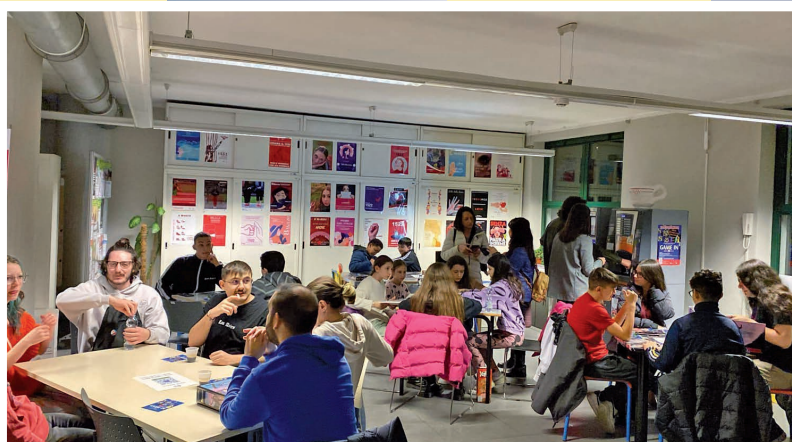
23 Febbraio - Game In Biblioteca. Serata inaugurale