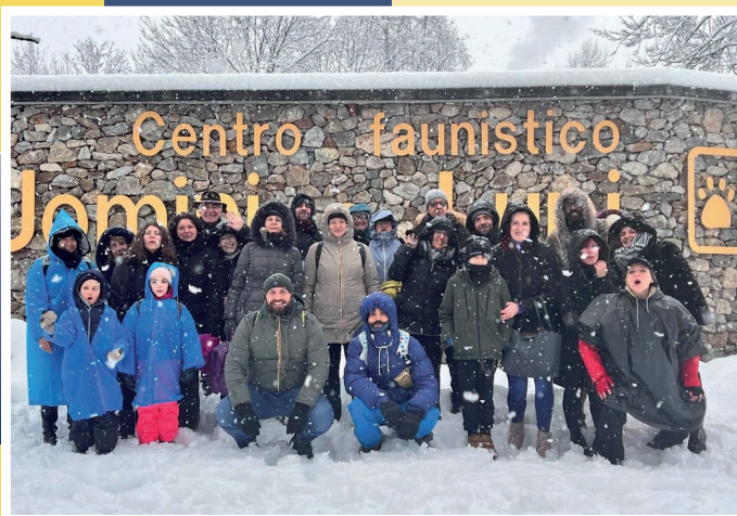
3 marzo - Gita al Centro Uomini e Lupi