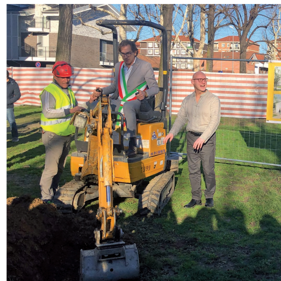
7 Marzo - Posa della 1° pietra della nuova scuola Rodari e della Ludoteca