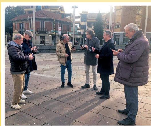
16 febbraio - Il Wi-Fi gratuito è arrivato a Nichelino