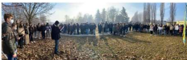
Giorno della Memoria, a Nichelino saranno piantati dieci nuovi alberi nel giardino dei Giusti