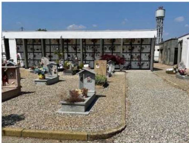
Vandali e ladri prendono di mira anche il cimitero di Nichelino

Dopo i casi, tra i tanti, di Rivalta e Beinasco, segnalati furti di piccoli oggetti e rosari anche nel camposanto nichelinese