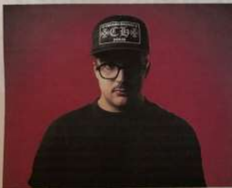
Geolier, Emanuele Palumbo