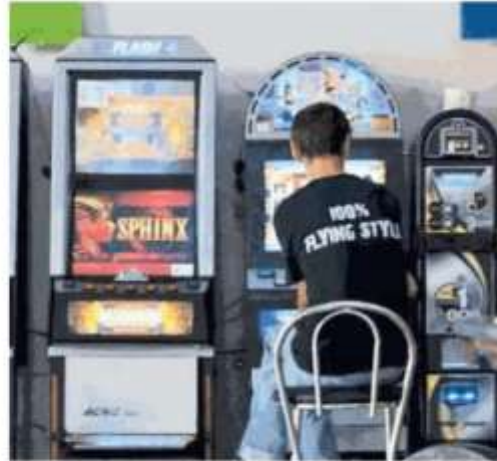
Soprattutto i bar nel mirino dei controlli

Poi ci sono le slot. Il primo verbale da ottomila euro è stato contestato a un bar che dista