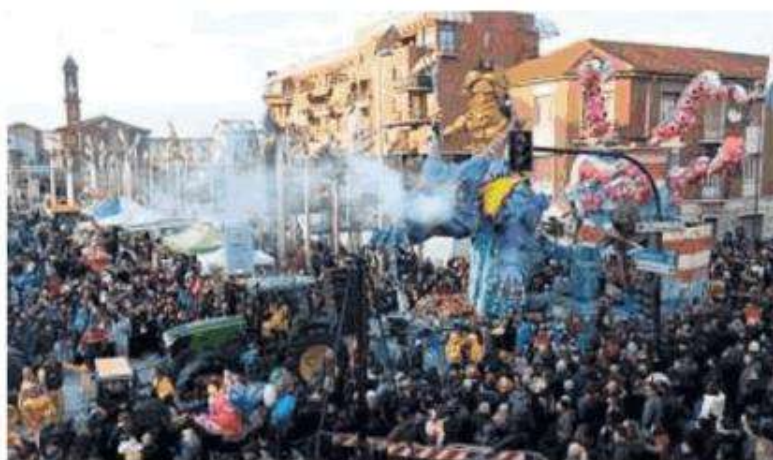
La sfilata di carri a Nichelino

E una manifestazione giovane il Carnevale delle tre C ("Carri, coriandoli, chiacchiere") di Nichelino e Stupinigi, ma si va affermando come una delle più importanti del Piemonte per numero di presenze e qualità dei carri allegorici che sfilano per le vie. L'ottava edizione, organizzata da Ascom Moncalieri e associazione Patela Vache con il supporto della Città di Nichelino ( https://comune.nichelino.to.it ), si apre sabato 27 gennaio alle 15, in piazza Di Vittorio, con il Carnevale dei Bambini, tra balli di gruppo, cosplay, truccabimbi, animazione musicale e distribuzione di dolci. Domenica 28 alle 14 da piazza Camandona partirà la grande sfilata allegorica aperta dalla Banda musicale "Giacomo Puccini" in una veste insolita e dal carro di rappresentanza di Nichelino e Stupinigi con a bordo i protagonisti della kermesse, Madama Farina e Monsù Panaté. L'evento, presentato da Elia Tarantino e Mauro Forcina, in caso di maltempo sarà rinviato a sabato 9 marzo. Una sessantina di chilometri a