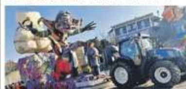
Un'anteprima del carro di Nichelino, ancora da terminare.

NICHELINO La città sfida le rigidità climatiche del calendario e, a ridosso de "Il di dia merla", domenica 28 dalle 14 tornerà a riempirsi di carri allegorici e costumi sfavillanti. Lungo via Torino sono attese decine di migliaia di persone per quello che anche quest'anno si preannuncia come uno spettacolo capace di attirare famiglie da ogni angolo della provincia, dal momento che negli ultimi dieci anni il Carnevale "Carri, corlandoli, chiacchiere" ha acquisito un ruolo di tutto rilievo tra le manifestazioni a tema. L'assessore ai grandi eventi e alle tradizioni Giorgio Buggiero, spiega come la sfilata sia il compimento del lavoro di un anno, perché «dopo ogni edizione partiamo immediatamente a programmare l'appuntamento successivo».