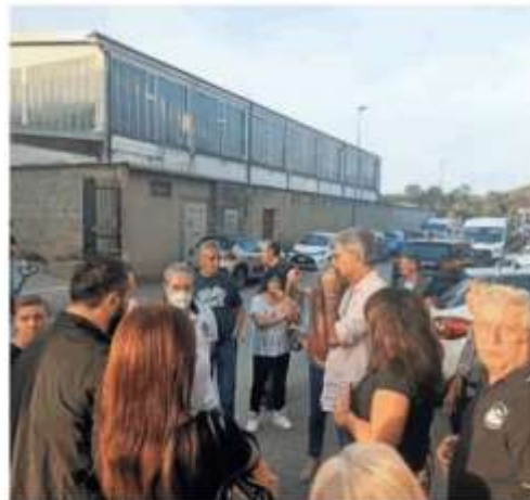
Un sit-in dei residenti scesi in strada per protestare

denti di quella zona sono piombati nell'incubo. Via Fenestrelle è stretta, una strada secondaria diventata (dopo le prime proteste) a senso unico proprio per evitare che i furgoni intasassero la viabilità. La polizia locale aveva fatto dei sopralluoghi apposta. La zona è un misto tra industriale e residenziale e il palazzo di chi non ce la fa più è dirimpetto, a cinque metri di distanza. Gli abitanti subiscono tutto: rumori alla mattina