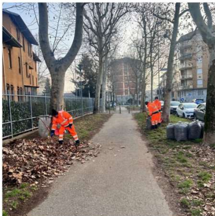
Iniziati a Nichelino i progetti di Pubblica Utilità per il decoro urbano

La pulizia delle strade, la raccolta delle foglie e alcune piccole manutenzioni per migliorare il decoro urbano resi possibili grazie anche ai Cantieri di Lavoro attivati a fine 2023