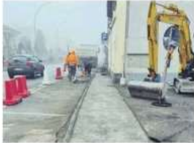
Uno dei tratti di marciapiede su cui si interverrà.

Adesso, sull'argomento, una nuova battuta dall'Amministrazione su Facebook lunedì 22: «Candiolo ha partecipato, positivamente, al bando regionale per l'incentivazione dei Comuni alla redazione del Piano per l'Abbandonamento delle Barriere Architettoniche, sulla base delle somme assegnate è stato, quindi, conferito l'incarico ad un professionista per la predisposizione del Piano. Al fine di coinvolgere attivamente la popolazione è stato predisposto un apposito questionario, la cui compilazione, su base volontaria, consentirà di contribuire ad individuare situazioni meritorie di attenzione, in tema di eliminazione delle barriere architettoniche. Il modulo, scaricabile direttamente dal sito istituzionale o