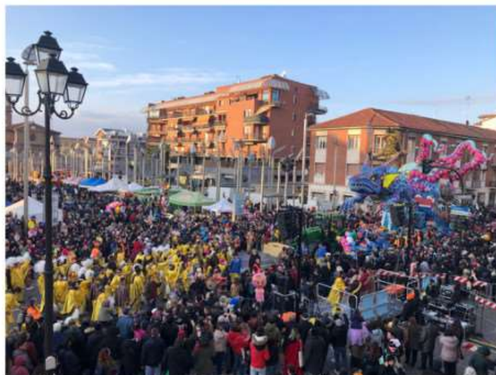
A Nichelino tutto pronto per la grande sfilata dei carri di Carnevale

Sabato 27 sarà dedicato al carnevale dei bambini, mentre la domenica via Torino sarà invasa dai colori e dallo spettacolo dei carri allegorici