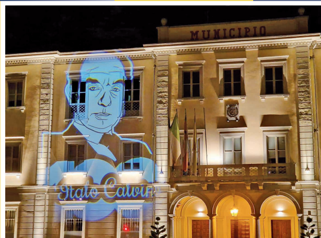
Omaggio a Italo Calvino per il centenario della nascita. 15 ottobre 2023