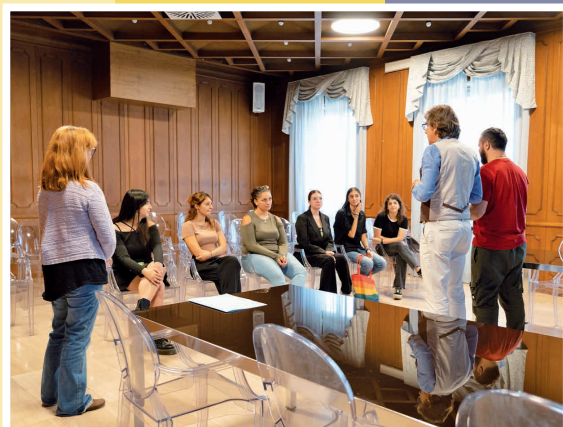
Benvenute alle ragazze del nuovo bando di Servizio civile 2023-2024