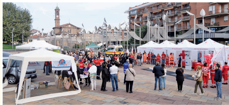
Giornata della prevenzione e della rianimazione cardio polmonare. Domenica 15 ottobre 2023