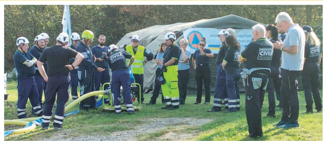
Il Gruppo Comunale di Protezione Civile della Città di Nichelino durante l'esercitazione del 14 e 15 ottobre 2023