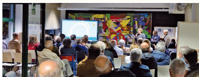
I 30 anni della Biblioteca civica G. Arpino. Giovedì 19 ottobre 2023