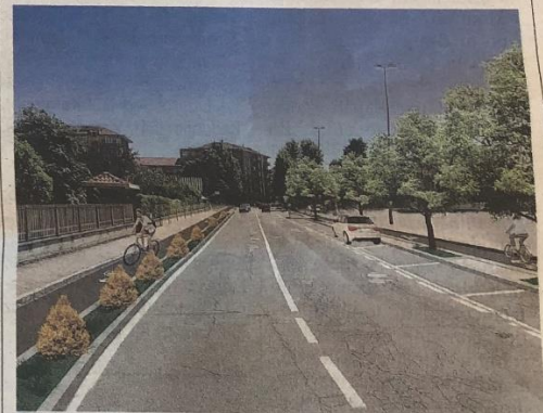
Il rendering della nuova pista ciclabile

Malumori tra i residenti che cadono dalle nuvole dopo la presentazione del progetto il tracciato lungo tre chilometri taglierà in due la città per collegare la stazione a ponte Europa