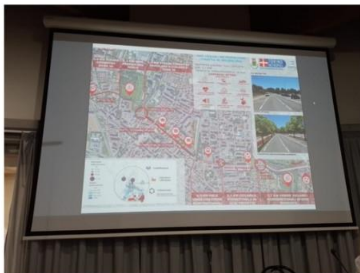
1,3 milioni per la ciclabile di Nichelino che nascerà nella primavera 2024

Il progetto mette insieme i fondi di Città Metropolitana, Comune di Nichelino e Regione. Tolardo: "Un dovere pensando alle nuove generazioni"