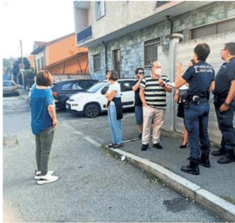
Alcuni dei residenti di via Fenestrelle con la polizia locale

Via Fenestrelle è stretta, una strada secondaria e a doppio senso, che porta verso il parco del Boschetto. La zona è un misto tra industriale e residenziale: la gente è abituata a convivere con chi lavora. I furgoni collegati alla