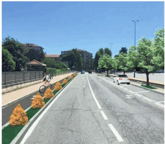
Il rendering della nuova pista ciclabile di Nichelino