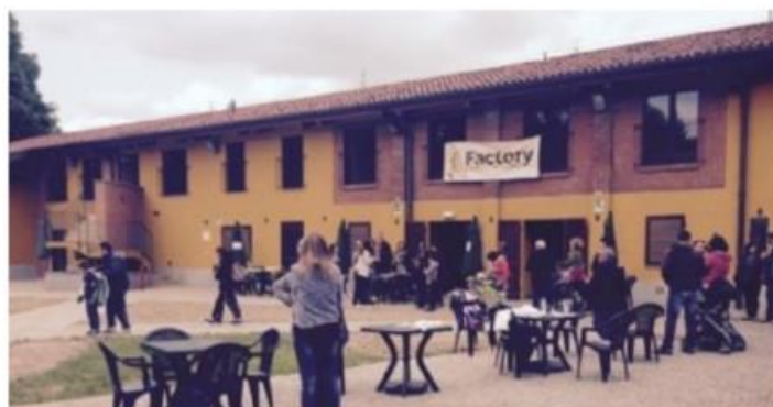
All'Open Factory di Nichelino una serata dedicata agli animali e all'animalismo

Sabato 7 ottobre in programma la presentazione del libro "Salva una Vita. Il mondo dell'animalismo e i suoi segreti" di Gabriele Merlo