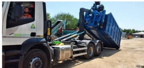
Per frenare i 'furbetti dei rifiuti' a Nichelino torna nel weekend l'isola ecologica itinerante

Tutti gli appuntamenti di ottobre e i quartieri interessati dall'iniziativa promossa dal Comune in collaborazione con il Covar