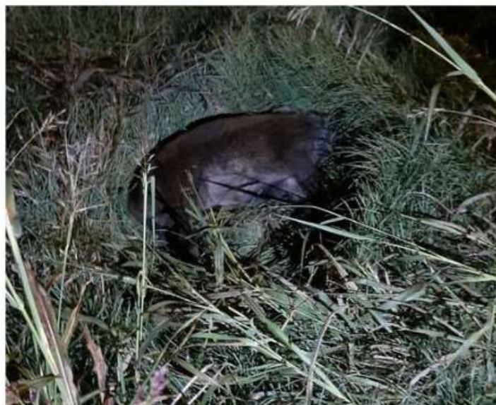
Nichelino, torna l'allarme cinghiali sulle strade: due casi in zona Stupinigi (foto d'archivio)

Il primo episodio avvenuto sulla strada che porta a Vinovo lunedì sera, il secondo nei pressi di Candiolo