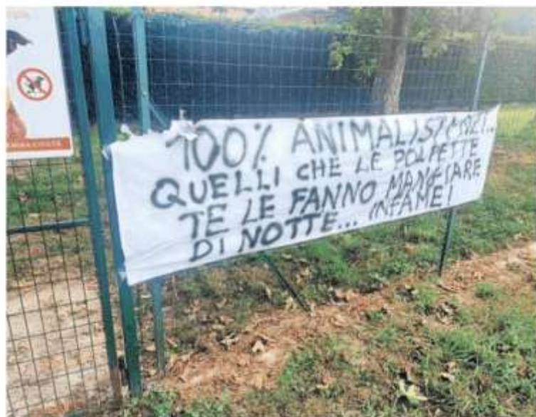
Lo striscione firmato «100% animalisti» è apparso sulla recinzione dell'area cani di via Pateri