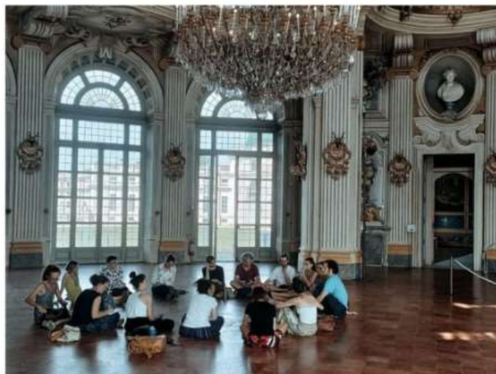
Con "Feste" l'arte esperienziale trova casa alla Palazzina di Stupinigi

Si comincia sabato 21 ottobre con "Dance Well", la pratica artistica rivolta a persone con Parkinson e ai loro familiari. La collaborazione con Ugi