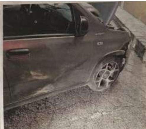
I danni provocati dai cinghiali alle auto

CORIO Il corpo dell'uomo, che aveva 76 anni, rinvenuto dal soccorso alpino. I familiari avevano dato l'allarme