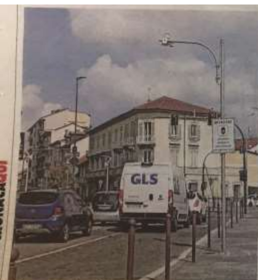
Telecamere in piazza Camandona