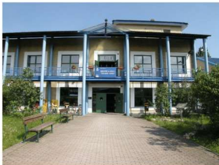
Nichelino festeggia i primi 30 anni della biblioteca civica Arpino

Le testimonianze degli ex sindaci e assessori alla cultura, le letture dedicate, il cineforum per concludere con l'immane taglio della torta