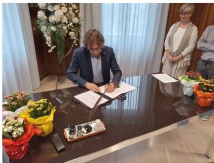
Nichelino rinnova l'impegno contro la dislessia "per dare a tutti le stesse opportunità"

Con il progetto "Rete Dislessia e accessibilità" viene data continuità al protocollo già esistente dal 2010. Coinvolte scuole e Asl To5. Tolardo: "Con la biblioteca Arpino iniziato un cammino che deve proseguire e progredire ancora nei prossimi anni"