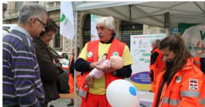
A Nichelino e Moncalieri tutto pronto per la giornata della rianimazione cardio polmonare

L'appuntamento è domenica 15 ottobre in piazza Di Vittorio e al Palaexpo. Lo slogan scelto è "Ogni cittadino del mondo può salvare una vita"