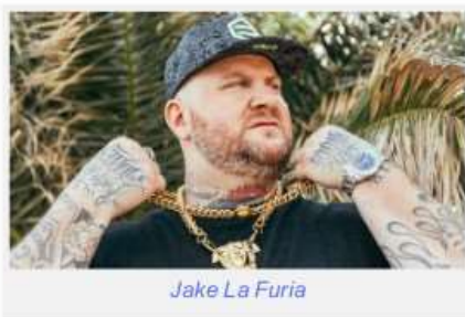
jake la furia

Dal 14 al 24 settembre fiera e spettacoli per i festeggiamenti del Santo Patrono di Nichelino in piazza Polesani nel Mondo