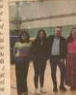
L'inaugurazione dell'anno scolastico nella palestra dell'Erasmus da Rotterdam