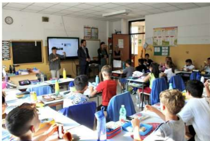
Moncalieri e Nichelino al suono della campanella: "La scuola viene prima di tutto"

Nella città guidata da Paolo Montagna tempo pieno per tutti i ragazzi sino ai 14 anni, con un investimento di oltre 400 mila euro. Il sindaco di Nichelino Tolardo: "Scuola sinonimo di scoperta e crescita"