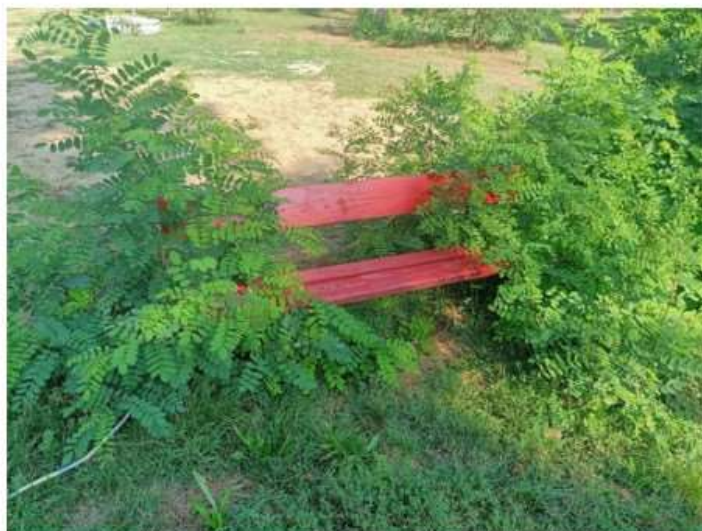
Nichelino, non solo incivili al parco del Boschetto: ora c'è il rischio giungla

In alcuni tratti l'erba alta oltre un metro e mezzo crea problemi ai runner, ma pure alla famiglie che vengono a fare il picnic con bimbi piccoli