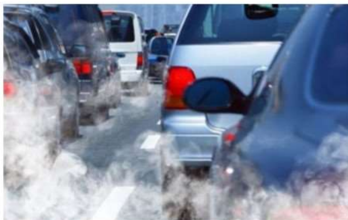
Euro 5, Tolardo controcorrente: "Il rinvio è davvero una vittoria?"

Il sindaco di Nichelino sottolinea l'importanza di politiche a favore dell'ambiente: "Eliminiamo le infrastrutture inutili"