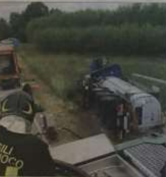
Un'immagine dell'incidente furto dei vigili del fuoco. I tentativi del Comandante. Pesanti le ripercussioni sulla circolazione stradale, come era accaduto la scorsa settimana, a Torino, per un incidente analogo (il camion era pieno di Gpl), sulla «129».

NICHELINO - Intervento dei vigili del fuoco lunedì mattina, a Nichelino, per evitare che una intera finestrata di un appartamento crollasse in strada. Eventualità che è stata appunto scongiurata, ma ovviamente solo perché la cosa è stata gestita per quello che era una autentica emergenza. Teatro del fatto un alloggio delle case popolari di via Pracevallo 54, nel quale abita una coppia di anziani coniugi. Sono stati proprio loro ad accorgersi che l'infisso si era sganciato dal telaio e che da lì a poco avrebbe potuto precipitare nella sottostante strada, con tutte le conseguenze del caso. Ma come sappiamo l'infisso è stato dato per tempo e i pompieri hanno potuto gestire la situazione e rimediare la sicurezza. Dopo il personale Atc ha provveduto ad ingegnerizzare l'infisso.