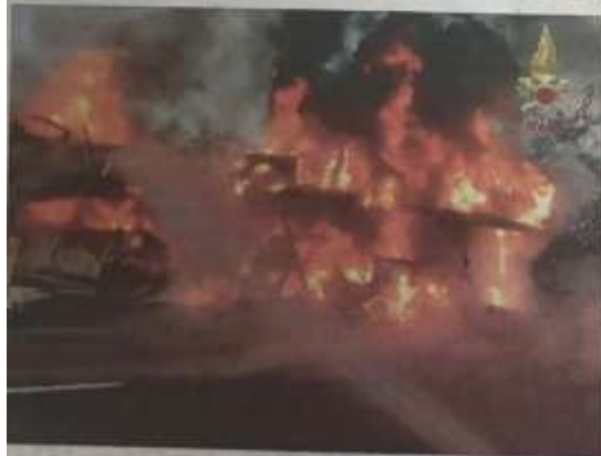
Tre scatti del rogo, che ha avvolto la bisarca carica di auto in viaggio sulla «A6». Nessuna delle macchine si è salvata dal fuoco