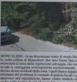
MONCALIERI - In un determinato tratto di strada Maiole, sulla collina di Moncalieri, due auto fanno fatica ad incrociarsi a causa della vegetazione selvaggia che ormai invade la carreggiata restringendola eccessivamente. La dicono alcuni residenti della zona, i quali hanno dapprima informato del problema il comando di polizia locale e poi, attraverso una segnalazione, hanno voluto renderlo noto anche sulle pagine de "Il Mercoledì", con tanto di foto descrittive.