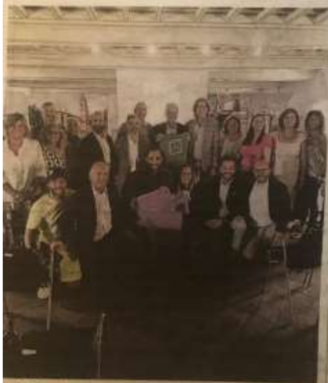
SportCity Day è stato presentato ieri a Stupinigi

SPORTCITY DAY Presentata la manifestazione, si potranno provare diverse discipline