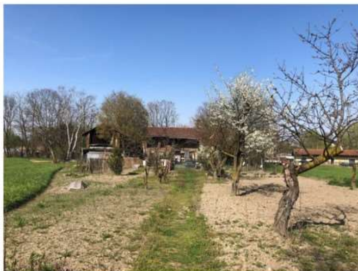
Al Ranch delle Donne di Nichelino si corre contro il cancro

Domenica in programma "5 Km contro 5 tumori", a ridosso della Giornata mondiale dei tumori ginecologici del 20 settembre. E lunedì sera una sfilata durante la festa di San Matteo