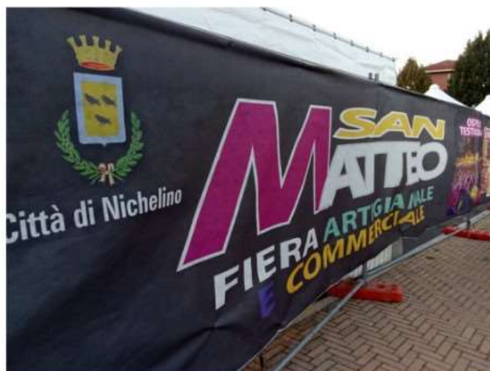
Nichelino, iniziato il conto alla rovescia per San Matteo 2023

Dal 14 al 24 settembre la Città onora il suo Santo patrono con dieci giorni di eventi e manifestazioni: il calendario completo