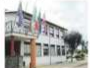
Il Municipio.