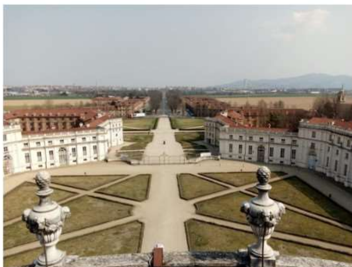
Stupinigi diventa per quattro giorni set cinematografico

Dal 29 agosto al 1° settembre la residenza sabauda del Comune di Nichelino ospiterà alcune riprese della serie tv "Il Conte di Montecristo"