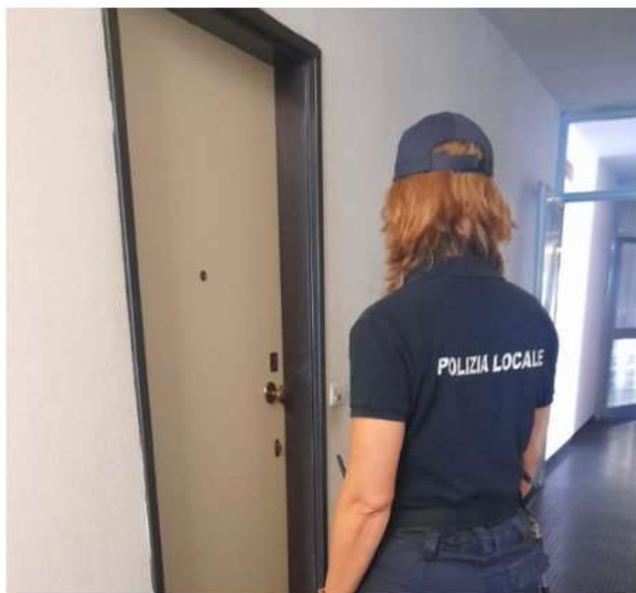
Nichelino, sgomberato un alloggio Atc occupato abusivamente in via Parri

Al momento dell'intervento della Polizia locale non erano presenti gli occupanti