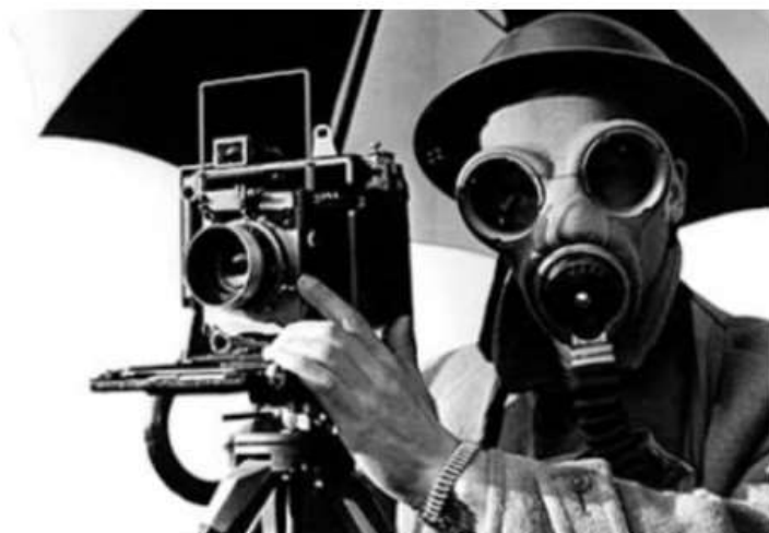
Lee Miller alla Palazzina di Stupinigi: dalla fotografia surrealista al reportage di guerra

In mostra dal 9 settembre al 7 gennaio 2024