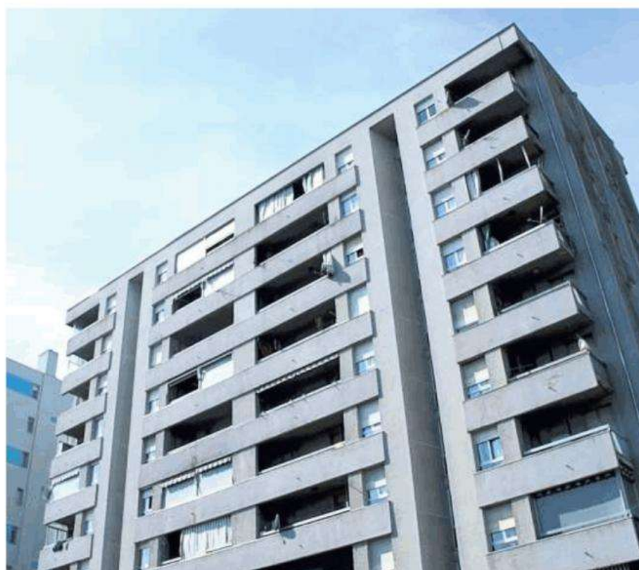
Le case Atc di via Mirafiori a Beinasco

«La carenza di alloggi di edilizia sociale è un problema complesso, che affonda le sue radici in una mancanza di investimenti, nella scarsità di nuove costruzioni, nell'aumento della domanda, condizionata dall'acuirsi