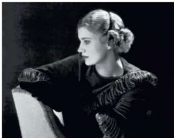
LEE MILLER, SELF PORTRAIT WITH HEAD-BAND, 1928