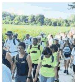
La camminata del 2022

Domenica ci sarà “Lungo le rotte di caccia dei Re: Palazzina di Caccia di Stupinigi”, un'inedita avventura