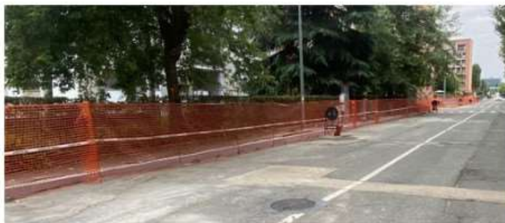
Nichelino, via Del Pascolo si rifà il look: partiti i lavori di rifacimento

Gli interventi fanno parte di un progetto più ampio dell'Amministrazione per rimettere a posto vie e strade della Città