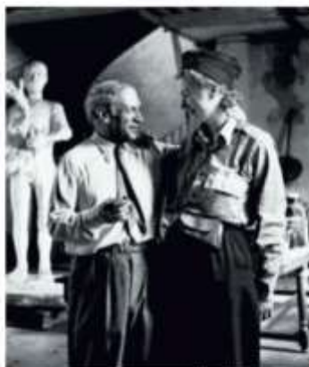
LEE MILLER AND DAVID E. SCHERMAN, 1934