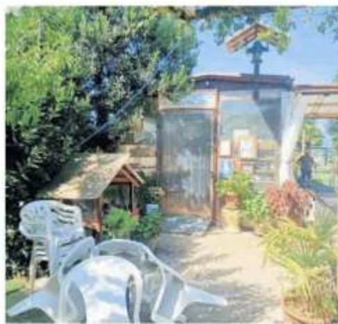
La struttura sorta nello spiazzo della provinciale

al movimento di preghiera, nato e cresciuto in questi anni. Fedeli che condividono il desiderio di demolire la chiesetta. Il perché è molto semplice: «Desideriamo che il luogo torni ad essere più spirituale e meno materiale. Vogliamo fare nostro il messaggio della Madonna, che ci chiede di vivere in umiltà». Ma c'è anche un altro aspetto, sottolineato nella missiva di Pailo: «Evitare conseguenze ai partecipanti dei momenti di preghiera,