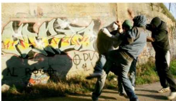
Tre segnalazioni in pochi giorni, baby gang in azione a Nichelino

In un caso la vittima salvata da un passante che ha fatto allontanare i ragazzini. Indaga la Polizia locale