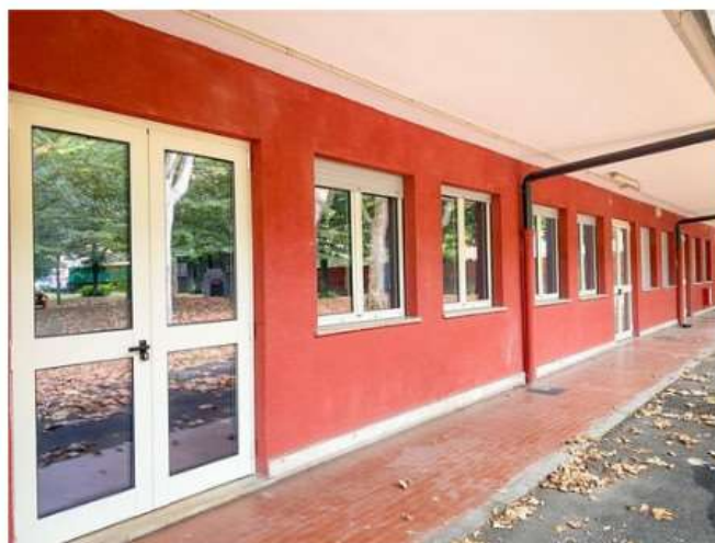
A Nichelino cambiati gli infissi alla scuola Anna Frank

Un investimento da 200 mila euro, che si va ad aggiungere a quelli fatti per la Don Milani e la Walt Disney