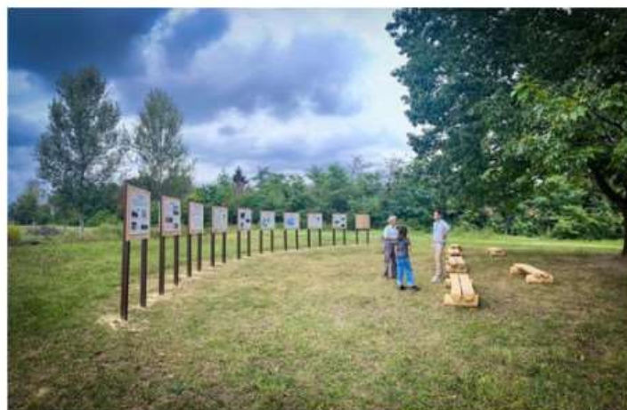
Nichelino in prima fila nella lotta contro il cambiamento climatico

A fine mese sarà inaugurata nel parco di Stupinigi la prima stazione climatologica di riferimento italiana gestita dall'INRIM e dalla Società Meteorologica Italiana