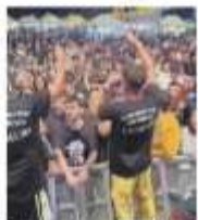
Giovani alla Youth Pride.