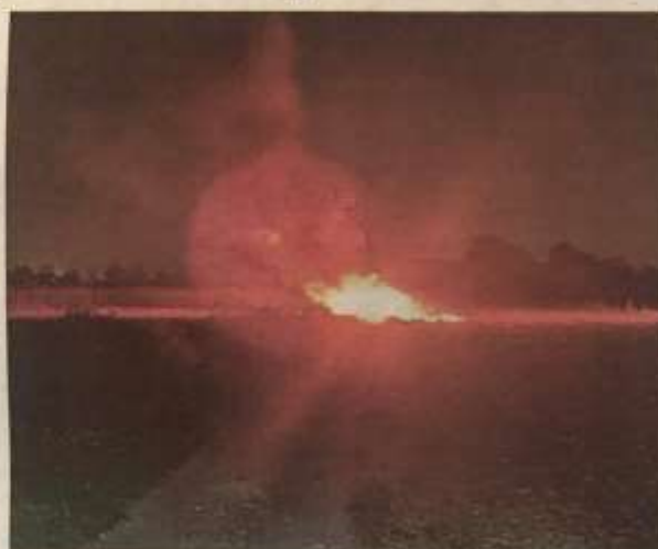
Una delle auto data alle fiamme nell'ultima settimana

NICHELINO - Auto rubate e poi date alle fiamme per i motivi più disparati. Un fenomeno che non è certamente una novità per il nostro territorio e che, in quest'ultimissimo scorcio d'estate che ormai si tuffa nell'autunno, torna a presentarsi con più casi nel giro di poche ore uno dall'altro. Tra i più recenti quello di giovedì notte, a Nichelino. Le fiamme che avvolgevano il veicolo sono state notate lungo l'asse della provinciale «143» e una volta giunta la segnalazione agli appositi centralini d'emergenza i vigili del fuoco sono accorsi per domare il rogo, che ormai stava completamente divorando la carcassa del veicolo abbandonato a bordo della careggiata. Grazie al lavoro dei pompieri l'area è tornata in sicurezza nel giro di pochissimi minuti, ma ovviamente della quattro ruote restava ben poco, solo uno scheletro il cui numero di telaio non è stato sicuramente facile da rintracciare. Ma le forze dell'ordine sono comunque riuscite nell'intento, scoprendo che quella macchina abbandonata e data dalle fiamme dai soliti ignoti era di provenienza furtiva. Nello specifico qualcuno l'aveva sottratta al legittimo proprietario solamente poche ore prima che poi venisse trovata incendiata. Era stata lasciata in sosta regolare a Rivoli e nel frattempo il furto era stato denunciato, che coloro che l'avevano portata via l'hanno avuta in loro possesso per ben poco tempo. Difatti è più facile credere che una