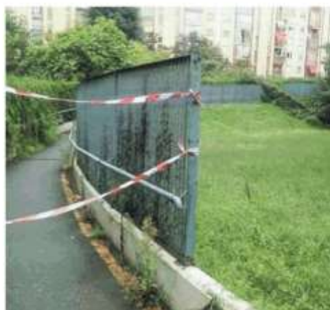
La passerella chiusa e sullo sfondo l'albero crollato

La situazione degli alberi in città non è il massimo. In diverse zone le radici hanno alzato il manto stradale (come ad esempio in via Trento) causando gibbosità molto pericolose. Quegli alberi sono inadatti per un contesto urbano, visto che le radici ramificano in orizzontale e non in profondità. Non è sbagliato pensare che se la situazione dovesse ulteriormente peggiorare, in alcuni casi si dovrà pensare al taglio per ragioni di sicurezza. M. RAM. —