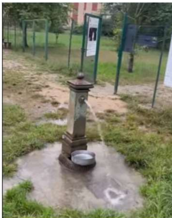
Incivili e vandali in azione a Nichelino: nuovamente danneggiate le aree cani