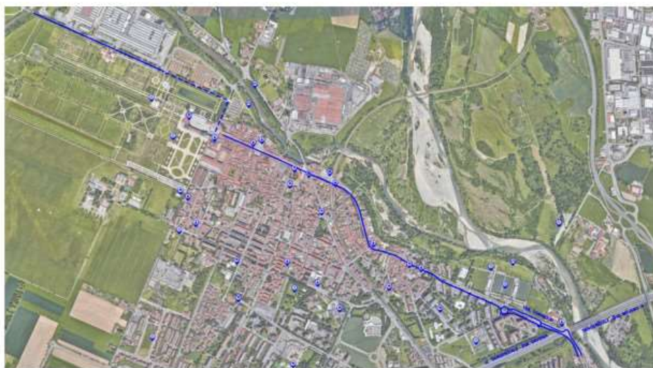
pista ciclabile metropolitana Torino-venaria-2

Nel comune di Venaria sono stati scelti come assi principali di intervento corso Roma e via San Marchese per la realizzazione di un percorso ciclabile di rapido collegamento con la città di Torino. Lungo corso Roma verrà realizzata una “strada urbana ciclabile” con l’apposizione di segnaletica verticale e orizzontale ad indicare la presenza di ciclisti su strada, i quali avranno la precedenza sui veicoli motorizzati. Proseguendo su via San Marchese fino al confine con Torino si procederà con la realizzazione di una pista monodirezionale in sede protetta su entrambi i lati della via. Il progetto è stato pensato per riqualificare l’asse con viali alberati e isole spartitraffico restituendo un’area più permeabile, bella e sicura.