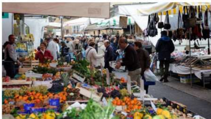
Nichelino, da fine mese il mercato di piazza San Quirico trasloca (foto d'archivio)

Necessari lavori di manutenzione straordinaria per rimettere a posto l'area