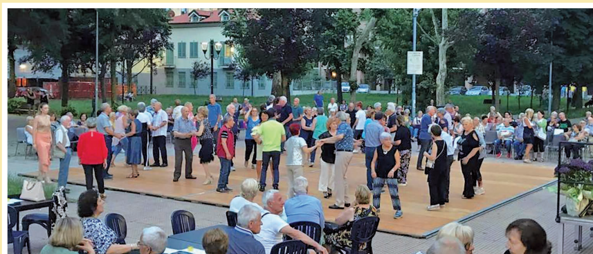
Luglio 2023 - E...state in Città al Centro sociale Nicola Grossa