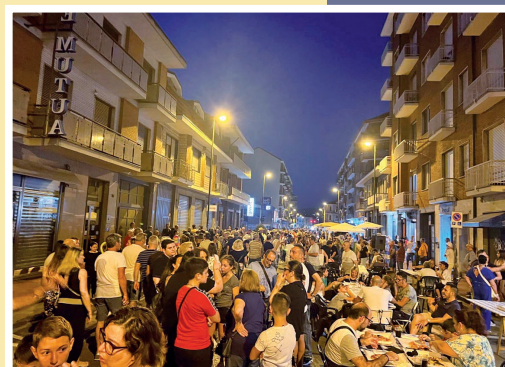
8 luglio - Notte bianca