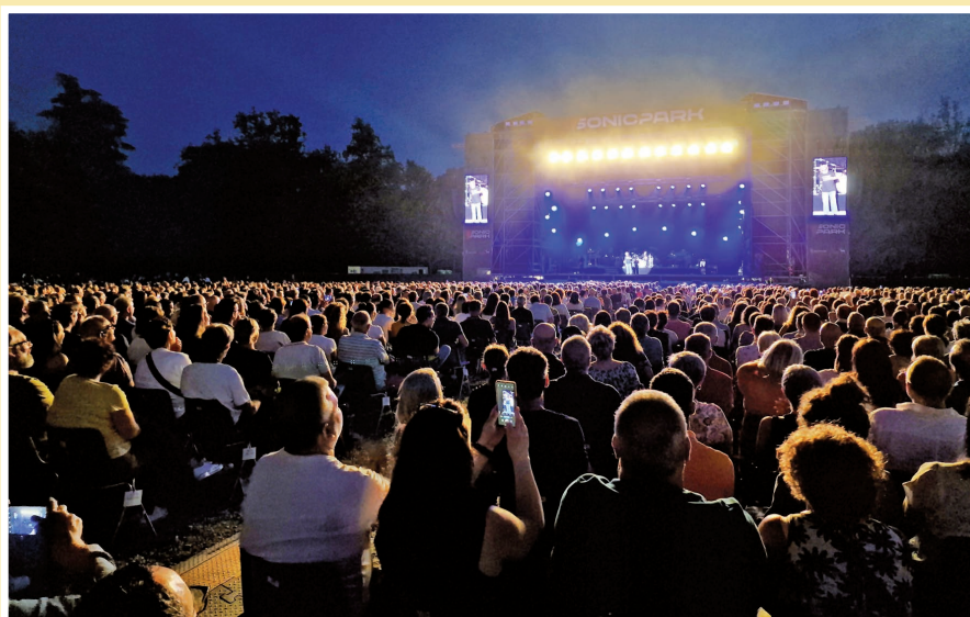
4 - 13 luglio - Sonic Park Stupinigi