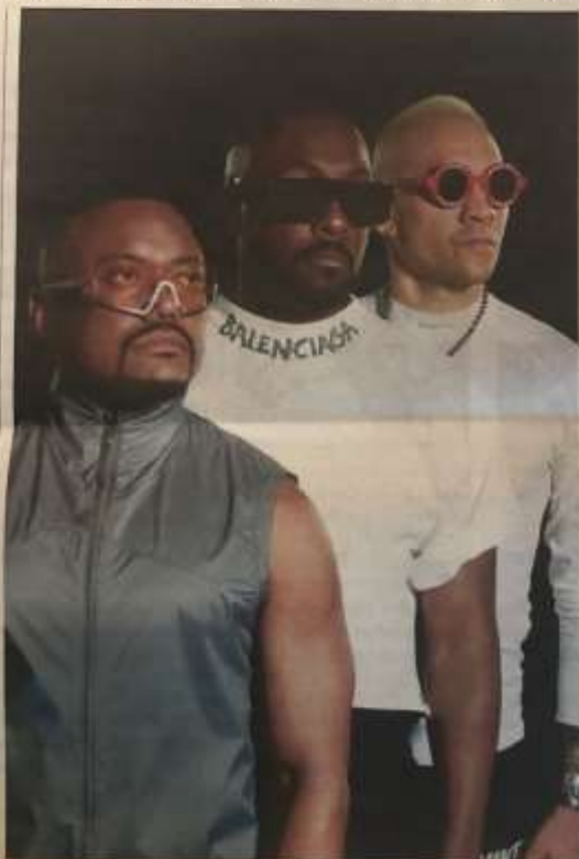
Black Eyed Peas si sono formati nel 1995

di Sanremo è stata leggendaria: cosa ricordate di quei giorni?