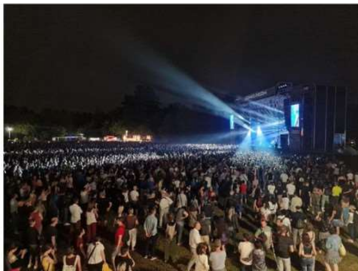
Ieri Sting, stasera il Sonic Park chiude con il botto con i Black Eyed Peas

Un'edizione da record per la kermesse musicale ospitata a Nichelino