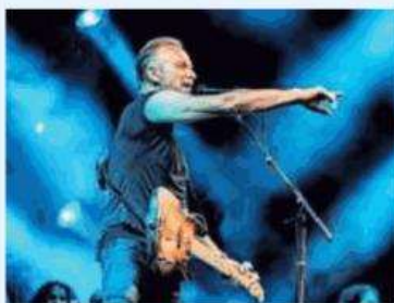
▲ Sonic Park Ospite Sting

Alle 22 all'Arena del Museo del Cinema alla Cavallerizza Reale si proietta il film del 2013 "Solo gli amanti sopravvivono" di Jim Jarmusch.