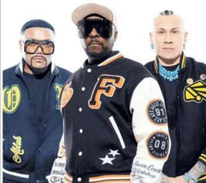
▲ Dagli Usa | Black Eyed Peas per l'ultima serata di Sonic Park con i Motel Connection

"Siamo in continua evoluzione, quindi pensiamo che sia importante anche per noi collaborare con molti artisti diversi"