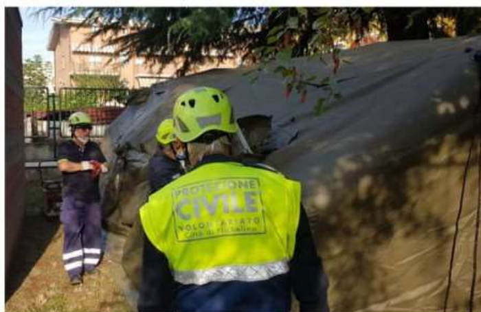
Giovani, volontariato e Protezione civile protagonisti alla Palazzina di Stupinigi

Mercoledì 12 luglio appuntamento con l'evento "Gestione dei disastri naturali: giovani e volontariato"