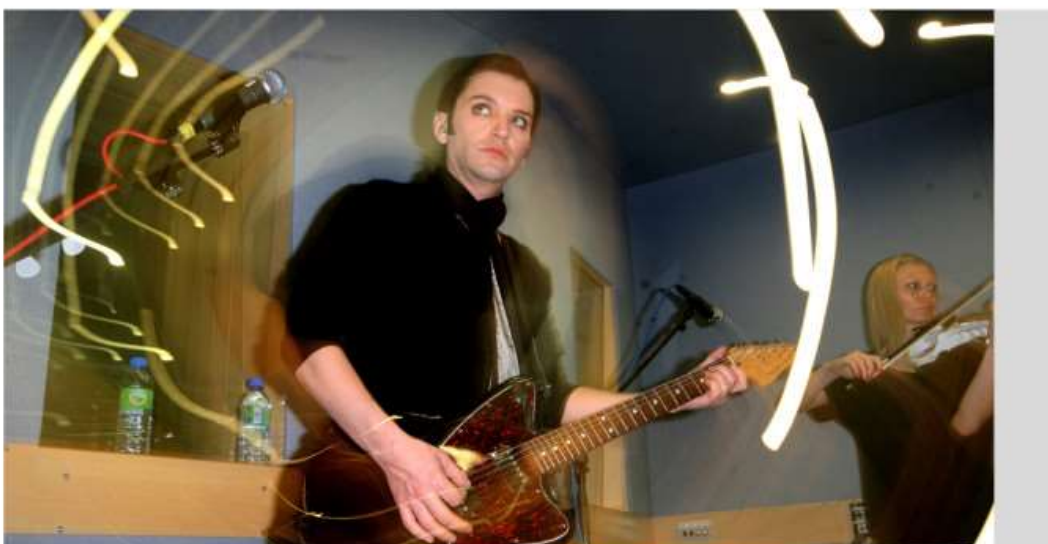
Brian Molko, cantante e chitarrista dei Placebo

Pesanti insulti alla presidente del consiglio Giorgia Meloni sono volati nella serata di ieri, martedì 11 luglio 2023, dal palco dello Stupinigi Sonic Park, a Nichelino. A pronunciarli il cantante e chitarrista dei Placebo, Brian Molko, che l'ha definita, davanti ai 5mila spettatori del concerto della band, "razzista, fascista, pezzo di m..., nazista". I carabinieri della tenenza cittadina, che si trovavano all'evento per fare ordine pubblico, hanno trasmesso una segnalazione alla procura di Torino che potrà fare le valutazioni del caso.