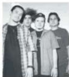
I britannici Placebo, i Melvins e Murubutu con Claver Gold

per un totale di quattordici milioni di dischi venduti. Serratissima l'attività live, un moto perpetuo non sempre facile da gestire quando nel bagaglio c'è anche una certa propensione all'eccesso. Ora i due fondatori e i lo-