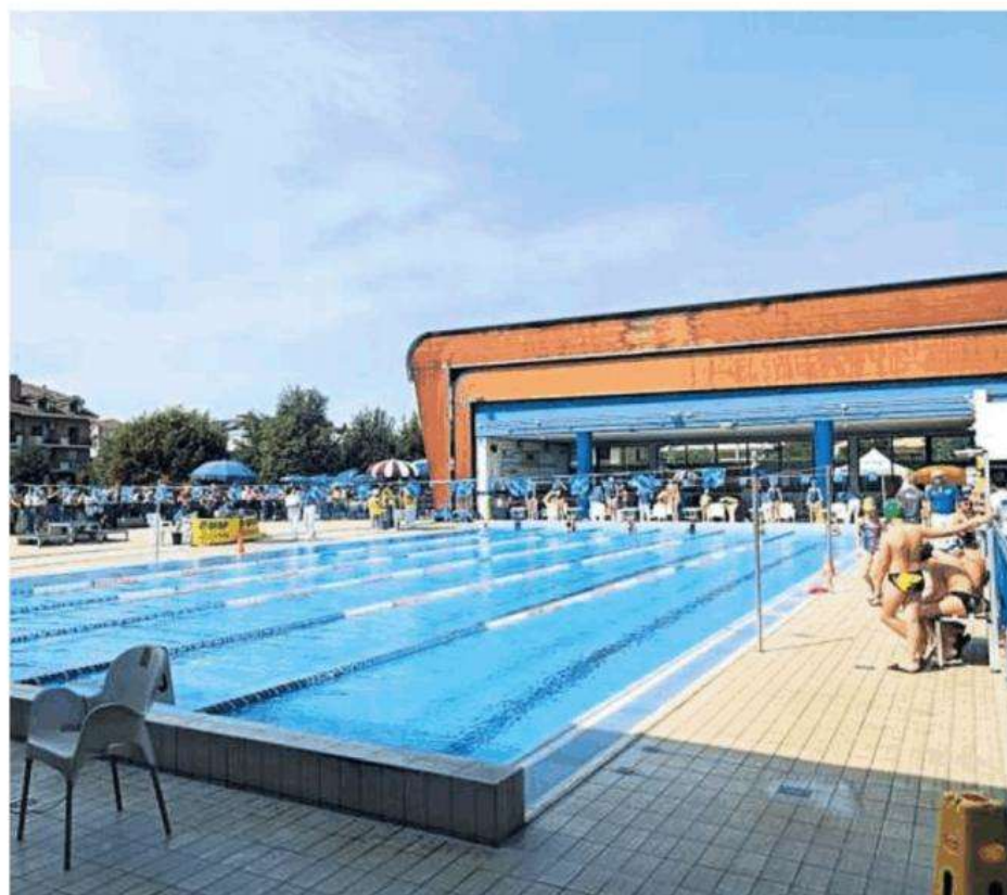
Le vasche del Centro nuoto Nichelino utilizzate per le iniziative dell'Estate ragazzi