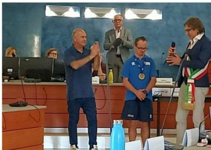
Nichelino premia giovane atleta disabile vincitore di 6 ori ai Virtus Global Games

La cerimonia nel corso dell'ultimo Consiglio comunale. Prosegue l'estate a ritmo di musica e di comicità al Centro Grosa