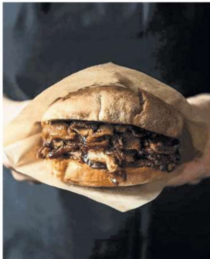
Il panino più cool di Milano, quello di Porcobrado, va in scena a Stupinigi

Abbiamo provato i food truck del Sonic Festival di Stupinigi