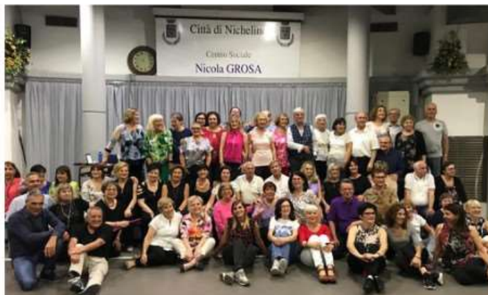
E...state in città: proseguono appuntamenti e serate danzanti a Nichelino

Nuovi incontri con i medici del territorio per il ciclo "La salute al centro"