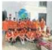
Il gruppo di giovani.

CANDIOLO Si è concluso il progetto "Piazza Ragazzabile" organizzato dal Comune in collaborazione con la Biblioteca Enzo Biagi. Il bilancio? «Molto positivo - sottolinea l'assessore alle Politiche Giovanili, Teresa Fiume - dicono anche i numeri: il primo anno si sono presentati diciassette ragazzi, il secondo anno in ventidue mentre quest'anno il gruppo è stato formato da ventisei ragazzi. Oltre aver dimostrato cittadinanza attiva, l'aspetto più importante del progetto è l'aver creato gruppo tra di loro. I tanti genitori, presenti alla serata finale,