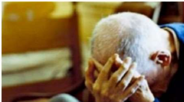
"La accompagno io" e gli ruba il portafoglio: a Nichelino ennesimo caso di truffa agli anziani

Un pensionato 80enne raggirato da una donna