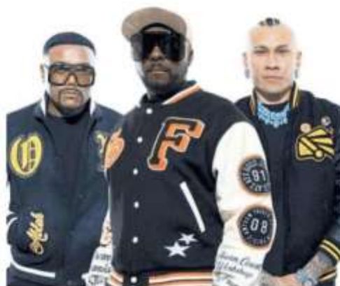
Il gruppo composto da apl.de.ap, will.i.am (compagni di liceo) Taboo

fronte alla spietata realtà della guerra in corso in Europa: «Siamo per la pace e portiamo sempre questo messaggio attraverso la nostra musica, sintonizzandoci sulle frequenze della positività e dell'amore». Messaggio che atterrerà anche sulle teste del pubblico di Stupinigi: «Abbiamo un sacco di bei ricordi legati all'Italia e siamo fan del vostro paese. Ci piace praticamente tutto, dalla cultura al cibo fino all'energia che ci trasmette ogni volta