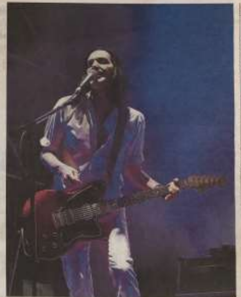
Brian Molko durante il concerto dei Placebo dell'altra sera al Sonic Park, festival in corso a Stupinigi

italiani ma con una netta prevalenza di chi o non ama la politica in generale o non è schierato con la leader del centrodestra. Alla manifestazione, come sempre nel caso di eventi simili, erano presenti anche i carabinieri per garantire l'ordine pubblico. Le parole di Molko, per fortuna, in tal senso non hanno creato problemi: gli italiani sono ormai forse troppo lontani dalla politica per reagire a insulti al loro Presidente del Consiglio e come detto, al contrario, in tanti hanno