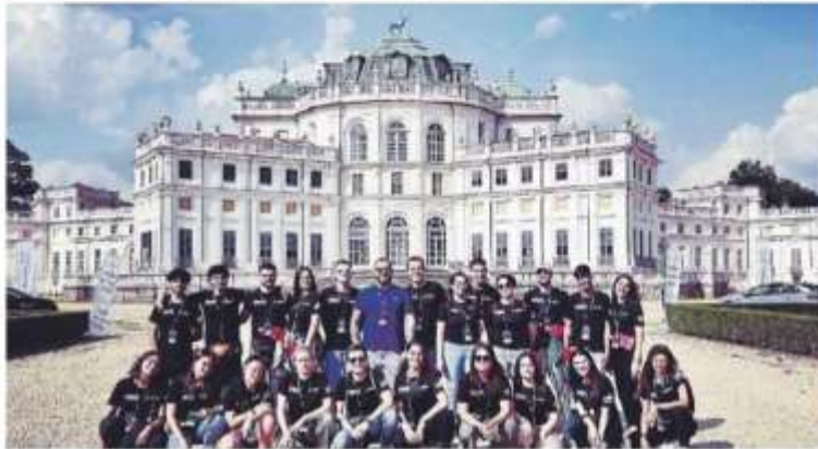
I Cervi Sonici, il gruppo di ragazzi.