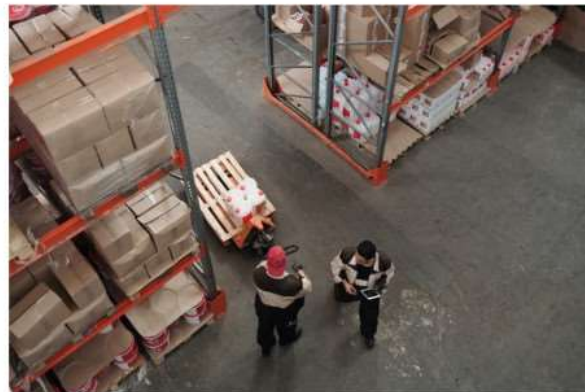
A Nichelino apre il nuovo hub logistico di Talea Group

Si va ad aggiungere allo stabilimento toscano di Migliarino Pisano con un investimento di 5 milioni di euro: consentirà di migliorare la rapidità delle consegne dei prodotti venduti sulle piattaforme digitali proprietarie in Nord e Centro Italia