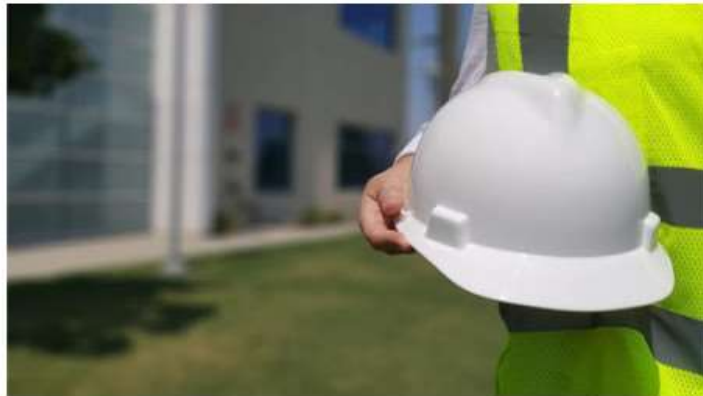
Lavoro, aperte le iscrizioni ad un cantiere over 58 a Nichelino: 5 posti per 12 mesi

Il progetto è "green forever": ecco chi può partecipare e come