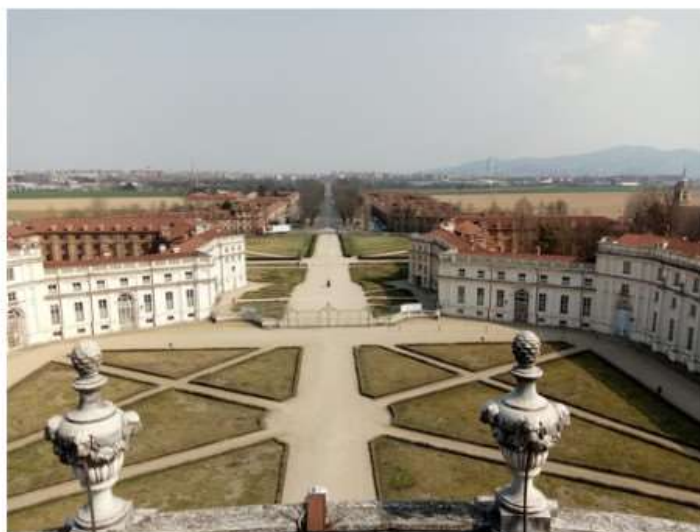
Il prolungamento del 4 fino alla Palazzina tra gli obiettivi del progetto Stupinigi 2030