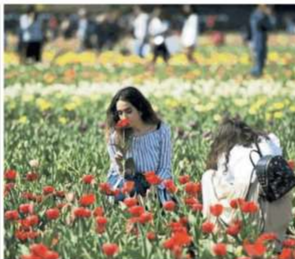
▲ Ambiente al centro a Torino, Chieri, Collegno, Moncalieri, Nichelino, Pino Torinese e Santena via al Festival del Verde fino a domenica

nici specializzati come quello delle piante medioevali a Palazzo Madama e quello sulle specie tintorie del Museo del tessile di Chieri, fino al parco dell'ex Brefotrofo. E poi ancora visite alla storica Accademia dell'Agricoltura, camminate con i giardinieri della città, apertura degli orti urbani a Mirafiori e Barriera di Milano, laboratori, convegni.