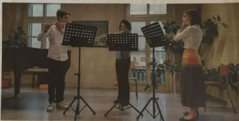
I saggi della scuola Musicainsieme sono iniziati sabato 20 maggio.

Anche Saluzzo attende i suoi giovani musicisti. Sabato 27, alle 15,30 e alle 16,15, al Quartiere (ex caserma Musso), a esibirsi sono gli allievi della scuola di Alto Perfezionamento Musicale. Sul palco saliranno le orchestre formate dagli allievi del progetto "Suono Anch'io", del corso Musica Maestro! "Suono Anch'io" è un percorso dedicato ai bambini che frequentano la scuola primaria a partire dalla terza elementare, che ha come scopo l'acquisizione delle competenze musicali di base attraverso la partecipazione collettiva, sia in piccoli gruppi divisi per strumento che all'interno di un'orchestra giovanile. Ingresso gratuito. Info su www.scuolaapm.it .