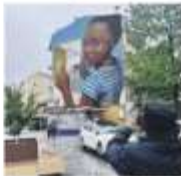
Uno dei murales della città.