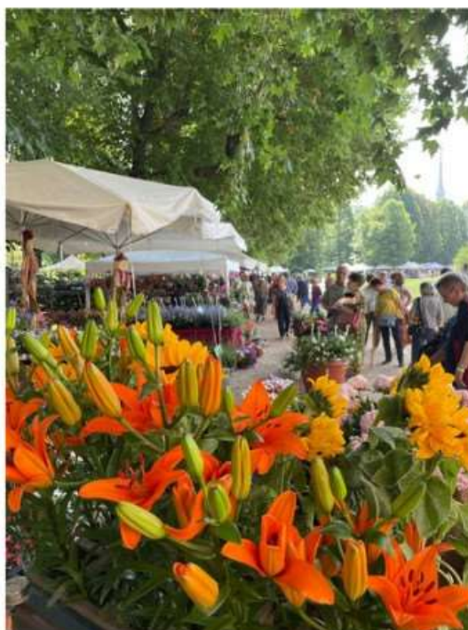
Torna con l'edizione 2023 la manifestazione di Flor

Oltre a Torino, coinvolte anche Chieri, Collegno, Moncalieri, Nichelino, Pino Torinese e Santena