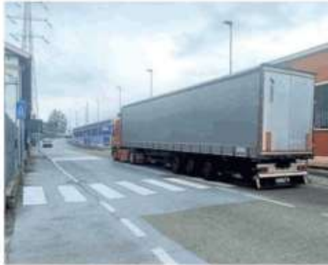
L'accesso al sovrappasso ferroviario di via Scarrone, a Nichelino

F a discutere l'ordinanza del Comune di Nichelino che vieta ad autotreni ed autoarticolati di transitare sul sovrappasso di via Scarrone da via Torino in direzione via Debourché. La decisione taglia la via più breve per raggiungere la tangenziale ai mezzi pesanti della vicina zona industriale Vernea. Lo stesso Comune, ormai 6 anni fa, aveva pubblicizzato l'area produttiva, con il progetto «Spazio Vernea», per attirare nuovi insediamenti e aziende. Se da una parte alcuni automobilisti si sono detti soddisfatti di non trovarsi più in mezzo ai Tir mentre si va a Mondojuve o in direzione tangenziale, dall'altra i vicini di casa di Nichelino non sono proprio così contenti. Vinovo