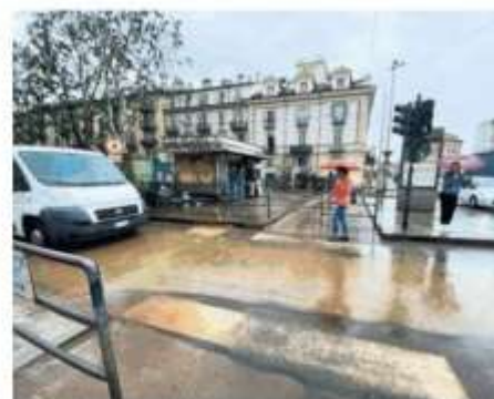
In città la pioggia non darà tregua fino a domani mattina