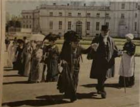
Domenica a Stupinigi dedicata alla moda di altri tempi