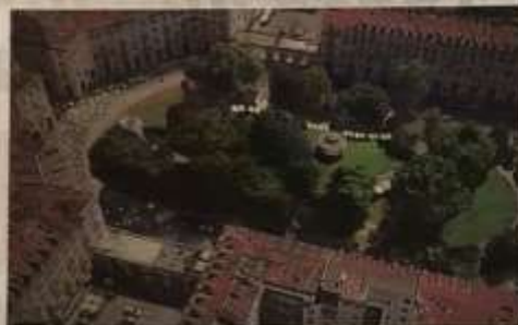
Il Giardino Sambahy visto dall'alto

giore parte a titolo gratuito, 3 castelli e i loro parchi visitabili per la manifestazione, 7 comuni interessati, oltre a Torino anche Chieri, Collegno, Moncalieri, Nichelino, Pino Torinese e Santena. Una manifestazione diffusa in alcuni tra i più affascinanti giardini, parchi e orti urbani; da quelli pubblici a quelli privati, da quelli già conosciuti dal grande pubblico, che saranno raccontati e vissuti in modo differente ed esclusivo, a quelli "segreti" e