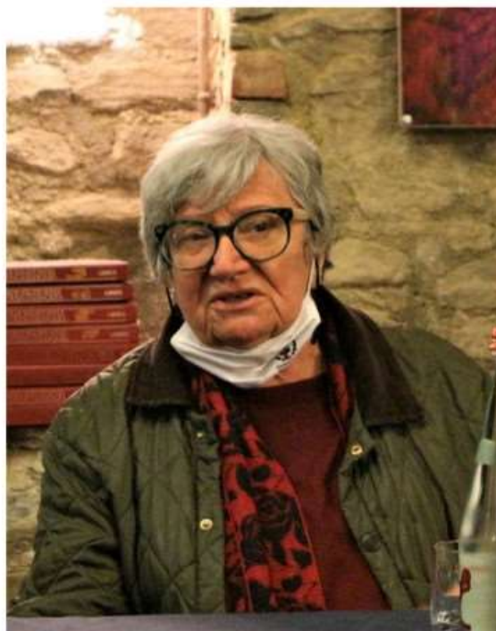
A Nichelino ultimi giorni di Festa del Libro e Salone Off

Il gran finale martedì 30 con Margherita Oggero. Il calendario degli eventi in programma