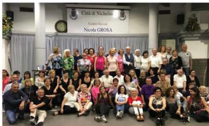
Nichelino, ancora una stagione di successi per il ballo di gruppo al centro Grosa

Mercoledì sera quasi 80 persone hanno preso parte alla penultima lezione del corso