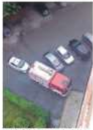
Vigili del Fuoco in via Cacciatori.

Posizioni debitorie sulle quali è consuetudine chiedere in prima battuta l'inter-