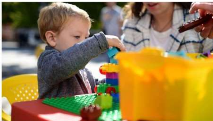
Nichelino, tutto pronto per la Festa di Primavera e la fiera del Mattoncino

Domenica 28 maggio appuntamento per grandi e piccini in piazza Di Vittorio: negozi aperti, raduno d'auto d'epoca e giochi interattivi