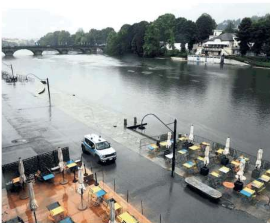
La Protezione civile ai Murazzi che sono stati chiusi ieri pomeriggio in via precauzionale dopo l'aumento del livello del fiume