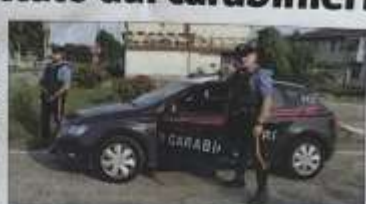
rendere conto alla giustizia. Il giovanissimo pusher in questione infatti, vent'anni appena, è stato denunciato alla pubblica autorità dai militari della locale stazione, che lo hanno colto in fallo durante una normale operazione di controllo, voluta proprio per garantire più sicurezza durante lo svolgimento della manifestazione che, in un modo o nell'altro, coinvolge gran parte dell'abitato della cittadina.

SANTENA - Abitando a Santena dove aver pensato che i giorni dedicati ai festeggiamenti per l'Asparago dovevano essere decisamente i migliori per fare affari. E così ha fatto, peccato che lui per «affari» intendeva lo smercio di stupefacenti, lo stesso per cui è stato pizzicato dai carabinieri e per il quale ora dovrà