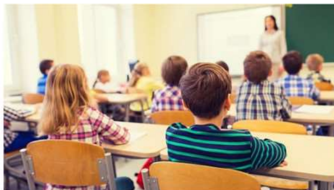
A Nichelino tutto pronto per "La città dei bambini e delle bambine"

Dal 22 maggio al via la seconda edizione di un appuntamento che raduna oltre 100 classi