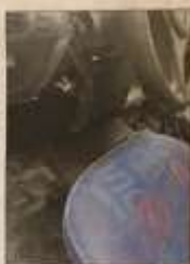
Nichelino - A prima vista poteva sembrare un atto vandalico, ma osservando bene le auto colpite nella notte tra sabato e domenica, a Nichelino, ci si accorge che chi le scassinava non lo ha fatto per rovinarle e basta, bensì per deprederle di determinate parti meccaniche o elettroniche. Insomma, il raid di sabato notte nella zona del quartiere Boschetto non è altro che l'ennesimo colpo dei cannibali di auto, ovvero coloro che asportano solamente ciò che gli è stato richiesto dal mercato nero dei ricambi. Un sistema di "erfurtamento" senza scrupoli, che, come ormai da anni a questa parte, viene effettuato a spese degli automobilisti che lasciano il proprio veicolo in sosta per la notte in strada. Un incubo che un tempo vedeva prese di mira solo le ruote e i relativi cerchi, ma che con il tempo si è evoluto vedendo questi ladri specializzati effettuare veri e propri smontaggi da professionisti per asportare componenti di carrozzeria, come cofani, sportelli o pannello, oppure navigazioni, impianti stereo, catalizzatori e quant'altro è destinato a finire in officine concorrenti. Un mondo oscuro su cui i carabinieri indagano da tempo, visto il periodico ripetersi del fenomeno e che in passato aveva anche por-

è rimasto incastrato a seguito della caduta accidentale. Ovviamente i primi a prestargli soccorso sono stati i suoi colleghi, ma nonostante la loro buona volontà hanno capito che solo i vigili del fuoco lo avrebbero potuto estrarre da quella trappola di metallo. Ma per tutto il tempo dei soccorsi, comunque, nonché durante il trasporto, l'uomo è sempre rimasto cosciente.