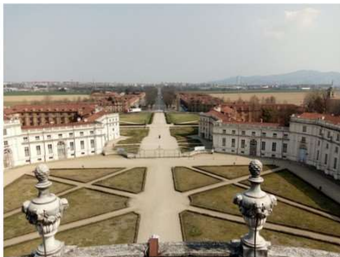
A Stupinigi il convegno "Progetto come stimolo economico: Pnrr, Fesr e concorsi di architettura"

Appuntamento venerdì 26 maggio, a partire dalle 10, presso la Palazzina di Caccia