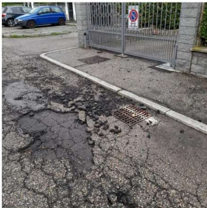
Nichelino, via Pateri è tutta una buca. Cede tratto di strada Castelvechio a Moncalieri

La via di Nichelino assomiglia ad una groviera, nella strada collinare di Moncalieri stop ai camion sopra le 3,5 tonnellate per ragioni di sicurezza