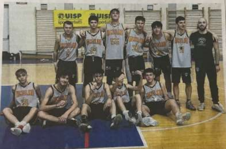
Titolo regionale under 18 e serie D per Pallacanestro Nichelino.