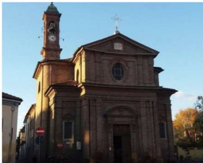
Con il "Music School Festival" diventano protagonisti gli istituti musicali di Nichelino

Dal 23 al 27 maggio i concerti ospitati nella Chiesa Antica di SS. Trinità di piazza Di Vittorio