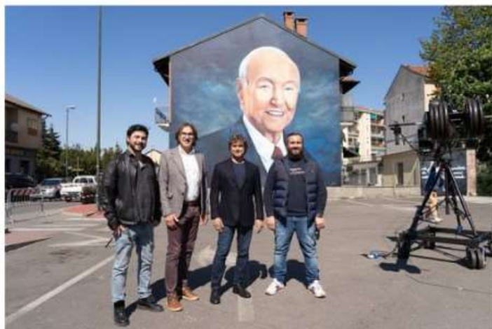
Nichelino (con il murales dedicato a Piero Angela) finisce in prima serata su Rai Uno

Il figlio Alberto è venuto a registrare diversi minuti dello speciale Ulisse dedicato al padre che andrà in onda domani sera