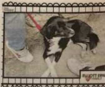
Alcune immagini del contest "My family" organizzato in occasione della mostra di Elliott Erwitt, "Family", in corso fino all'11 giugno alla Palazzina di Caccia di Stupinigi