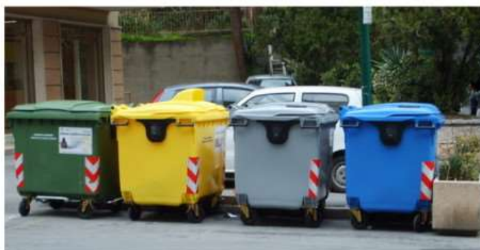
Rifiuti, al Covar in arrivo 4 milioni di fondi Pnrr: Moncalieri e Nichelino i maggiori beneficiari