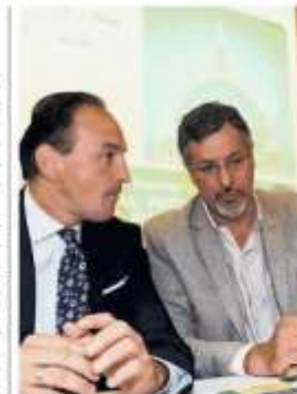
▲ Al timone

La Regione promette la costruzione di tanti nuovi ospedali e l'opposizione insorge, subodorando la “annunciate” da anno pre-elettorale. I progetti sono tanti e ambiziosi, e gli iter in parte sono già stati avviati: la scorsa settimana l'approvazione a Palazzo Civico del protocollo di intesa per Torino Nord (zona luna park alla Pellerina), circa 550 posti letto e almeno 185 milioni che verranno anticipati dall'Inail, mentre una ventina di giorni fa è stata individuata l'a-