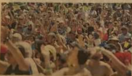
Dall'alto in senso orario: Emis Killa, 199 Posse e il concerto di Elisa per Suoni dal Monviso nel 2022.

Dallo Stupinigi Sonic Park a Suoni dal Monviso, ecco i big sul palco a luglio