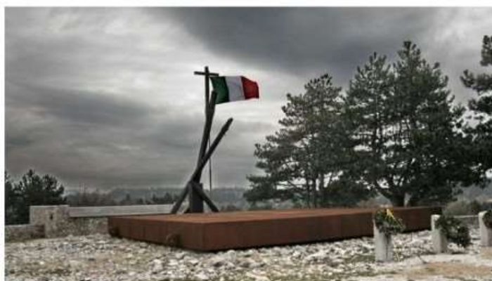
Nichelino, in partenza i giovani del "Viaggio al Confine Orientale"

Da domani, giovedì 6, a domenica 9 aprile una tre giorni per far conoscere alle giovani generazioni i luoghi simbolo dell'esodo istriano