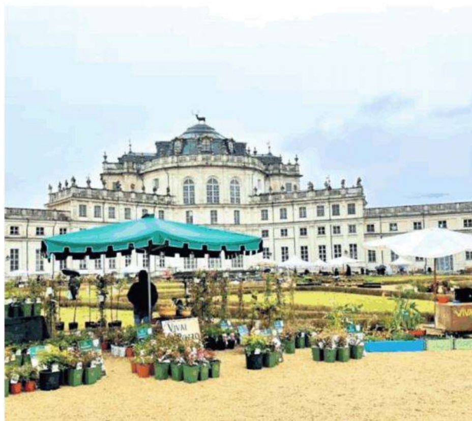
A Stupinigi una vasta area dedicata al giardinaggio, ma anche una zona food con produttori artigianali

lizzazione di "terrari" (la nuova moda dei mini giardini fatti a mano costituiti da piccoli paesaggi racchiusi in contenitori di vetro) e Viridarium Flower Farm, gruppo di artigiani che realizza mazzi di fiori recisi e composizioni floreali. Chiunque potrà perdersi in un turbinio di rose, orchidee, bonsai e tanto altro. Specie perenni, graminacee e anche carnivore. Anteprima Floreal vivrà anche di cultura e formazione del verde con Flor Academy: incontri, laboratori e dibattiti a tema green, per conoscere più da vicino segreti e curiosità su