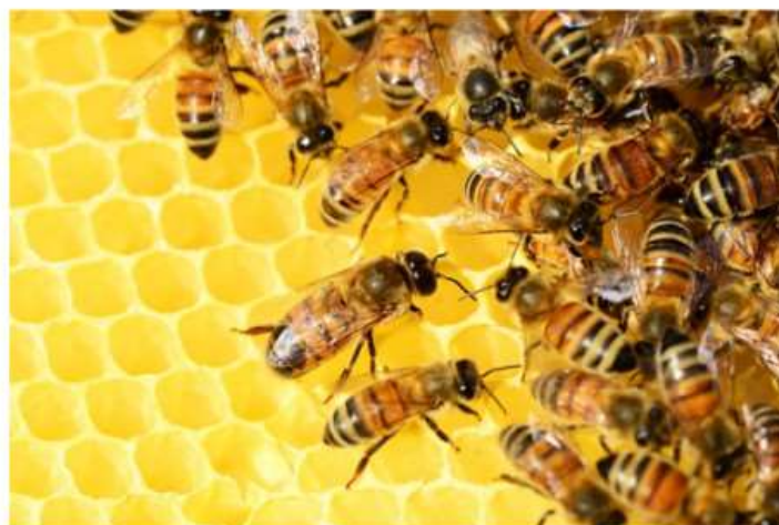
Innovativo progetto al Maxwell di Nichelino: le api (bio)monitorano la qualità dell'aria

Saranno gli studenti dell'istituto, non studiosi o ricercatori, a dire come sta l'ambiente