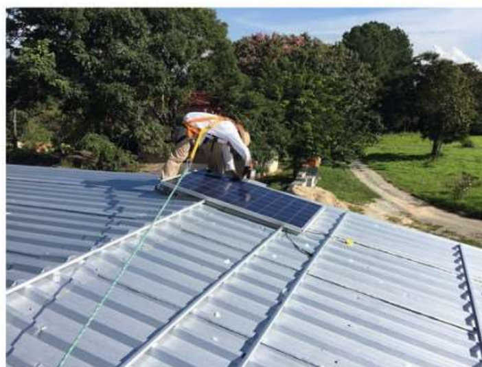
A Nichelino e Moncalieri nasce Attiva.CER, il Comitato Promotore di una comunità energetica rinnovabile

L'intento è quello di trovare privati e operatori economici che possiedono tetti o superfici di dimensioni significative per organizzarli in rete e fare in modo di arrivare ad una significativa riduzione della bolletta energetica