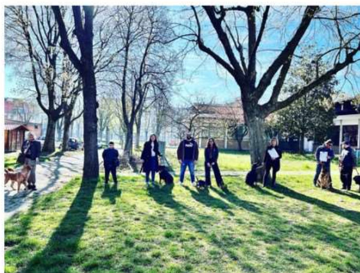
Nichelino si conferma comune amico dei cani

L'Amministrazione mette a disposizione 100 posti per il test per la leishmaniosi, con tanto di visita veterinaria gratuita, per i cani iscritti all'apposita anagrafe regionale i cui proprietari sono residenti in città