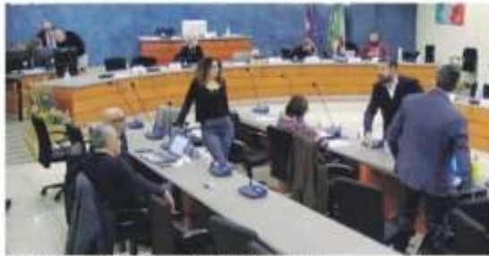
Conciliazione al Consiglio comunale dello scorso 30 marzo.