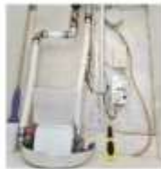
Una delle valvole.

Le testimonianze parlano di case al freddo per l'arrivo discontinuo dell'acqua nei termosifoni, alla cui origine ci sarebbero alcune perdite nell'impianto generale. Perdite che costringono gli assegnatari ad agire con un cacciatife sulle valvole di distribuzione dei singoli appartamenti, per liberare le tubazioni dell'aria in eccesso. D'altra parte gli edifici (interni 3, 7, 9 e 11) risalgono alla prima metà degli anni Settanta e sono stati concepiti con impianti indipendenti; una trentina di anni fa, gli impianti vennero forzatamente adattati con un passaggio al riscaldamento centralizzato con, dal 2018, distribuzione dell'acqua