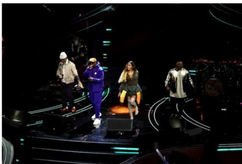
I Black Eyed Peas protagonisti della nuova edizione del Sonic Park

Appuntamento la sera del 13 luglio sul palco della Palazzina di Caccia