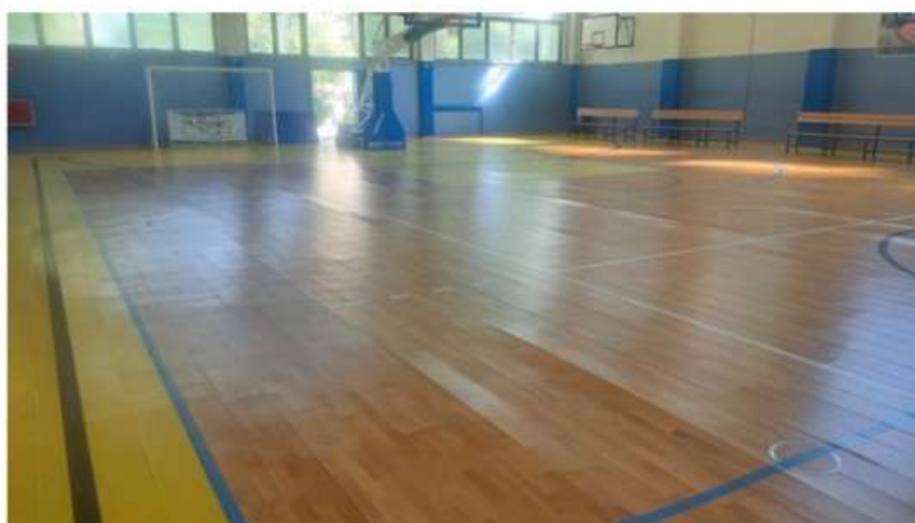
Nichelino, riapre dopo sei mesi la palestra della scuola Gramsci