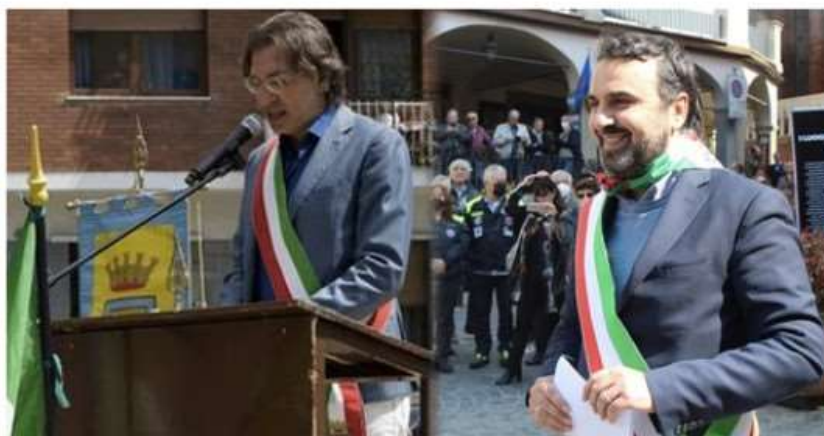
Bonaccini stravinisce a Nichelino, Moncalieri per la Schlein, ma Tolardo e Montagna aprono al nuovo corso Pd

Entrambi i sindaci erano schierati con il governatore dell'Emilia: "Grazie per aver dato voce agli amministratori locali, da oggi al lavoro tutti insieme per ricostruire il Partito Democratico"