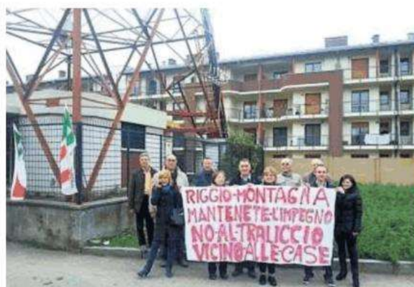
L'impianto contestato potrebbe traslocare sul territorio di Nichelino