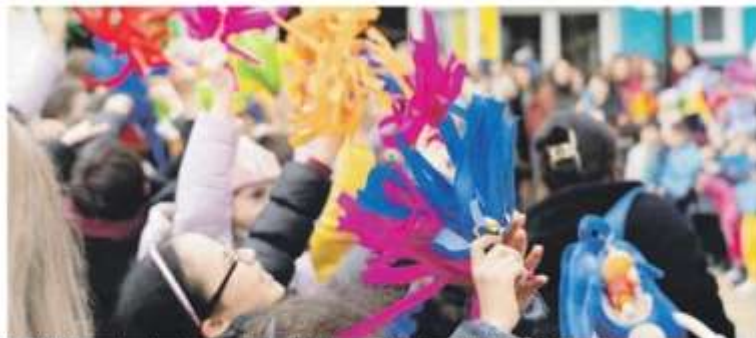
Bimbi in festa per la riapertura, dopo tre anni, della scuola dell'infanzia "Collodi", in via Cacciatori.