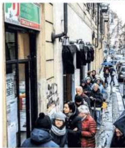
ALBERTO SACCHINI - REPORTAGE