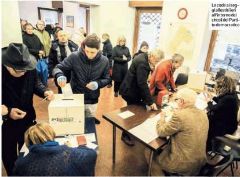
Le code ai seggi allestiti ieri all'interno del circolo del Partito democratico

Che succederà adesso? Lo Russo non commenta i risultati di Torino ma ieri mattina dopo il voto si era detto convinto che «qualunque sarà il risultato del voto il nostro compito è quello di rimetterci imme-