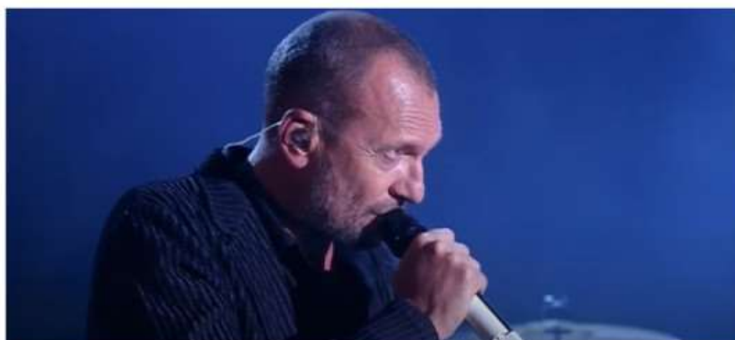
Sonic Park arruola un altro big della musica italiana: il 7 luglio arriva Biagio Antonacci

Per lui un ritorno in tournée dopo quasi quindici anni