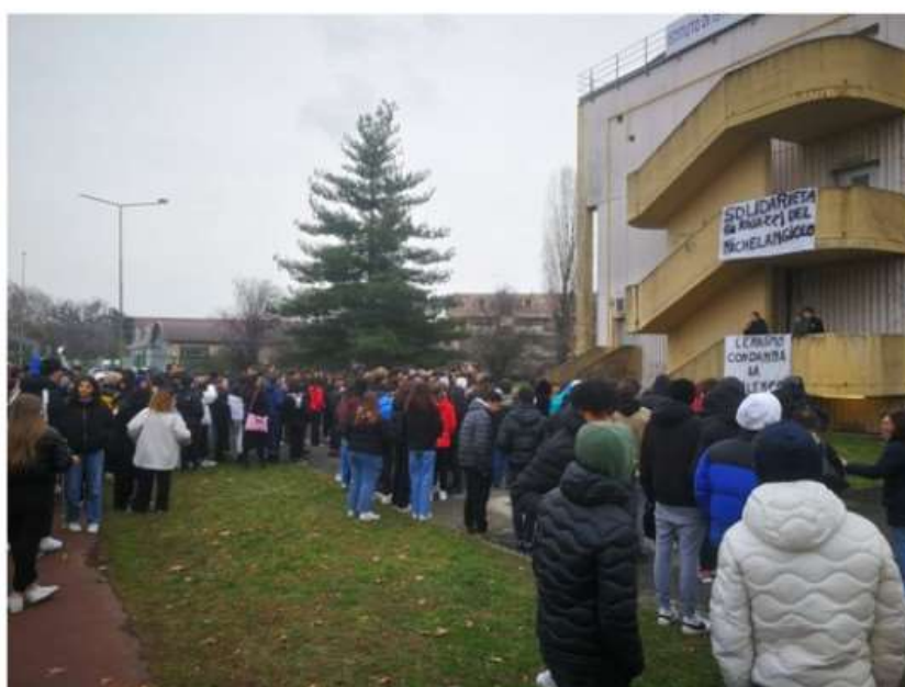
Nichelino, gli allievi dell'Erasmus solidarizzano con gli studenti di Firenze: "Basta con le violenze fasciste"