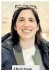
Elly Schlein, parlamentare del Pd, ha doppiato il rivale

Tra le curiosità della giornata elettorale di ieri la partecipazione al voto della signora Francesca che ha 101 anni ha depositato la sua scheda nel seggio ospitato a casa Garibaldi in San Salvario.