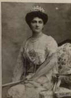
Elena di Montenegro, seconda Regina d'Italia, a cui la Palazzina di Caccia di Stupinigi dedica una mostra

Quinta figlia femmina dei 12 figli del fondatore del Regno del Montenegro, Elena conobbe il Principe Vittorio Emanuele al teatro La Fenice di Venezia. Le nozze sono celebrate il 24 ottobre del 1896 a Roma, in forma civile al Quirinale e in forma religiosa nella Basilica di Santa Maria degli Angeli. Elena, originariamente di fede ortodossa, si convertì quindi al cattolicesimo. Appassionata di caccia ma soprattutto di pesca, nella splendida cornice di Valhite si dedicava a gareggiare