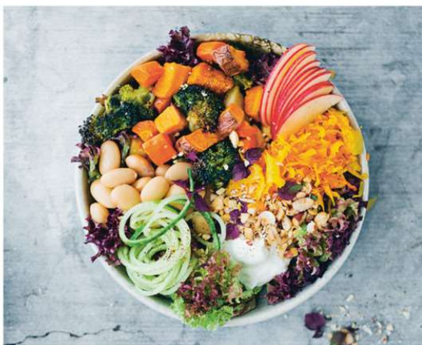
MenSana, a Nichelino due incontri formativi per combattere lo spreco alimentare

Appuntamento all'Open Factory il 10 e 17 marzo