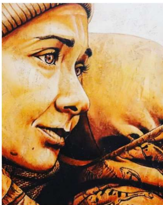
"In fuga da Nazareth": la mostra di Ungarelli diventa uno spettacolo teatrale

Appuntamento il 31 marzo al teatro Superga di Nichelino. Verzola: "Metà del ricavato della vendita destinato alle famiglie dei migranti"