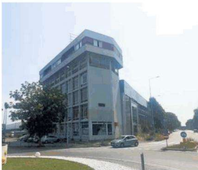
L'ex Rosa dei mobili di Rivalta, finito nel mirino dell'imprenditore

Il commerciante, secondo la ricostruzione degli inquirenti, si ingraziava carabinieri e funzionari di alcuni Comuni della cintura To-