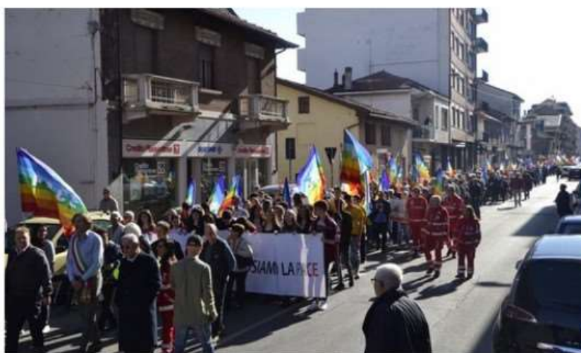
A Nichelino ritorna l'appuntamento con la Marcia della Pace

Sabato 18 marzo, con ritrovo da piazza Aldo Moro e arrivo in piazza Di Vittorio