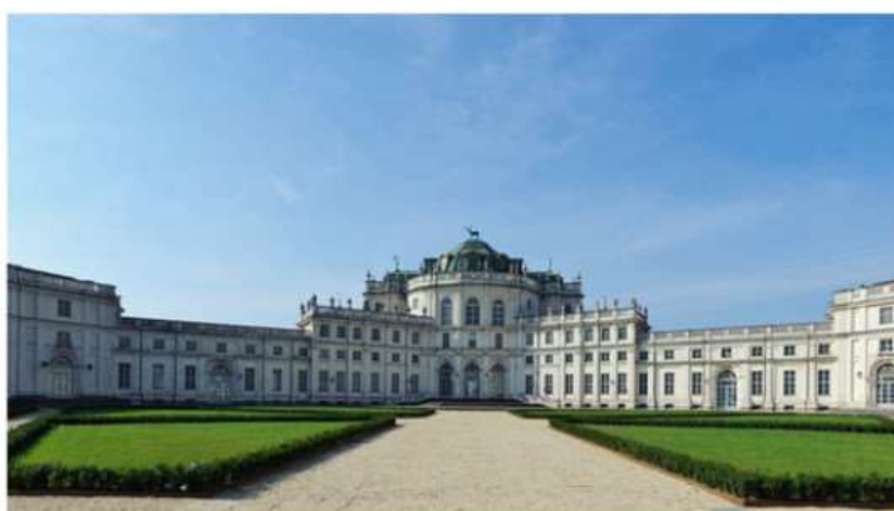
La Palazzina di Stupinigi punta a crescere ancora

La modifica alla viabilità grazie alla fine dei lavori (luglio 2023) della bretella di Borgaretto. Nasce anche una cabina di regia per concordare lo sviluppo dell'area