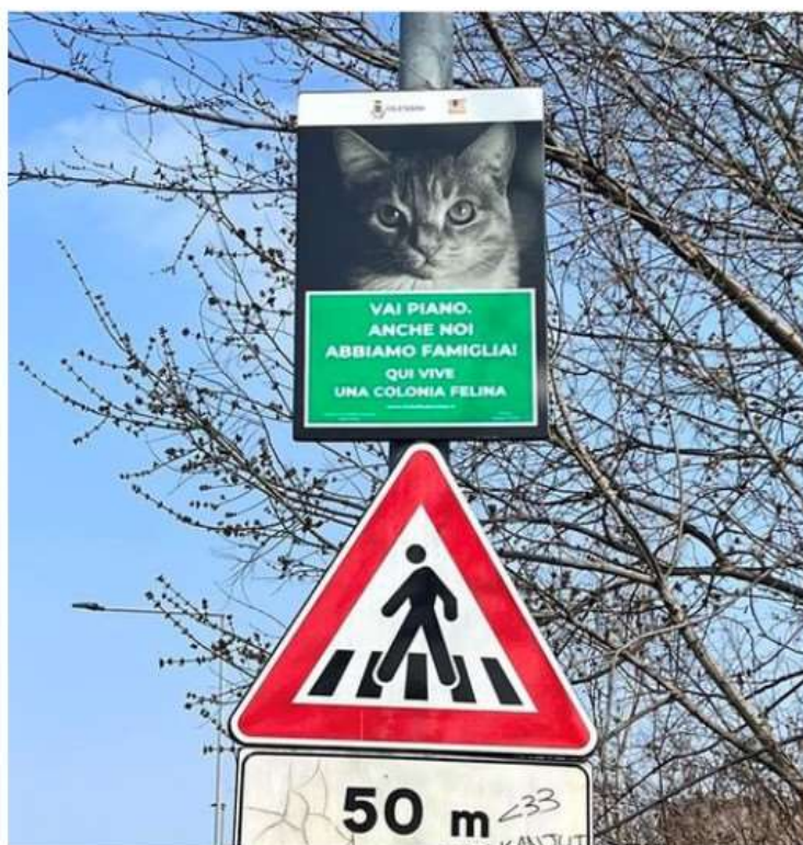
A Nichelino cartelli stradali per salvaguardare le colonie feline