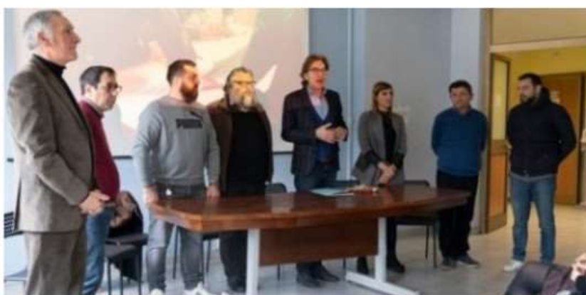
Nichelino, lo Sportello al Lavoro fa incontrare aziende e giovani in cerca di occupazione

Il nuovo servizio offerto dall'Engim per far incrociare domanda e offerta di lavoro