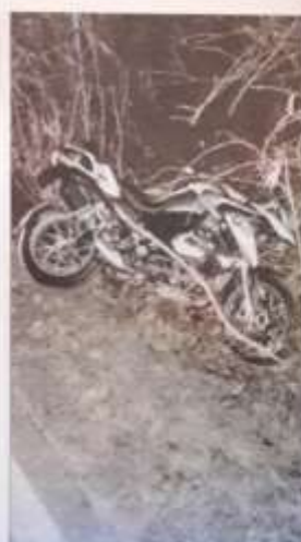
L'albero crollato in strada Maddalena e la moto sinistrata