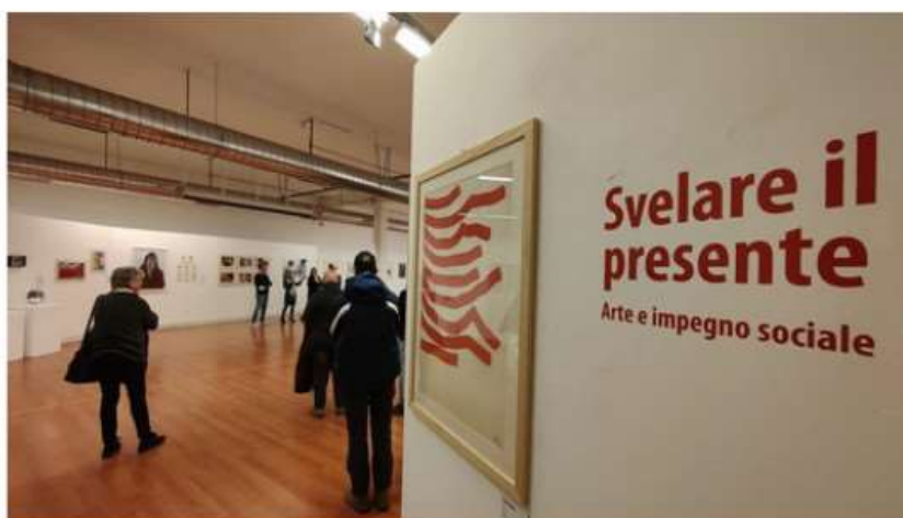
A Nichelino la mostra della Cgil "Svelare il presente: arte e impegno sociale"

L'apertura al pubblico dal 20 al 31 marzo nella Sala Mattei del Palazzo Comunale