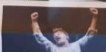
In alto: "Possiamo salvare il mondo prima di cena", a Piossasco sabato 18. A sinistra "Funeral home", a Pinerolo giovedì 16. A destra "Italia-Brasile 3-2" a Nichelino venerdì 17.

luggione con visibilità ridotta, 10 euro, ridotto 5. Prevedibile all'Ufficio del turismo mar-sab 9-14. Info al n. 0121.795.548.