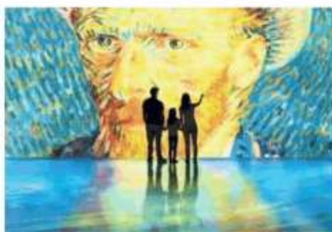
Un'immagine della mostra «Van Gogh Experience»

Il percorso inizia con la conoscenza della vita del pittore olandese, con la sua timeline, per far emergere i fatti privati più salienti che hanno influenzato successivamente la sua arte. Poi si entra nel vivo della rappresentazione: in un'area di oltre 200 metri quadrati ogni superficie si anima e avvolge il visitatore in un viaggio a tinte scure, fatto di pathos e drammaticità, per comprendere il tormento interiore e gli stati d'animo