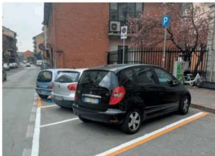
I parcheggi a strisce rosa sotto il Municipio sostituiti con le strisce bianche

Il posteggio sotto palazzo civico, di fronte all'ingresso della polizia locale, è però