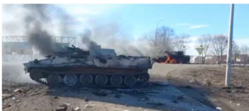
Ucraina, a Nichelino una serata-dibattito ad un anno dall'inizio del conflitto

Appuntamento il 17 febbraio, alle ore 20.45, presso l'auditorium della Croce Rossa in via Damiano Chiesa