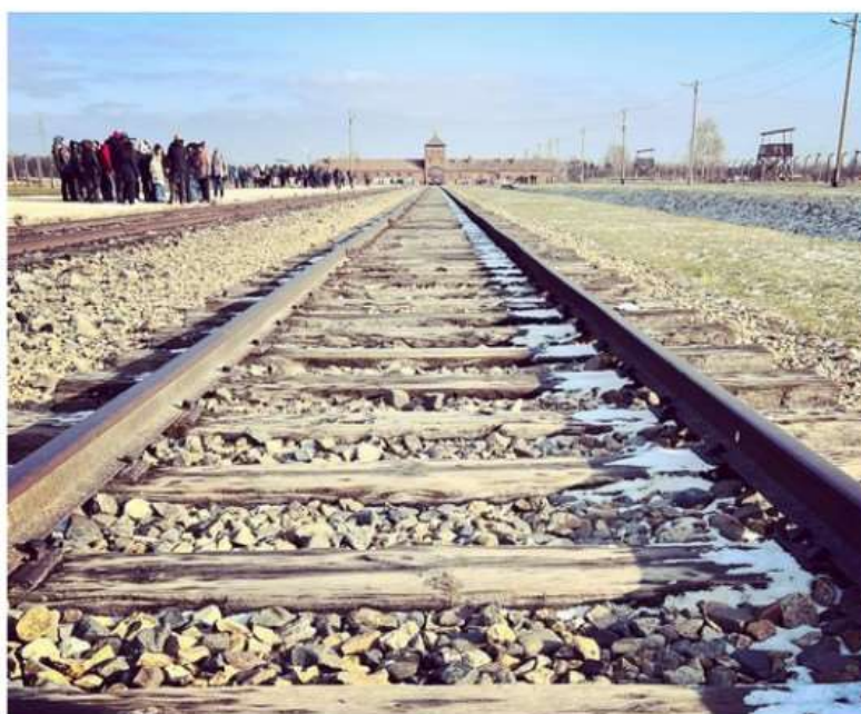
Nichelino, concluso il viaggio del Treno della Memoria