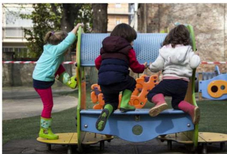
Nichelino prepara la rivoluzione: asili aperti anche sabato mattina

Dopo l'esperimento fatto alla 'Cacciatori', con il mese di febbraio si vara la novità. Azzolina: "Conciliare le esigenze del lavoro con quelle dei bambini"