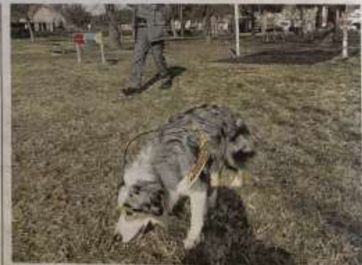
La cagnolina Myrtille durante il controllo a Nichelino