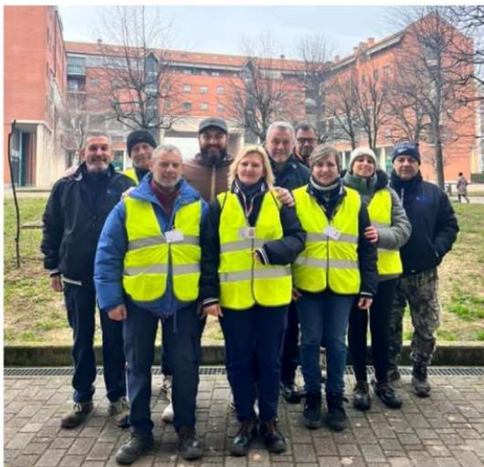
Tornano a Nichelino i Progetti di Pubblica Utilità: ripuliti viali e vialetti da foglie e sporcizia