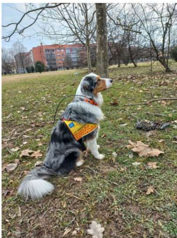
A Nichelino il fiuto di Myrtille per prevenire l'avvelenamento dei cani con bocconi killer

L'unità cinofila della Polizia locale della Città metropolitana ha consentito di ispezionare e mettere in sicurezza il Giardino dei Giusti dove, pochi giorni prima, una cagnetta era rimasta vittima di un boccone avvelenato