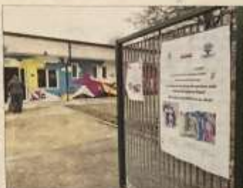
Isolazioni ispirate alla favola di Pinocchio di Collodi. Era da troppo tempo che il quartiere Bochetto, le famiglie e i bambini attendevano questa bella notizia, che oggi è finalmente arrivata.

NICHELINO - Dopo tre anni di chiusura, riapre la scuola dell'infanzia Collodi di via Cacciatori. Domani, giovedì 23 febbraio, bambini, famiglie e tutto il quartiere sono invitati alla festa che, alle ore 16, taglierà il nastro al nuovo asilo. Una riapertura attesa. Dopo alcune avvisaglie - strani avvalimenti in un soffitto - la scuola era stata chiusa definitivamente nel novembre 2019. Bambini e insegnanti erano stati trasferiti nella vicina elementare Gramsci, dove al primo piano erano state ricavate aule e adeguati gli spazi alle esigenze dei più piccoli. Un trasferimento che non aveva mancato di sollevare le proteste dei genitori, seccati dal protrarsi della sistemazione provvisoria andata avanti fino ad ora.