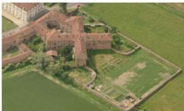
40 studenti progettano rinascita del canile abbandonato del concentrico di Stupinigi

Elaborate idee e proposte per la valorizzazione dell'area, da tempo in disuso