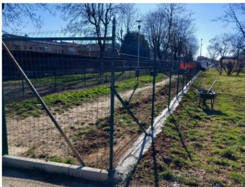
Aree cani, a Nichelino iniziato progetto di manutenzione ordinaria