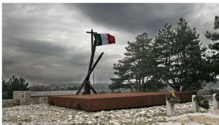
Nichelino propone un viaggio tra Venezia Giulia e Croazia per far conoscere la storia delle Foibe

Per iscriversi c'è tempo fino al 22 febbraio. Chi può partecipare e come