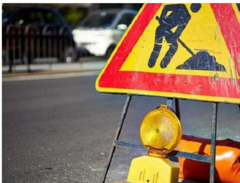
Lavori in corso a Nichelino, da domani strade chiuse e deviazioni

Dal 20 febbraio al 6 aprile tra via Ponchielli e via I Maggio cambierà la circolazione