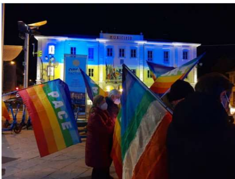
Ucraina, ad un anno dal conflitto Nichelino scende in piazza per chiedere la pace

In programma una fiaccolata venerdì 24, a partire dalle ore 18.30