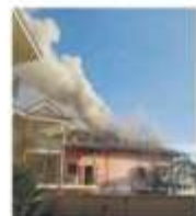
Fumo da via Primo Maggio.

CANDIOLO Venerdì 17 grave incendio nel centro cittadino, divampato, sembrerebbe dalla canna fumaria, ha coinvolto l'ultimo piano di una villetta bifamiliare in via Primo Maggio, all'incrocio con via Europa. Sul posto sono intervenute diverse squadre di pompieri, arrivate da Chieri, Rivara, Carmagnola, Lingone e dal distaccamento di Pinoalo. Ad esse si sono aggiunti anche i colleghi della centrale di corso Regina Margherita e i carabinieri della compagnia di Moncalieri. La colonna di