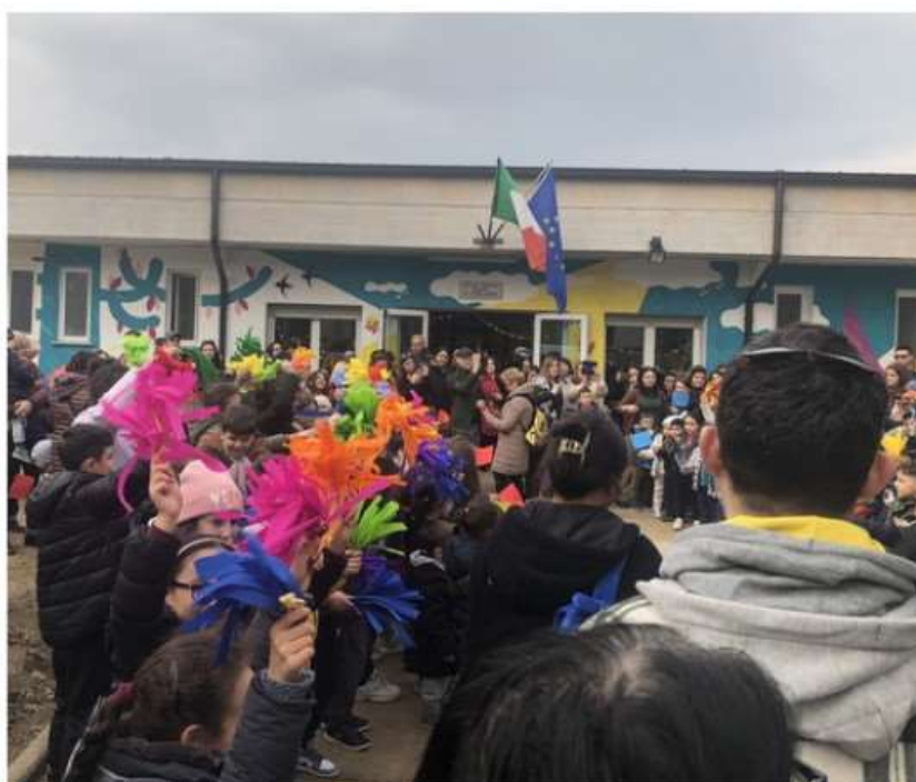
Nichelino, riqualificata e riaperta dopo due anni la scuola d'infanzia Collodi

Con un investimento di mezzo milione di euro restituito alla Città l'asilo che era stato chiuso nel 2020. Il tutto a poche ore dalla denuncia dei responsabili dei vandalismi di Capodanno