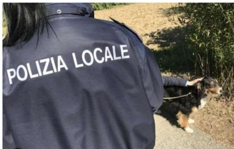
Nichelino, la Polizia locale multa i padroni 'distratti' di tre cani

Portavano a spasso gli animali senza il guinzaglio