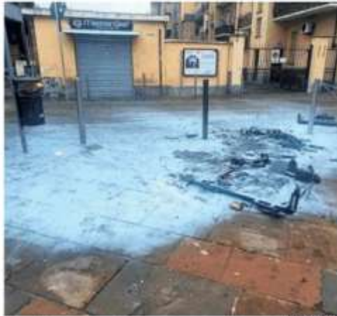
Alcuni dei segni rimasti il giorno successivo al blitz della baby gang

re per aria un cassonetto dei rifiuti con un mix di petardi ad alto potenziale, a dare fuoco ad una parte dell'albero di Natale cucito a mano da un'associazione di volontarie e devastare altri arredi della piazza centrale della città. Si era anche messa davanti ad un autobus della linea 35, sotto il municipio, bloccando la marcia con lo scoppio di altri botti. All'interno c'erano pas-