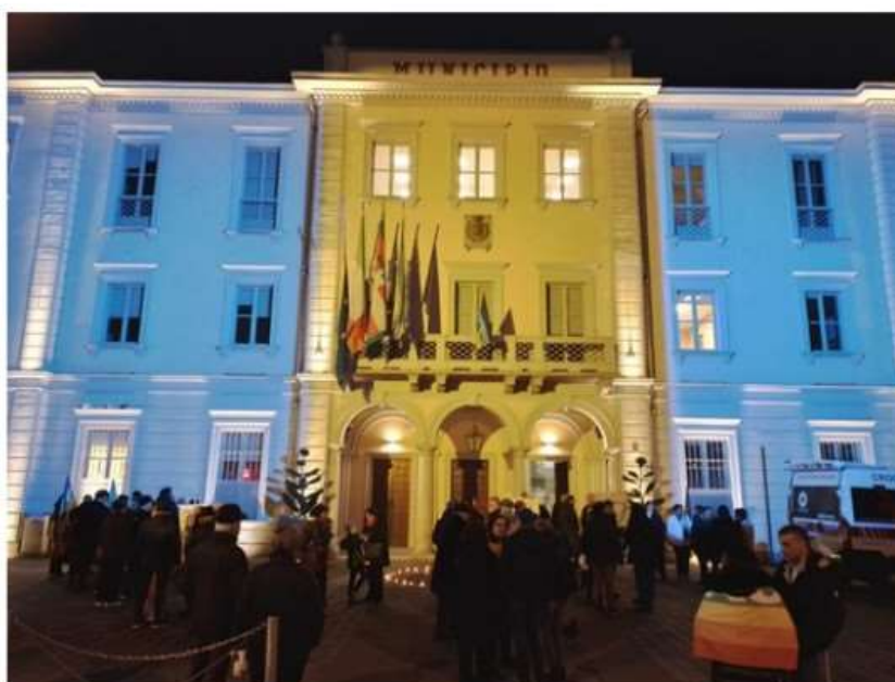
Ucraina, Nichelino scende in piazza per la pace: "Subito il cessate le armi"

Un centinaio di persone presenti di fronte al Municipio alla fiaccolata per dire no alla guerra. Azzolina: "L'Europa intervenga". Cera: "Non normalizziamo una situazione che normale non è"