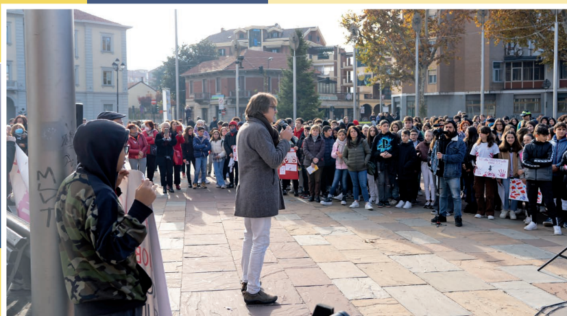
25 novembre Giornata Internazionale per l'eliminazione della violenza contro le donne