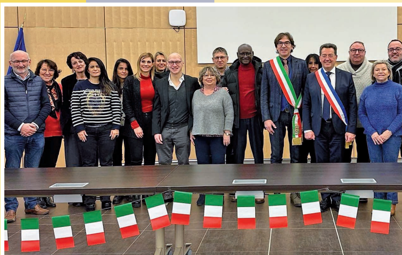
Incontro Caluire et Cuire dicembre 2022