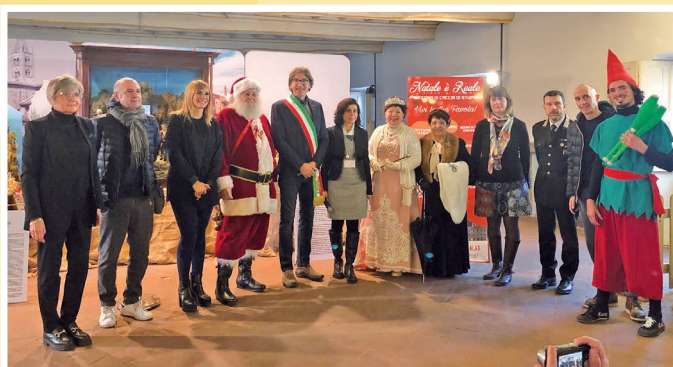
Natale è Reale