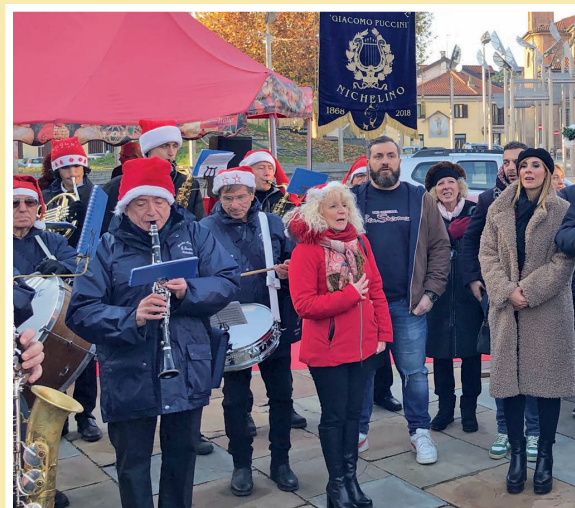
La magia del Natale

Dal 6 al 10 dicembre una settimana italo – francese a Caluire et Cuire , cittadina nei pressi di Lione gemellata con Nichelino, ha visto rafforzati ulteriormente i legami e le progettualità in essere.