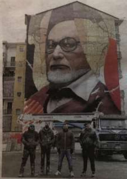
Assessore e artisti davanti al murales

Si valuta uno scorcio, si sceglie il muro adatto, si chiedono i permessi. Il resto è arte. La si è vista con il grande murales dedicato al papà della divulgazione scientifica, Piero Angela. La si vedrà nuovamente - tra via Ponchielli e via I Maggio - con l'opera muraria dedicata a Primo Levi, scrittore, chimico, intellettuale che visse sulla sua pelle l'orrore dell'Olocausto nel campo di concentramento di Auschwitz. Inaugurazione prevista per il 1° febbraio.