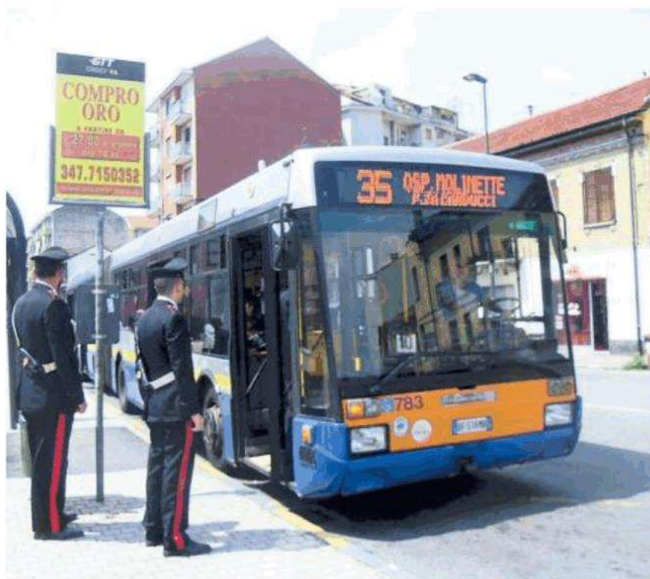
Sono sempre più frequenti le richieste di intervento a bordo dei mezzi pubblici

I militari, con l'avvio di una serie di controlli mirati, stanno cercando da una parte di risalire alla baby gang che a capodanno ha messo a ferro e fuoco piazza Di Vittorio, la principale della città di fronte al municipio. Dall'altra di riportare un po' di tranquillità sui mezzi pubblici dopo le nutrite proteste degli autisti. Diverse le segnalazioni di tensione generate proprio da branchi di giovanissimi. Altra linea sotto osservazione è la navetta 35, quella che collega Nichelino con il centro commerciale di Mondojuve. In alcune occasioni, soprattutto duran-