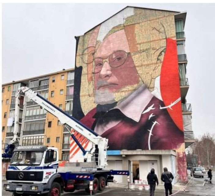
Dopo Piero Angela, Nichelino dedica un murales a Primo Levi

I lavori fervono in via Ponchielli: inaugurazione il 1° febbraio, giorno in cui partirà il Treno della Memoria con destinazione Auschwitz