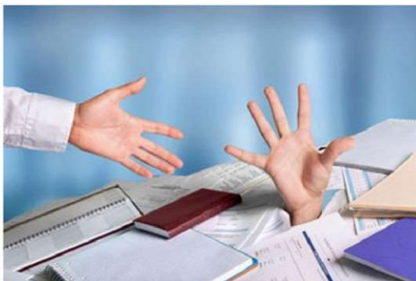
Nichelino insieme a Città metropolitana nella gestione sportello contro il sovraindebitamento