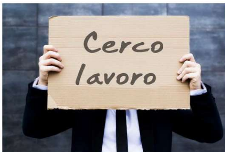
Con il progetto "On track" Nichelino va in aiuto dei giovani disoccupati

L'iniziativa, rivolta a chi ha tra i 20 e i 35 anni, propone di migliorare le proprie competenze digitali e tecnologiche partecipando ad un corso di 100 ore presso l'Informagiovani di Nichelino