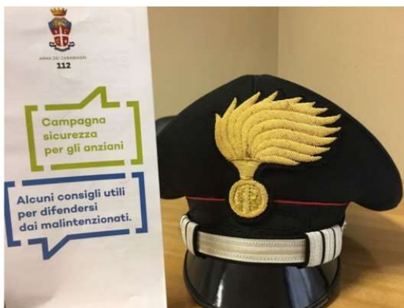
Come difendersi dalle truffe: a Nichelino riprendono gli incontri per aiutare gli anziani

Prossimo appuntamento lunedì 30 gennaio al Quartiere Juvarra