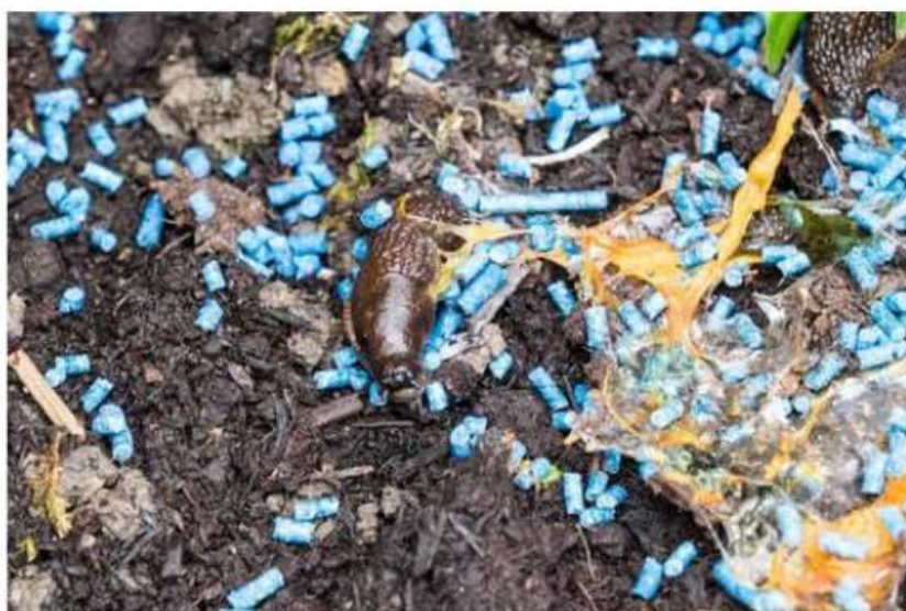
Allarme bocconi killer a Nichelino, morta una cagnolina

Il fatto successo nel parco nei pressi della parrocchia Madonna della Fiducia. Indaga la Polizia locale