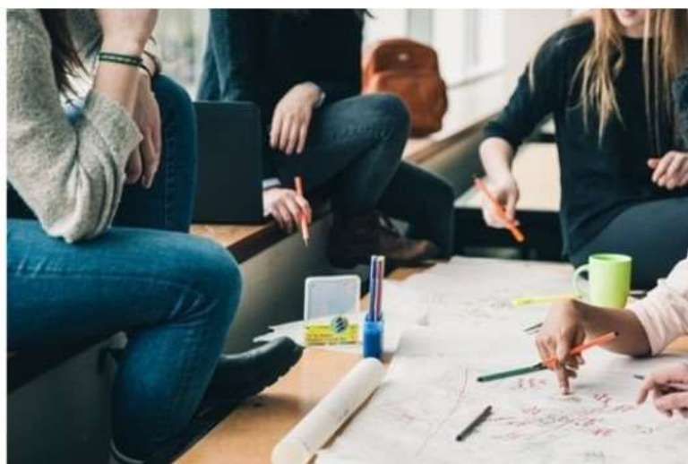
Nichelino, Servizio civile alla biblioteca Arpino e all'Informagiovani

Aperto il bando: per candidarsi c'è tempo fino al 10 febbraio. Ecco come