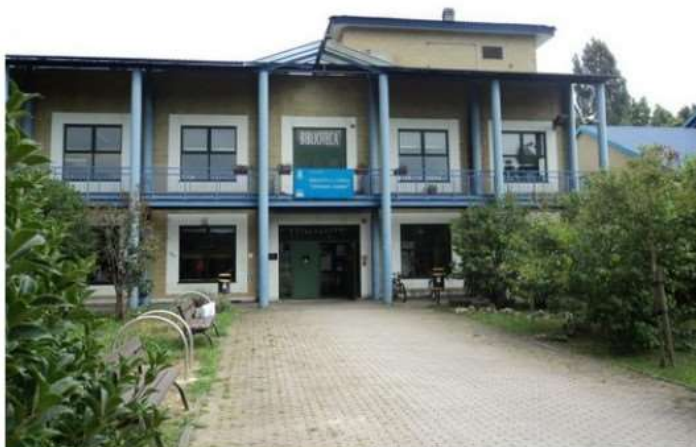
Giorno della Memoria, Nichelino organizza una settimana di eventi e iniziative

Si comincia domani, sabato 21 gennaio, con l'incontro "Custodiamo la Memoria – Letture per ricordare oggi" alla biblioteca civica Arpino