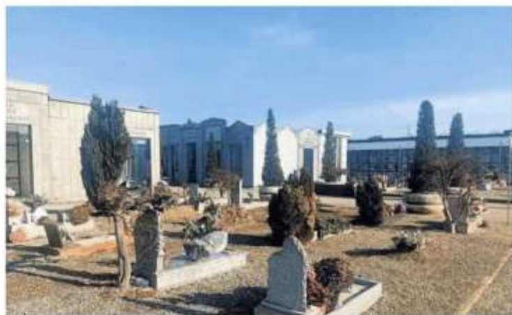
L'episodio è avvenuto al cimitero di Nichelino, la coop che gestisce l'appalto ha ammesso le responsabilità

municarlo preventivamente al Comune, in modo che lo scavo della fossa sia adeguato e pronto per appoggiare la bara senza problemi. Non era questo il caso, visto che si trattava di una situazione «classica». La fossa era stata scavata nel modo sbagliato: troppo corta in lunghezza, di alcuni centimetri. Una cosa recuperabile, se non fosse capitato altro mentre si cercava di aggiustare la situazione: «La persona che doveva usare l'escavatore si è ammalata e così la cooperativa ha deciso di spostare lì altri addetti che erano già presenti nel cimitero per un altro funerale - spiega l'assessore Bonino -. Il problema è che non solo nessuno di loro pote-