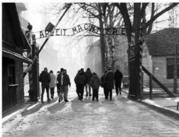
Nichelino, iniziato il conto alla rovescia per la partenza del Treno della Memoria

Partiti i laboratori di avvicinamento, che hanno visto l'entusiastica partecipazione di decine di ragazzi. Verzola: "Giovani sognatori e viaggiatori"