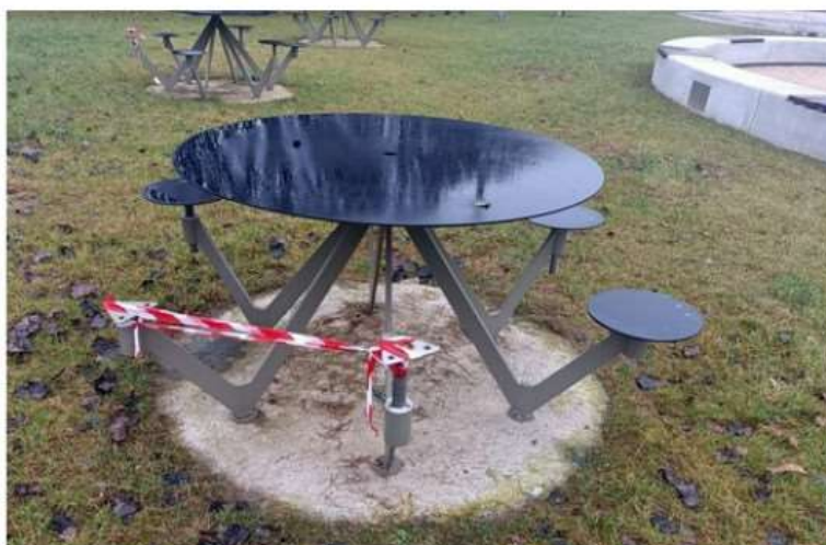
Vandali ancora in azione a Nichelino, rovinati gli sgabelli in piazza Aldo Moro

Le immagini delle telecamere di zona potrebbero risultare utili per risalire agli autori del gesto