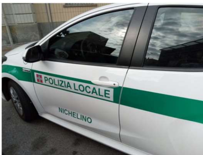
Nichelino, più agenti sulle strade e maggiori controlli della Polizia locale

La decisione dopo i recenti episodi di vandalismo. Il comandante Goduti: "Noi faremo la nostra parte ma serve la collaborazione dei cittadini"