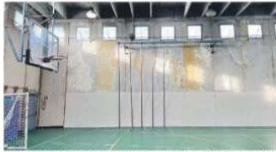
La palestra dell'E. da Rotterdam, oggetto di numerose segnalazioni in Città Metropolitana.

L'attesa di interventi e i solleciti della stessa dirigente, a detta degli studenti, sarebbero stati ignorati e ora, dopo che anche il promesso ripristino degli infissi nel seminterrato non è stato effettuato, la scuola ha deciso di manifestare il proprio disagio pubblicamente. Lo scorso 13 gennaio i ragazzi riuniti in assemblea hanno deliberato una richiesta di convocazione straordinaria del Consiglio di Istituto, accolto dall'organo che a questo punto ha facilitato la formalizzazione di un vero e pro-