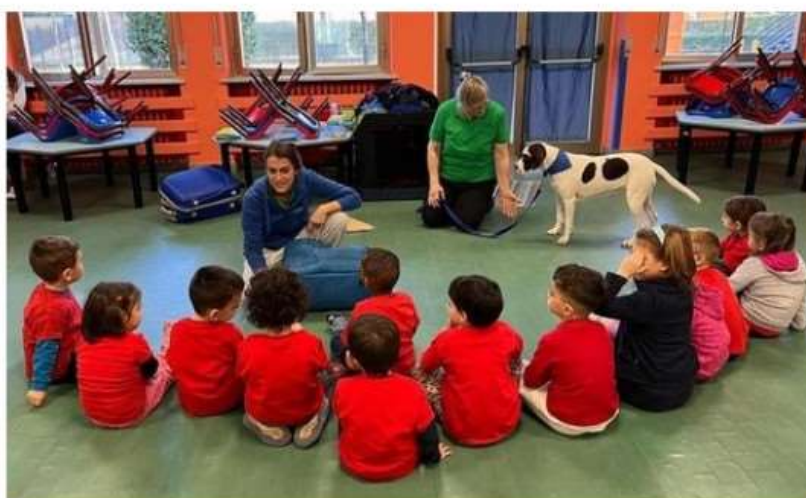
Dopo tre anni di stop, riprende la pet therapy nelle scuole di Nichelino

L'emergenza Covid aveva costretto ad un forzato stop, i bambini hanno ricominciato gli incontri con gli amici a quattro zampe: primo incontro alla materna Andersen