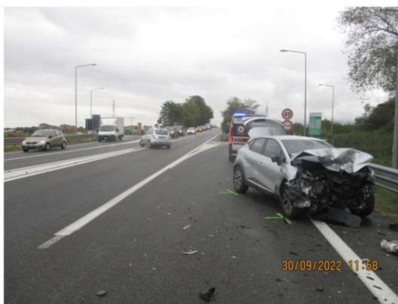
Nichelino fa la conta dei danni: 520 incidenti stradali in tre anni