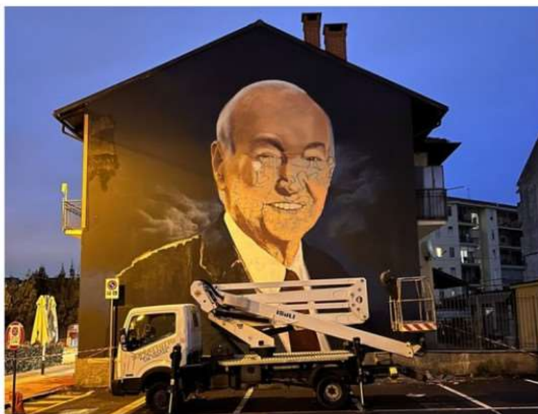
Nichelino omaggia la memoria di Piero Angela con un enorme murales in via Torino

Con il noto divulgatore scientifico, scomparso lo scorso agosto, prende il via il secondo capitolo del progetto di riqualificazione urbana Nichelino Lights Up