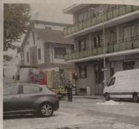
L'incidente è avvenuto poco prima delle 9 di ieri

PECETTO Pistola in pugno, un uomo si è presentato alle 8 e ha costretto la direttrice a consegnargli tutti i soldi