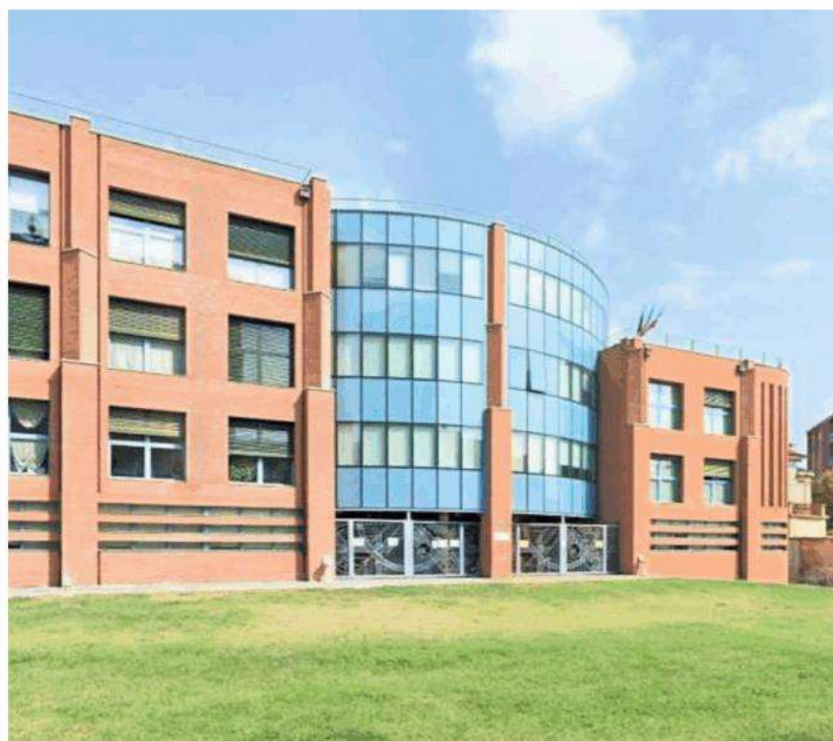
La sede Asl To5 di Chieri. Il tema dell'ospedale unico tornerà in Consiglio regionale con un question time

La telenovela sta per finire? Chissà. Le posizioni sono rimaste note: la Regione preferisce l'area dell'ex autoparco militare di Cambiano a quella di Moncalieri-Trofarello (Vadò) e Villastellone. Con i sindaci della prima cintura sud a protestare per i punteggi assegnati ai vari siti secondo l'ultimo studio regionale. Quello che ha visto Cambiano passare al primo posto, grazie all'inserimento di un parametro in più: l'ampiezza dell'area a disposizione. La commissione tecnica ha dato all'ex autoparco militare il massimo punteggio, così da ribaltare i prece-