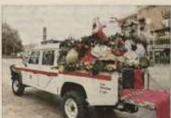
Musica e foto ricordo con Babbo Natale