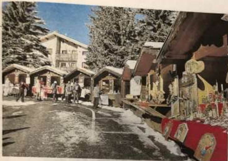
Mercatini di Natale, tra le altre località della provincia, nel fine settimana anche a Pragelato (sopra) e, l'8 dicembre, a Susa (a lato)