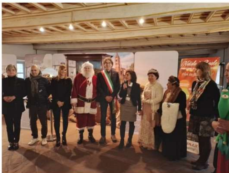
Alla Palazzina di Stupinigi si respira già l'aria delle feste, inaugurato "Natale è Reale"