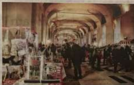
Il mercatino e tanto altro all'interno della Palazzina di Caccia

zione, fra i tantissimi articoli di artigianato, enogastronomia e oggetti solidali. Non mancherà il Xmas Street Food, situato all'interno e con varie proposte genuine e a km zero.