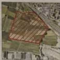
Ospedale unico: si torna in pista Vadò, alternativa a Cambiano