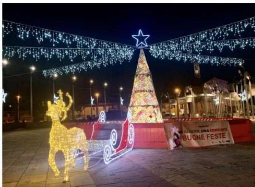
La Magia del Natale a Nichelino: un mese ricchissimo di appuntamenti ed eventi

Dopo l'inaugurazione di "Natale è Reale" alla Palazzina di Stupinigi, il calendario completo delle iniziative